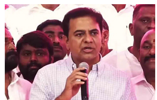
ఉన్నా తెలంగాణ మట్టితో మమేకమైన వాడికి, ఉద్యమాల ఉగ్రపాటు తాగిన వాడికి, ఆత్మగౌరవ పోరాటంలో కలిసి ఆడుగు వేసిన వాళ్లకి మాత్రమే జాతి అంటే ఏంటో తెలుస్తుంది, జాతి గౌరవం అంటే ఏంటో తెలుస్తుందన్నా రు కేసీఆర్. సకల జనులు స్వరాష్ట్ర సమరంలో తెగించి కొట్లాడుతున్నప్పుడు, ప్రాణాలకు తెగించి మన నాయకుడు నిరాహార దీక్ష చేస్తున్నప్పుడు, సమైక్యంగా ప్ర వాదుల సంచులు మోసి సన్నాసులకు జాతి తెలవదు, నీతి తెలవదు. లాఠీ దెబ్బలు తిన్నాళ్లకు, జైళ్లకు పోయాళ్లకు, తుపాకు లకు ఎదురుపడి నిలబడ్డోళ్లకు జాతి అంటే ఏంటి..? జాతి అస్తిత్వం అంటే ఏంటో తెలుస్తుంది..? ఉద్యమకారుల మీదికి తుపాకులు తీసుకొని ఆ రోజు దాడికి వెళ్లిన డ్రోహులకు జాతి నిర్వచనం ఎట్లా తెలుస్తుంది..? రక్తంలో పౌరపం ఉంటే, డిపాస్టులో ఉద్యమం జాతి అంటే ఏంటో, ఆత్మాభిమానం అనేది ఎక్కడన్నా రు నీ తరంగంలో ఉంటే నీకు జాతి అంటే ఏంటో, జాతి చరిత్ర అంటే ఏంటో తెలుస్తుంది. కానీ జై తెలంగాణ నినాదం ఇయ్యడానికే భయపడేదోళ్లకు, కిరాయి సర్కార్లకు తెలంగాణ సోయం లేని సన్నాసులకు జాతి విలువ ఎన్నటికీ తెలవదన్నా రు. జల్, జంగల్, జమీన్ అని కొట్లాడిన కొమురం భీముడి జాతి మాది.. ఆడుగుతున్నారా కొంతమంది.. కేసీఆర్ ఏ జాతికి నువ్వు జాతి పిత.. ఏ జాతి అని మాట్లాడుతున్నావు..? వాడికి నేను చెప్పా ఉన్నా ఏ జాతి అని అవాకులు చెవాకులు పేలుతున్న అల్లుడికి, అల్లులకు చెప్పా ఉన్నా రాజ్యతంత్రం నడిపిన రాజీ రుద్రమ్మ జాతి