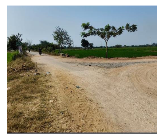
ఓట్లు కావాలంటే గ్రామాలకు వస్తారు. హామీలు ఇస్తారు. కానీ సమస్యలు పరిష్కరించాలైన సమయంలో మాత్రం ఎందుకు

మన మహతి న్యూస్ ప్రతినిధి నారాయణపేట జిల్లా మక్తల్ నియోజకవర్గం ప్రజల తరఫున పాలకులకు, అధికారులకు ప్రధాన సమస్య దృష్టికి తీసుకొస్తున్న మక్తల్ టౌన్ నుండి అనుగంగా గ్రామానికి వెళ్లె ప్రధాన రహదారి పరిస్థితి మీకు తెలియదా? అది రహదారిగా ఉండా లేక మట్టి దారిగా ఉండా? దాంబర్ రోడ్డు అనే పేరుకే ఉంది గానీ, వాస్తవంగా చూస్తే అది పూర్తిగా పాడైపోయింది. ప్రతిరోజూ ఆ దారిలో ప్రయాణించే ప్రజలు అనుభవిస్తున్న కష్టాలు మీకు కనిపించవా? ఈ రహదారి మీద ఎన్నో గ్రామాలు ఆధారపడి ఉన్నాయి. రైతులు తమ పంటలను మార్కెట్ కు తీసుకెళ్లడానికి ఇబ్బంది పడుతున్నారు. విద్యార్థులు పాఠశాలకు వెళ్లెందుకు కష్టాలు పడుతున్నారు. రోగులు ఆసుపత్రులకు చేరుకునేలోపే మరింత ప్రమాదంలో పడుతున్నారు. ఇంత జరుగుతున్నా జిల్లా నాయకులు, మండల నాయకులు, ముఖ్యంగా పాలకులు ఎందుకు మౌనంగా ఉన్నారు? ఆ గ్రామ ప్రజలు ఓటు వేయలేదా? ఎన్నికల సమయంలో మీపై నమ్మకం ఉందా?