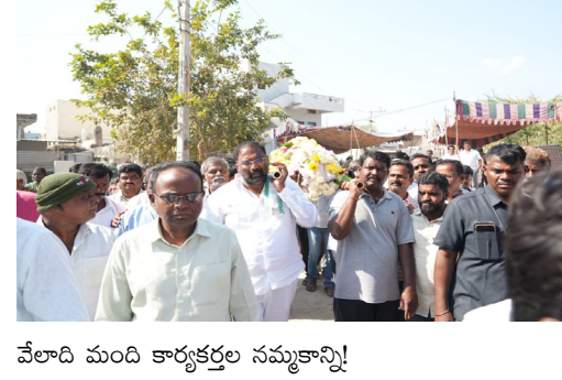
వేలాది మంది కార్యకర్తల నమ్మకాన్ని!

మన మహతి న్యూస్ ప్రతినిధి నారాయణపేట జిల్లా మక్తల్ నియోజకవర్గం. పదవి అంటే అధికారం కాదు.. అందగా నిలబడటం అని చాటారు. హోదా అంటే అజ్ఞాపించడం కాదు.. ఆత్మీయతను పంచడమని నిరూపించారు. ముఖ్యమంత్రి పక్కన కూర్చునే ఆ పీఠం కంటే.. కార్యకర్త కష్టంలో తోడుండే ఆ నిలువెత్తు రూపమే గొప్పదని చాటిచెప్పారు! కార్యకర్త ఇంటింటా విషాదం నిండిన వేళ.. కన్నతండ్రిని కోల్పోయి ఆ బిడ్డ కన్నీరు మున్నీరైన వేళ.. మంత్రి అన్న గర్భం వీడి.. ప్రోటోకాల్ గోడలు దాటి.. సామాన్యుడిలా కదిలివచ్చారు మా "పెద్దన్న"గా. మీరు మోసింది కేవలం ఒక పార్లమెంట్ దేహాన్ని మాత్రమే కాదు..