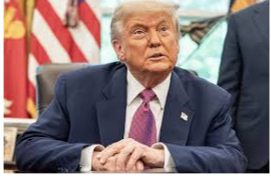
అమెరికా : సుంకాల విధింపు చెల్లడంబా అమెరికా సుప్రీం కోర్టు తీర్పు నేపథ్యంలో బ్రాంట్ ప్రభుత్వానికి కొత్త వికల్పాలు

మొదలయ్యాయి. సుంకాల వల్ల ఇప్పటివరకూ అధిక ధరలు చెల్లించిన అమెరికన్ కస్టమర్లు తమకు రీఫండ్స్ కావాలని పట్టుబడుతున్నారు. ఈ జాబితాలో బ్రాంట్ రాజకీయ ప్రత్యర్థులతో పాటు కార్పొరేట్ కంపెనీలు కూడా ఉన్నాయి. అయితే, ఈ ప్రక్రియ అంత సులభం కాదని అక్కడి నిపుణులు చెబుతున్నారు. తాను విధించిన సుంకాల భారం విదేశీ ఎగుమతిదారులపై తప్ప సామాన్య అమెరికన్లు, అమెరికా దిగుమతిదారులపై లేదని బ్రాంట్ ఇప్పటివరకూ చెబుతూ వచ్చారు. అయితే, ఆయన రాజకీయ ప్రత్యర్థులు మాత్రం ఈ భావనతో మొదటి నుంచి విభేదిస్తున్నారు. అధిక సుంకాల భారాన్ని సామాన్య అమెరికన్ల భారం చాల్చి వచ్చిందని మండిపడేవారు. ఇక సుప్రీం తీర్పు తరువాత ఇల్లియాద్ రాష్ట్ర గవర్నర్ సుంకాల రీఫండ్స్ కోరుతూ బ్రాంట్ ను బిల్లులు వంపించారు. సుంకాల కారణంగా తమ రాష్ట్రం 9 బిలియన్ డాలర్లు అధికంగా చెల్లించాల్సి వచ్చిందని అన్నారు. తమ