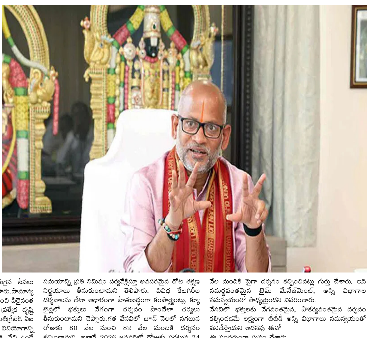
సమయాన్ని ప్రతి నిమిషం పర్యవేక్షిస్తూ అవసరమైన చోట తక్షణ నిర్ణయాలు తీసుకుంటామని తెలిపారు. వివిధ కేటగిరీల దర్శనాలను డేటా ఆధారంగా హేతుబద్ధంగా కంపౌండ్లు, క్యూలైన్లలో భక్తులు వేగంగా దర్శనం పొందేలా చర్యలు తీసుకుంటామని చెప్పారు. గత వేసవిలో జూన్ నెలలో సగటున రోజుకు 80 వేల నుంచి 82 వేల మందికి దర్శనం కల్పించామని, అలాగే 2026 జనవరిలో రోజుకు సగటున 74