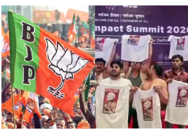
వ్యాఖ్యలు ఏపీలో ఉద్రిక్తతకు దారితీసాయి. ఏపీలోని పలు జిల్లాల్లో బీజేపీ యువమోర్చా శ్రేణులు కాంగ్రెస్ పార్టీ జిల్లా లో కాంగ్రెస్ పార్టీ కార్యాలయం చేసుకుంది.

అమరావతి : ఏపీలో రాజకీయ వాతావరణం వేడెక్కింది. ఇప్పటికే కూటమి వర్షం వైసీపీ మధ్య రాజకీయం పతాక స్థాయికి చేరింది. ఇదే సమయంలో ఢిల్లీలో చోటు చేసుకున్న పరిణామాలు ఏపీలోని పలు జిల్లాల్లో ప్రభావం చూపించాయి. ఢిల్లీలో జరిగిన ఏపి ఇంఫాక్ట్ సమితి లో యూత్ కాంగ్రెస్ చేసిన నిరసన పైనే బీజేపీ సహా పలు పార్టీలు ఆగ్రహం వ్యక్తం చేస్తున్నాయి. వైసీపీ, బీఆర్ఎస్ నేతలు సైతం ఈ తీరును తప్పు బట్టారు. కాగా.. తాజాగా ఏపీలోని కాంగ్రెస్ కార్యాలయాల పైనే బీజేపీ మద్దతు దారులు దాడులు చేయటం సంచలన సంగా మారింది. తాజాగా ఢిల్లీలో జరిగిన ఏపి ఇంఫాక్ట్ సమితి లో యూత్ కాంగ్రెస్ శ్రేణులు చొక్కాలు లేకుండా సదస్సు జరుగుతున్న ప్రాంతంలో చేసిన నిరసన.. ఆ తరువాత రాహుల్ గాంధీ చేసిన వ్యాఖ్యల వ్యవహారం కలకలాపం మారింది. ఈ అంశం పైనే బీజేపీ నేతలు సీరియస్ గా స్పందించారు. యూత్ కాంగ్రెస్ తీరును తప్పు