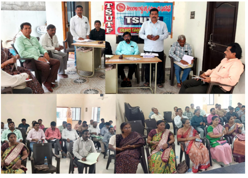
మన మహాత్మి న్యూస్, కొత్తగూడెం తెలంగాణ రాష్ట్ర బిల్లు ఉపాధ్యాయ ఫెడరేషన్ భద్రాద్రి కొత్తగూడెం జిల్లా కమిటీ సమావేశం తీవ్రస్వరూపంలో జిల్లా అధ్యక్షులు బి.

పెండింగ్ బిల్లులు వెంటనే చెల్లించాలి రేషన్ కార్డులను జీవో 25ను రద్దు చేయాలి