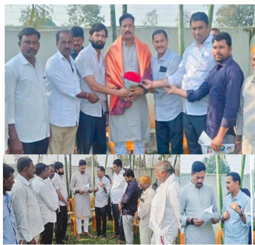
కేంద్రంలో బంజారా మ్యూజియం ఏర్పాటు చేయాలన్నారు. లక్ష్మీదేవిపల్లి మండలంలోని ఇల్లయం క్రాస్ రోడ్ వద్ద ప్రధాన రహదారి కూడలిలో తెలంగాణ రైతాంగ సాయుధ పోరాట