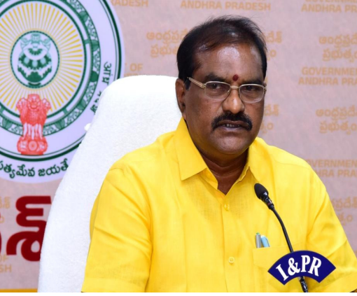
అతర్వదించాలన్నారు. రాజధాని నిర్మాణంతో యువతకు ఉద్యోగ, ఉపాధి అవకాశాలు పెరుగుతాయని తెలిపారు. రూ. 240 కోట్ల కుంభకోణం.. తిరుపతి లడ్డూ తయారీలో రూ. 240 కోట్ల కుంభకోణం జరిగిందని సీబీఐ తన ఛార్జిషీట్ లో ప్రస్తావించిందని

పశ్చిమగోదావరి జిల్లా, ఫిబ్రవరి 22 : వైసీపీ అధినేత వైఎస్ జగన్ మోహన్ రెడ్డిపై ఏపీ మంత్రి నిమ్మల రామానాయుడు తీవ్ర ఆగ్రహం వ్యక్తం చేశారు. కలియుగ దైవం వేంకటేశ్వరస్వామి లడ్డూను కట్టి చేసిన జగన్ కి తిరుపతి పేరు ఎత్తే అర్హత లేదని ధ్వజమెత్తారు. లడ్డూలో కలిసింది రసాయనాల మిశ్రమాలు తప్ప.. నెయ్యి లేదని సీబీఐ తన ఛార్జిషీట్ లో ప్రస్తావించినా.. ఏ మొహం పెట్టుకొని ఆయన ఇంకా మాట్లాడుతున్నారని మండిపడ్డారు. మహిళల ఆర్థిక అభివృద్ధి కోరుకుంటూ స్వర్ణీయ ఎస్టీఆర్ వారిని ఎంతో ప్రోత్సహించారని తెలిపారు. దివ్యాంగులపై కనికరం చూపలేదని దివ్యాంగులపై వైసీపీ ప్రభుత్వం కనికరం చూపలేదని మంత్రి నిమ్మల రామానాయుడు ఫైర్ అయ్యారు. కూటమి ప్రభుత్వం చిత్తశుద్ధితో అర్హులందరికీ పింఛన్లని అందిస్తోందని వివరించారు. ఇవాళ (ఆదివారం) పశ్చిమగోదావరి జిల్లాలోని యలవంచపై మండలం కొంతేరు గ్రామంలో రూ. 58 లక్షల వ్యయంతో అభివృద్ధి పనులు మంత్రి నిమ్మల రామానాయుడు శంకుస్థాపనలు చేశారు. ఈ సందర్భంగా ఆయన మాట్లాడారు. ప్రజా సంక్షేమ కోసం నిరంతరం పాటుపడుతున్న కూటమి ప్రభుత్వాన్ని ప్రజలు