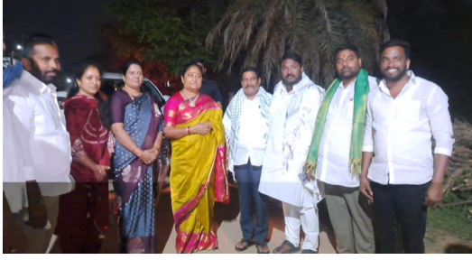
నాయకులు కుసన సంతోష్, మహేష్ తదితరులు పాల్గొన్నారు