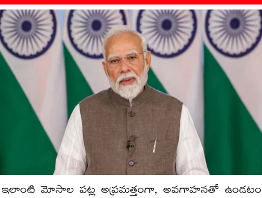
ఇలాంటి మోసాల పట్ల అప్రమత్తంగా, అవగాహనతో ఉండటం

న్యూఢిల్లీ : దేశంలో డిజిటల్ మోసాలను పెరిగిపోతున్నాయి. శాంతి భద్రతల పరిరక్షణ కంటే డిజిటల్ మోసాలను కట్టిడి చేయటం పోలీసులకు పెద్ద కష్టంగా మారింది. ప్రజలలో అవగాహన కల్పిస్తున్నా సరే ఎక్కడో ఒక చోట ప్రజలు మోసపోతూనే ఉన్నారు. ఈ క్రమంలో తాజాగా నేడు మన కీ బాత్ కార్యక్రమంలో ప్రధాని సరేంద్ర మోడీ డిజిటల్ మోసాలపై ప్రజలను అప్రమత్తం చేశారు. డిజిటల్ అరెస్ట్ పై ప్రధాని మోడీ వ్యాఖ్యలు ప్రధానమంత్రి మన కీ బాత్ కార్యక్రమంలో డిజిటల్ అరెస్ట్ గురించి మరోసారి ప్రస్తావించారు. డిజిటల్ అరెస్ట్, డిజిటల్ మోసాలపై సమాజంలో ఇప్పటికే చాలా అవగాహన వచ్చిందన్నారు. అయితే ఇటువంటి సంఘటనలు ఇప్పటికీ మన చుట్టూ జరుగుతున్నాయన్నారు. ఇవి క్షమించరానివని, డిజిటల్ అరెస్టుకు, ఆర్థిక మోసానికి అమాయకులు గురవుతున్నారని ఆందోళన వ్యక్తం చేశారు.