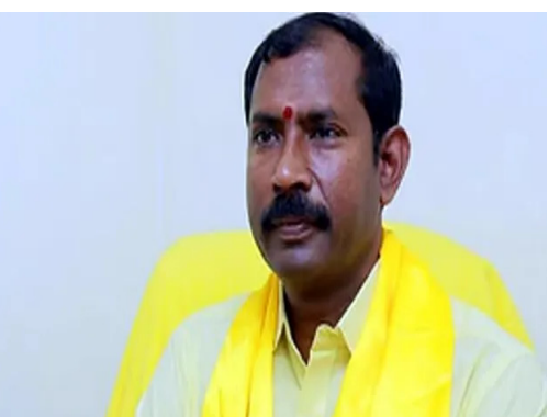
చులకనగా చూడటం దారుణం. ఆయన హయాంలో సుమారు 300 ఆలయాలపై దాడులు జరిగాయి. ఒక్కసారి కూడా వాటిని