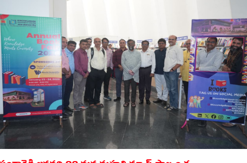
సంగారెడ్డి, జనవరి 23, మన మహతి స్వస్తి పాల్వంచ... హైదరాబాద్ ఐఐటీ హైదరాబాద్ నాలెడ్జ్ రిసోర్స్ సెంటర్ (కే రెన్) ఆధ్వర్యంలో సంస్థలో తొలిసారిగా వార్షిక పుస్తక ప్రదర్శన--