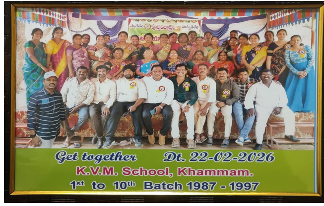
ఆత్మీయ సమ్మేళనం స్థానిక గాల్గూడెం లో గల చేరుకూరి