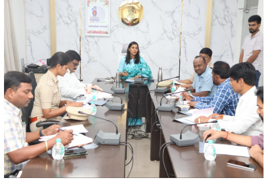
సంగారెడ్డి, ఫిబ్రవరి 23,మన మహతి న్యూస్ : ప్రజా సమస్యల సత్వర పరిష్కారం కోసం నిర్వహిస్తున్న ప్రజావాణి కార్యక్రమానికి అత్యంత ప్రాధాన్యత ఇచ్చి అందిన