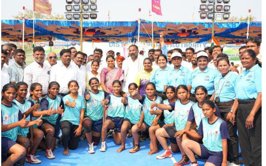
క్రీడల్లో రాణించి మక్తల్ కు పేరు తీసుకురావాలని విద్యార్థులను ఉద్దేశించి వారికి హితబోధ చేశారు. కాంగ్రెస్ ప్రభుత్వం పచ్చాక గ్రామీణ క్రీడాకారులను వెలికి తీసేందుకు స్పోర్ట్స్ పాలసీ తీసుకొచ్చిందని గుర్తు చేశారు. అటు ఆడే సమయంలో క్రీడాకారులకు ఏదైనా గాయం అయితే వారికోసం గచ్చిబౌలి లో హాస్పిటల్ నిర్మించనున్నట్లు తెలిపారు.మక్తల్ లోనిర్వహించిన

మన మహతి న్యూస్ ప్రతినది నారాయణపేట జిల్లా మక్తల్ నియోజకవర్గం. సెకండ్ ఎడిషన్ సీఎం కప్ రాష్ట్ర స్థాయి కబడ్డీ పోటీల ముగింపు సభలో మంత్రి వాకిటి శ్రీవారిమక్తల్ లో నాలుగు రోజుల పాటు జరిగిన సెకండ్ ఎడిషన్ సీఎం కప్ కబడ్డీ ఛాంపియన్ షిప్ పోటీలు ఘనంగా ముగిశాయి. ముగింపు వేడుకలకు రాష్ట్ర క్రీడా శాఖ మంత్రి వాకిటి శ్రీవారి ముఖ్య అతిథి గా హాజరై విజేతలకు బహుమతులు అందజేశారు. పైనల్లో పురుషుల విభాగంలో రంగారెడ్డి జిల్లా జట్టు పై వసవర్తి జిల్లా 20 పాయింట్ల తేడాతో గెలుపొందిగా, మహిళల విభాగంలో రంగారెడ్డి జిల్లా జట్టు పై జోగులాంబ గద్వాల జిల్లా జట్టు 5 పాయింట్ల తేడా తో గెలుపొందింది. ఇరు జట్ల మధ్య ఆడుతున్న తీరును మంత్రి శ్రీవారి స్వయంగా వీక్షించారు. విజేతలకు శుభాకాంక్షలు తెలియజేసిన మంత్రి ఈ సందర్భంగా మాట్లాడుతూ..నాలుగు రోజుల పాటు మక్తల్ లో అంగరంగ వైభవంగా కబడ్డీ పోటీలు జరిగాయన్నారు. 33 జిల్లాల నుండి సుమారు 1200 మంది క్రీడాకారులు ఈ పోటీల్లో పాల్గొన్నారు తెలిపారు.మక్తల్ ప్రాంతానికి కబడ్డీ కి అవినాభావ సంబంధం ఉందని తెలియజేశారు.మైదానం మాత్రమే క్రీడలో ఓడినా కూడా మళ్ళీ గెలిచే కని వచ్చేలా చేస్తుందని పేర్కొన్నారు.విద్యార్థులు చిన్న చిన్న సమస్యలకు మానసికంగా కుంగి పోతున్నారని ఆవేదన వ్యక్తం చేశారు. క్రీడలు మాత్రమే వీలన్నిటికీ పరిష్కారం చూపగలవని ఆశాభావం వ్యక్తం చేశారు.ఓటమి గెలువనకు తొలి మెట్లు అని క్రీడాకారులకు సూచించారు.క్రీడలపై ఆశ,శ్వాస ఉంటేనే ఉత్తమ క్రీడాకారులుగా రానిస్తారని మంత్రి పేర్కొన్నారు. ప్రపంచాన్ని వదిలి క్రీడలపై ధ్యాన పెడితే ప్రపంచం మొత్తం మీ వైపు చూస్తుందన్నారు. మక్తల్ లో 25 కోట్ల తో స్టేడియం త్వరలో నిర్మించబోతున్నట్లు మంత్రి తెలియజేశారు.రాణియే రోజుల్లో అంతర్జాతీయ స్థాయిలో