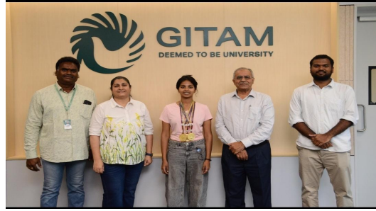
హైదరాబాద్ లోని లాల్ బహదూర్ శాస్త్రి స్టేడియంలో నిర్వహించారు. పికిల్ బాల్ ఉమెన్స్ సింగిల్స్, ఉమెన్స్ డబుల్స్, మిక్స్ డ్ డబుల్స్ పోటీలలో ఆశ్రిత నెగ్గు మూడు బంగారు పతకాలను కైవసం చేసుకుంది. ఈ ప్రతిష్టాత్మక టోర్నమెంటును తెలంగాణ స్పోర్ట్స్ అథారిటీ జనవరి 8 నుంచి ఫిబ్రవరి 26వ తేదీ వరకు నిర్వహిస్తోంది. ఈ ఛాంపియన్ షిప్ లో హ్యాండ్ బాల్, వెయిట్ లిఫ్టింగ్, వవర్ లిఫ్టింగ్, బిలియర్డ్స్, ఫెన్సింగ్, లాస్ టెన్నిస్, పికిల్ బాల్ వంటి పోటీలను బహుళ-స్థాయి ఫార్మాట్ లో జరుపుతున్నారు. గ్రామ పంచాయతీ స్థాయిలో ప్రారంభమై, తరువాత మండల, పట్టణ స్థానిక సంస్థల రౌండ్ ను నిర్వహించారు. చివరిగా హైదరాబాద్ లో రాష్ట్ర స్థాయి ఫైనల్స్ నిర్వహిస్తున్నారు. ఆశ్రిత రాజు సాధించిన అద్భుతమైన