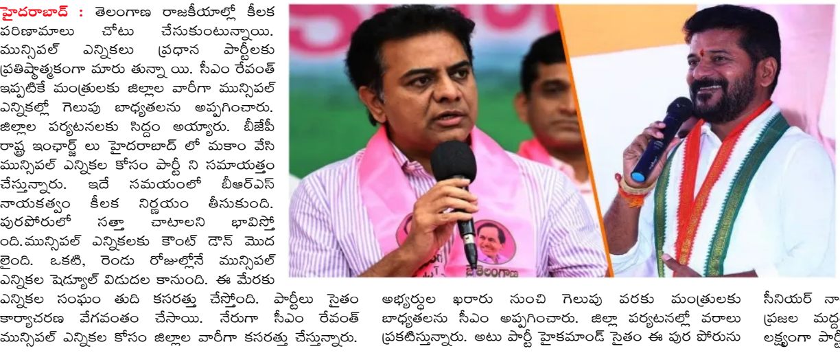
హైదరాబాద్ : తెలంగాణ రాజకీయాల్లో కీలక పరిణామాలు చోటు చేసుకుంటున్నాయి. మున్సిపల్ ఎన్నికల ప్రధాన పార్టీలకు ప్రతిష్టాత్మకంగా మారుతున్నాయి. సీఎం రేవంత్ ఇప్పటికే మంత్రులకు జిల్లాల వారీగా మున్సిపల్ ఎన్నికల్లో గెలుపు బాధ్యతలను అప్పగించారు. జిల్లాల పర్యటనలకు సిద్ధం అయ్యారు. బీజేపీ రాష్ట్ర ఇంఛార్జ్ లు హైదరాబాద్ లో మకాం వేసి మున్సిపల్ ఎన్నికల కోసం పార్టీ ని సమాయత్తం చేస్తున్నారు. ఇదే సమయంలో బీఆర్ఎస్ నాయకత్వం కీలక నిర్ణయం తీసుకుంది. పురపాలకలో సత్తా చాటాలని భావిస్తోంది. మున్సిపల్ ఎన్నికలకు కొంటే డాక్ మొదలైంది. ఒకటి, రెండు రోజుల్లోనే మున్సిపల్ ఎన్నికల షెడ్యూల్ విడుదల కానుంది. ఈ వేరకు మున్సిపల్ ఎన్నికల కోసం జిల్లాల వారీగా కనరత్తు చేస్తున్నారు.

తెలంగాణ రాజకీయాల్లో కీలక పరిణామాలు చోటు చేసుకుంటున్నాయి