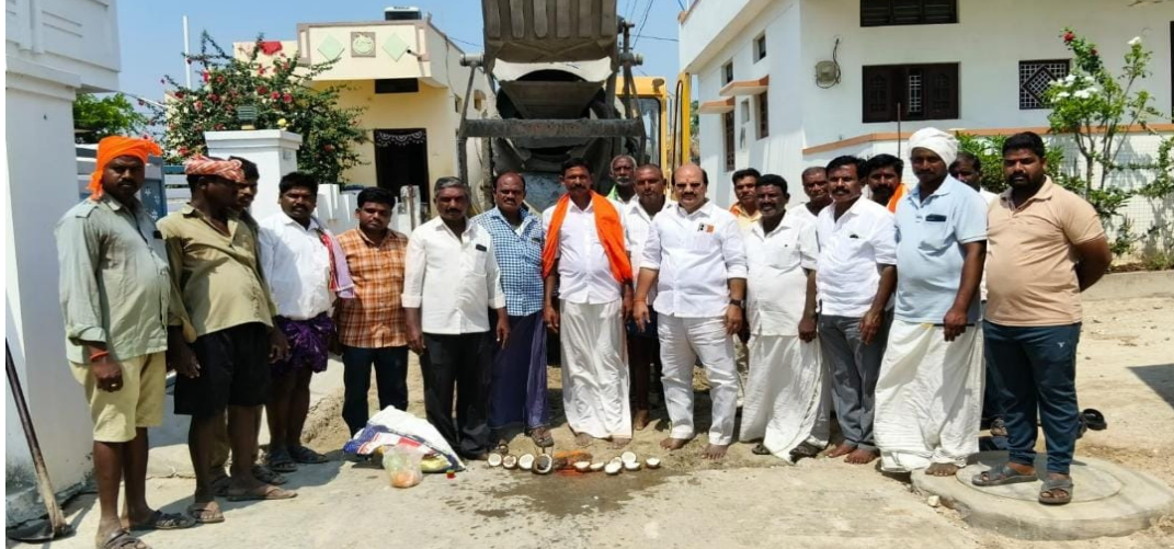
చేసిన సహకారానికి హృదయపూర్వక కృతజ్ఞతలు తెలిపారు.