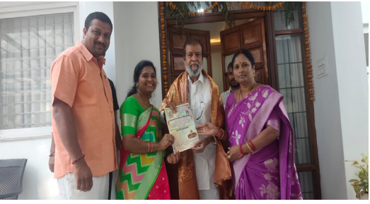
సంగారెడ్డి, మార్చి 26, మన మహాత్మి న్యూస్: అంతర్జాతీయ మహిళా దినోత్సవాన్ని పురస్కరించుకుని సంగారెడ్డి జిల్లా వీరశైవ లింగాయత్ సమాజం ఆధ్వర్యంలో ఈ నెల 29వ తేదీన నిర్వహించనున్న వేడుకలకు ప్రముఖులను ఆహ్వానించారు. ఈ కార్యక్రమానికి రాష్ట్ర ఆరోగ్య శాఖ మంత్రి