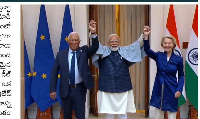
యూనియన్ దేశాలకు అనేక అవకాశాలను కల్పిస్తుంది. ఈ వాణిజ్య ఒప్పందం వల్ల భారత్లో తయారీకి మంచి జరుగుతుంది. దానితో పాటు తయారీతో సంబంధం ఉన్న రంగాలు కూడా బాగా విస్తరిస్తాయి. ఈ స్వేచ్ఛా వాణిజ్య ఒప్పందం అంతర్జాతీయ వ్యాపారవేత్తలకు, పెట్టుబడిదారులకు భారత్ పట్ల సమ్మతం మరింత పెరుగుతుంది. భారత్ ఈ రోజు అన్ని రంగాలలో ప్రపంచ భాగస్వామ్యంపై దృష్టి సారిస్తోంది. ఎన్టీ రంగం విషయానికి వస్తే ఆ రంగంలో ముడిపడి ఉన్న వివిధ చోట్ల పెట్టుబడులకు చాలా అవకాశాలు ఉన్నాయి. ఈ డీల్? ఇరువర్గాల మధ్య వాణిజ్యాన్ని పెంపొందించడమేగాక ప్రజాస్వామ్యం, చట్టబద్ధమైన మన నిబద్ధతను బలోపేతం చేస్తుంది.

న్యూఢిల్లీ : భారత్-యూరోపియన్ యూనియన్ మధ్య చరిత్రాత్మక స్వేచ్ఛా వాణిజ్య ఒప్పందం. ఇండియన్ ఎన్టీపీటీ వేదికగా ప్రధాని నరేంద్ర మోదీ ఈ విషయాన్ని ప్రకటించారు. ప్రపంచ 25 శాతం, ప్రపంచ వాణిజ్యంలో మూడో వంతు పాటూ కలిగిన ఈ ఒప్పందాన్ని 'మదర్ ఆఫ్ డీల్స్'గా ప్రధాని అభివర్ణించారు. సోమవారం ఈ కీలక ఒప్పందంపై సంతకాలు జరిగాయని మోదీ వెల్లడించారు. ఈ ఒప్పందం వల్ల 140 కోట్ల మంది భారతీయులకు, కోట్లాది మంది యూరోపియన్లకు అపారమైన అవకాశాలు లభిస్తాయని పేర్కొన్నారు. భారత్- ఈయూ ట్రేడ్ డీల్ ప్రపంచంలోని రెండు ప్రధాన ఆర్థిక వ్యవస్థల మధ్య భాగస్వామ్యాల కి ఒక అద్భుతమైన ఉదాహరణ అని చెప్పారు. ట్రిబియన్, యూరోపియన్ ఫ్రీ ట్రేడ్ అసోసియేషన్ ఇప్పటికే ఉన్న ఒప్పందాలకు ఇది అదనపు బలాన్ని ఇస్తుందని చెప్పారు. ప్రపంచ సపై చెయ్యి మరంత బలోపేతం అవుతుందని తెలిపారు. ఈ స్వేచ్ఛా వాణిజ్య ఒప్పందం ద్వారా అంతర్జాతీయ వ్యాపారవేత్తలకు, పెట్టుబడిదారులకు భారత్ పట్ల సమ్మతం మరింత పెరుగుతుందని పేర్కొన్నారు. ఈ ఒప్పందం కేవలం తయారీ రంగాన్నే కాకుండా, సేవా రంగాన్ని కూడా భారీగా విస్తరిస్తుందని మోదీ ఆశాభావం వ్యక్తం చేశారు. వస్త్రాలు, రత్నాలు, ఆభరణాలు, తోలు, పాదరక్షలు వంటి రంగాలతో సంబంధం ఉన్న వారిని ఈ సందర్భంగా ప్రధాని అభినందించారు. ఈ ఒప్పందం ఈ రంగాల్లోని వారికి ఉపయోగపడుతుందని వివరించారు. "సోమవారం అతి కీలకమైన భారత్- ఈయూ ఒప్పందం పైనలే అయ్యింది. దీనిని ప్రపంచవ్యాప్తంగా మదర్ ఆఫ్ డీల్స్ గా అభివర్ణిస్తున్నారు. ఈ స్వేచ్ఛా వాణిజ్య ఒప్పందం 140 కోట్ల భారతీయులకు, కోట్లాది యూరోపియన్