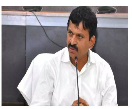
- వర్తన్పేటలో రూ.294 కోట్ల అభివృద్ధి పనులకు శంకుస్థాపన