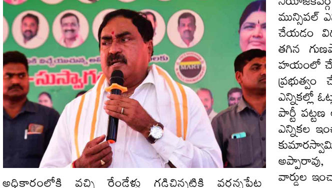
అధికారంలోకి వచ్చి రేంజేట్లు గడిచిపోయి వర్షాపేట