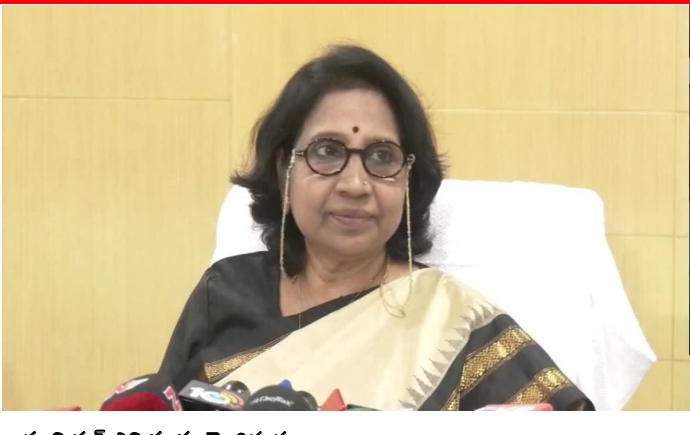
- మున్సిపల్ ఎన్నికలకు మోగిన నగారా - 116 మున్సిపల్ స్టాంబులు, 7 కార్పొరేషన్లకు నోటిఫికేషన్ - ఓట్లు వినియోగించుకోనున్న 52 లక్షల మందికిపైగా ఓటర్లు - రాష్ట్రంలో ఫిబ్రవరి 11న మున్సిపల్ ఎన్నికలు

హైదరాబాద్ : తెలంగాణలో మున్సిపల్ ఎన్నికల షెడ్యూల్ విడుదలైంది. రాష్ట్రంలోని ఏడు నగరపాలక సంస్థలు, 116 మున్సిపాలిటీలకు ఎన్నికలు జరుగునున్నాయి. అన్ని జిల్లాల కలెక్టర్లు, ఎస్సీలు, పోలీసు కమిషనర్లతో రాష్ట్ర ఎన్నికల కమిషనర్ రాణికు ముదిని సమావేశమై ఎన్నికల నిర్వహణపై చర్చించారు. అనంతరం ఎన్నికల షెడ్యూల్ను విడుదల చేశారు. షెడ్యూల్ విడుదలతో తక్షణమే రాష్ట్రవ్యాప్తంగా ఎన్నికల కోడ్ అమల్లోకి వచ్చింది. ఈ నెల 28 వ తేదీ నుంచి నామినేషన్లు స్వీకరించనున్నారు. ఈ నెల 30వ తేదీతో నామినేషన్ల స్వీకరణకు గడవు ముగియనుంది. ఈ నెల 31న ప్రూవీనిస్ నిర్వహించి పోటీలో ఉన్న అభ్యర్థుల జాబితా వెల్లడించనున్నారు. ఫిబ్రవరి 1న తిరస్కరణకు గురైన నామినేషన్లపై అభ్యంతరాలను స్వీకరించనున్నారు. ఫిబ్రవరి 3వ తేదీ నామినేషన్ల ఉపసంహరణకు తుదిగడుపు. అదేరోజు అభ్యర్థులు తుది జాబితా ప్రకటించనున్నారు. ఈ ఎన్నికల్లో మొత్తం 52 లక్షల 43 వేల మందికిపైగా ఓటర్లు తమ ఓటు హక్కును వినియోగించుకోనున్నారు. ఫిబ్రవరి 11న పోలింగ్ జరగనుంది. ఫిబ్రవరి 13న కౌంటింగ్ నిర్వహించి ఫలితాలను వెల్లడించనున్నారు.