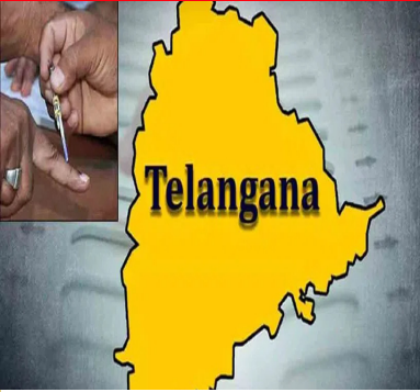
- ఫిబ్రవరి 13న మున్సిపల్ ఎన్నికల ఓట్ల లెక్కింపు - రిపోలింగ్ ఎక్సలెన్సా ఉంటే ఫిబ్రవరి 12న నిర్వహణ - రేవెన్యూ నుంచి ఈనెల 30 వరకు నామినేషన్ల స్వీకరణ - ఈనెల 31న అభ్యర్థుల నామినేషన్ల పరిశీలన - నామినేషన్ల ఉపసంహరణకు ఫిబ్రవరి 3 వరకు గడువు