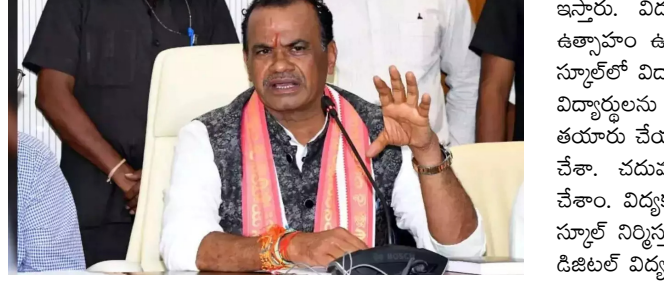
మోదీని కలిస్తే చెయ్యి, 2 వేల కోట్ల రూపాయల నిధులైనా ఇస్తారు. విద్యతోనే సమాజం అభివృద్ధి చెందుతుంది. నాకు ఉత్సాహం ఉంటే ఎన్నికల్లో మళ్లీ పోటీ చేస్తా. లేకుంటే ప్రతిక్ స్వార్జులో విద్యార్థులను చదివిస్తూ జీవితం గడుపుతా. ఈ స్వార్జు విద్యార్థులను ఆణిముత్యాల్లా తీర్చిదిద్ది ఐఎస్ఎస్, ఐఐఐఎస్ లుగా తయారు చేయాలి. నిజాయితీగా బతికా.. పేద కుటుంబాలను సేవా. చదువంటే ర్యాంకులు మాత్రమే కాదని ఓ ఆలోచన చేశాం. విద్యకు ప్రాధాన్యత ఇచ్చి యంగ్ ఇండియా ఇంటిగ్రేటెడ్ స్వార్జు నిర్వహిస్తాం. బొట్టుగూడ ప్రభుత్వ పాఠశాలలో పూర్తిగా డిజిటల్ విద్యను అందిస్తాం' అని అన్నారు.

నల్లగొండ, జనవరి 27: కార్పొరేట్ స్వార్జులో అధిక ఫీజులతో ప్రజలను దోచుకుంటున్నారని.. తాను విద్యాశాఖ మంత్రి అయితే సదరు స్వార్జును మూసివేయమని మంత్రి కోమటి రెడ్డి వెంకట రెడ్డి అన్నారు. విద్య వ్యాపారం కావడం తేల్చిచెప్పారు. మంగళవారం నల్లగొండ టౌన్లోని బొట్టుగూడలో కోమటిరెడ్డి ప్రతిక్ ఫౌండేషన్ ఆధ్వర్యంలో నిర్వహించిన ప్రభుత్వ పాఠశాలను ఆయన ప్రారంభించారు. అనంతరం కోమటిరెడ్డి మాట్లాడుతూ.. 'నల్లగొండ ప్రజలు రుణం తీర్చుకోవడానికే నల్లగొండ మున్సిపాలిటీని కార్పొరేషన్ చేశా. కేంద్రం నుండి నిధులు తెచ్చి నల్లగొండ రూపు రేఖలు మారుస్తా.'నను ప్రధాని సరేంద్ర