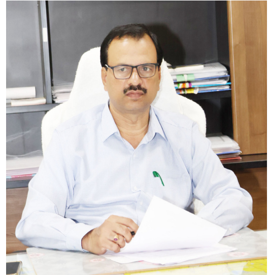
మన మహాతి న్యూస్ మేకర్ మల్లాజిగిరి జిల్లా ఫిబ్రవరి 27 తెలంగాణ ప్రభుత్వం పరిధిలోని మేడ్చల్-మల్లాజిగిరి జిల్లాలో 2025--26 రబీ సీజన్కు సంబంధించిన ధాన్యం సేకరణ