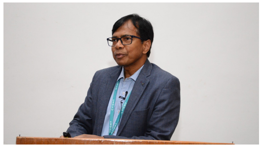
సంగారెడ్డి, ఫిబ్రవరి 27, మన మహతి న్యూస్ :