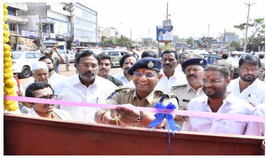
సంగారెడ్డి, ఫిబ్రవరి 27, మన మహతి న్యూస్ :

- "అరెస్ట్ అరెస్ట్ -- 2026" లో భాగంగా జహీరాబాద్ లో ట్రాఫిక్ సిగ్నల్స్ ప్రారంభం, డ్రైవర్లకు ఉచిత కంటి పరీక్షలు