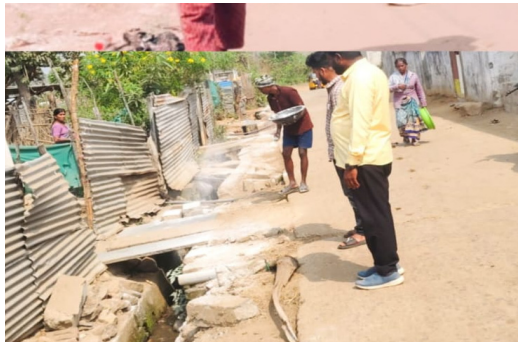
మన మహాత్మి న్యూస్ లక్ష్మీదేవి పల్లి గ్రామ ప్రజల ఆరోగ్య రక్షణను ప్రధాన లక్ష్యంగా తీసుకొని