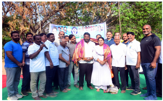
సంగారెడ్డి, మార్చి 29, మన మహాతి న్యూస్ : హ్యాపీ సందే