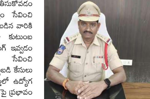
చట్టపరమైన చర్యలు తీసుకుంటామని సి.ఐ గారు తెలిపారు.

మందికి ఒక్కొక్కరికి ?2000 3.4 మందికి ఒక్కొక్కరికి 1000 4.1 వ్యక్తికి 6000 5.1 వ్యక్తికి 1500 సిరిసిల్ల పట్టణ పోలీస్ స్టేషన్ లో డ్రంక్ అండ్ డ్రైవ్ లో పట్టుబడిన మందు బాబులకు కౌన్సిలింగ్ నిర్వహించి వారితో ఇంకెప్పుడు మద్యం సేవించి వాహనాలు నడపమని ప్రతిజ్ఞ చేపించారు. అనంతరం సి.ఐ మాట్లాడుతూ... ప్రతి రోజు పట్టణ పోలీస్ స్టేషన్ పరిధిలో డ్రంక్ అండ్ డ్రైవ్ తనిఖీలు నిర్వహించారు. జరిమానా తెలిపారు. సేవించి వాహనం నడుపుతూ పట్టుబడిన