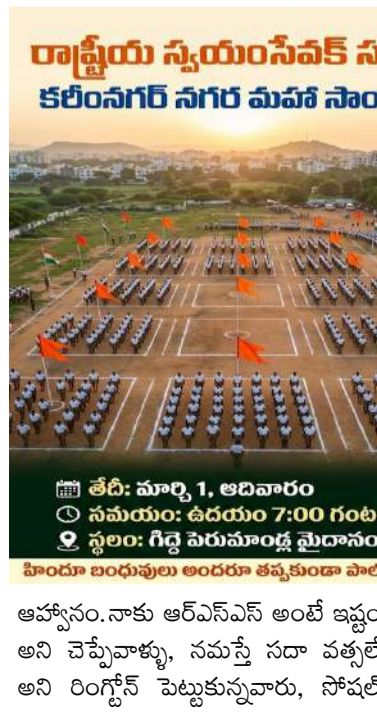
రాష్ట్రీయ స్వయం సేవక్ సంఘ కరినగర్ నగర మహాసాంఘిక మీడియా లో ఆర్ఎస్ఎస్ వేదికలను పోస్ట్ చేస్తున్నవారు, ఆర్ఎస్ఎస్ భావాల పట్ల మద్దతు గా నిలుస్తున్నవారు.. ఇలా ఎంతోమంది ఆర్ఎస్ఎస్ తో కలవకుండానే దూరంగా ఉండి మద్దతు ఇస్తున్నారు. అలాంటి వారిందరికీ ఇదే మా ఆహ్వానం.. రండి ఒకసారి శాఖ యొక్క పరిచయం చేసుకోండి, ఇన్ని సంవత్సరాల జీవితం లో మీరు ఏం కోల్పోయారో తెలుస్తుంది, ఇక మీ గిలిన జీవితం అంతా మీరు ఎమి చేయారో తెలుస్తుంది. ఆర్ఎస్ఎస్ ను విమర్శించే వాళ్ళు, ఆర్ఎస్ఎస్ నిర్దాంతాన్ని వ్యతిరేకించే వాళ్ళు, అసలు ఆర్ఎస్ఎస్ చేస్తున్న పని గురించి అవగాహన లేకుండా గుడ్డిగా మమ్మల్ని