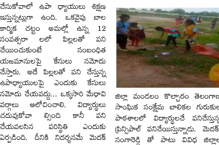
జిల్లా మండలం కొల్చారం తెలంగాణ సంఘం సంక్షేమ బాలికల గురుకుల సంఘం పాఠశాలలో విద్యార్థుల పనిచేస్తున్న పరిస్థితి ఎందుకు ఏర్పడింది. దీనికి నిదర్శనమే మెడక్

- విద్యార్థులు చదువుకోవడానికా పనిచేయడానికా? - కొల్చారం గురుకుల పాఠశాలలో విద్యార్థుల పరిస్థితి