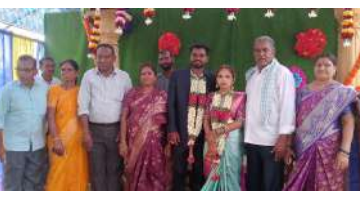
ముఖ్యఅతిథిగా విచ్చేసి వధూవరులను ఆశీర్వదించి వివాహ జీవితంలో అడుగు పెడుతున్న నవ దంపతులకు శుభాకాంక్షలు మరియు ఆశీర్వనలను అందజేసినారు వీరు ఇరువురు మంచి విద్యావంతులుగా సమాజంలో గొప్ప