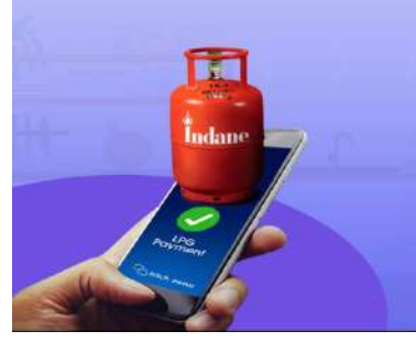
గ్యాస్ సిలిండర్లను నిల్వ చేయడం, బ్లాక్ మార్కెటింగ్ ను నిరోధించడానికే

ప్రకటించింది. అయితే పట్టణ ప్రాంతాల్లో ప్రస్తుతమున్న 25 రోజుల నిబంధననే కొనసాగిస్తుంది. ఏదేమైనా కేంద్రం తెచ్చిన కొత్త నిబంధనతో గ్రామీణ ప్రాంతాల్లోని పెద్ద కుటుంబాలకు ఇబ్బందులు ఎదురయ్యే అవకాశముంది. 5 గురి కంటే ఎక్కువ మంది ఉండే కుటుంబానికి నెలలోపే ఒక గ్యాస్ సిలిండర్ అయిపోయే క్రమంలో మిగతా రోజులకు ఎలా అన్నది ప్రశ్నార్థకం కానుంది. కాగా,