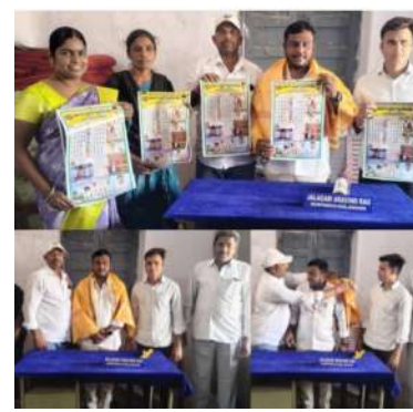
ఆవిష్కరించారు. బాధ్యతాయుతమైన జర్నలిజం అవసరం ఈ సందర్భంగా