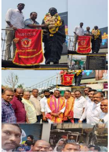
భోజనాలు చేసారు గాంధీ గారితో క్రీతం నలు నిజమైన గాంధీయా జీవితం

శ్రీరాములు 58 రోజుల ఆమరణ దీక్ష ద్వారా ప్రాణ త్యాగం చేసి ఉమ్మడి మద్రాస్ రాష్ట్రము లోని తెలుగు మాట్లాడే వారికి ప్రత్యేక ఆంధ్ర రాష్ట్రాన్ని సాధించిన మహనీయులని పెరకున్నారు అయిన త్యాగం వలన ఆంధ్ర రాష్ట్ర ము తో దేశంలో భాష ప్రయుక్త రాష్ట్రాలు ఏర్పాటు ఐద్యాయని చెప్పారు మహాత్మా గాంధీ పిలుపు మేరకు రైల్వే ఉద్యోగం వదలి గాంధీ తో పాటు స్వాతంత్ర్య ఉద్యమం లో పాల్గొన్నారు ఉప్పు సత్యాగ్రహం, దండి యాత్ర సభ్యులు ఆశ్రమం లో సేవలందించి పలు మార్లు జైలు జీవితం అభవించారు నెల్లూరు లో హరిజనులకు దేవాలయం ప్రవేశం కల్పించుటకు నిరసన దీక్ష చేసి విజయం సాధించారు వారితో సహపంక్తి