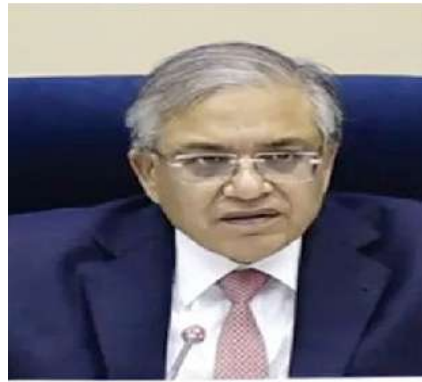
GYANESH KUMAR CHIEF ELECTION COMMISSIONER

దేశంలో మళ్లీ ఎన్నికల హడావుడి మొదలుకానుంది. బంగాల్, కేరళ, తమిళనాడు, అసోం, పుదుచ్చేరి అసెంబ్లీ ఎన్నికల తేదీలను భారత ఎన్నికల సంఘం వెల్లడించింది. ఈ మేరకు కేంద్ర ప్రధాన ఎన్నికల కమిషనర్ (సీఈసీ) జ్ఞానేశ్వుమార్, కమిషనర్లు సుశ్రీర్ సింగ్ సందూ, వివేక్ జోషిలు ఆదివారం సాయంత్రం మీడియా సమావేశం ఏర్పాటు చేసి షెడ్యూల్ అనౌన్స్ చేశారు. తమిళనాడు (234), పశ్చిమ బెంగాల్ (294), కేరళ (140), అస్సాం (126)తోపాటు పుదుచ్చేరి (30) రాష్ట్రాల్లో మొత్తంగా 824 అసెంబ్లీ స్థానాలకు ఎన్నికలు జరగనున్నాయి.