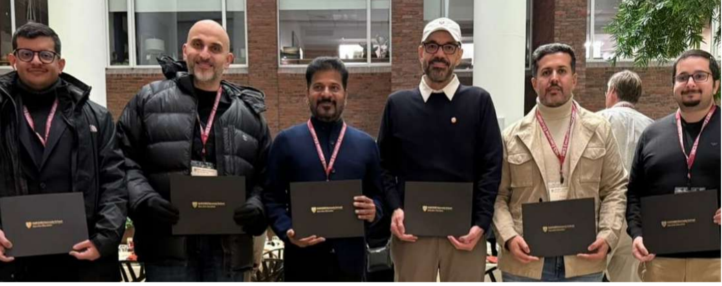
వారం రోజుల సర్టిఫికేట్ కోర్సు పూర్తి

వరుసగా తొమ్మిదోసారి బడ్జెట్ సమర్పణ అత్యధికసార్లు ప్రవేశ పెట్టిన మహిళా మంత్రిగా ఘనత