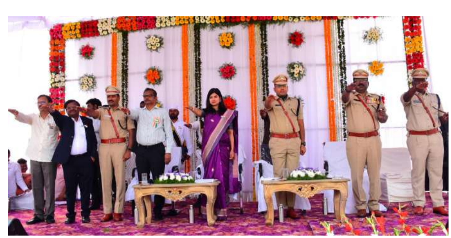
బోసను కింద చెల్లించడమైనది.

సన్నాలకు రూ. 500 బోనస్ ఈ ఖరీఫ్ లో 2 లక్షల 70 వేల మెట్రిక్ టన్నుల వరి ధాన్యం సేకరించి 645 కోట్ల రూపాయలను 49 వేల 8 మంది రైతుల ఖాతాలలో జమ చేయబడినది. రూ. 500 చొప్పున 3 కోట్ల 59 లక్షల రూపాయలను 1 వేయి 541 మంది రైతులకు సన్న రకాల