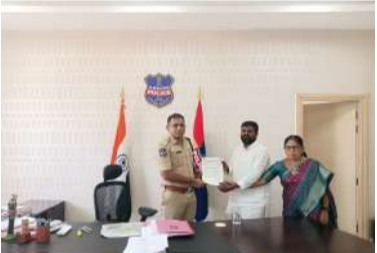
ఏర్పాటు చేయాలని జిల్లా ఎస్పీ గారిని కోరుతూ వినతి పత్రం సమర్పించినట్లు జాతీయ బీసీ సంక్షేమ సంఘం జిల్లా వాహన రాకపోకల పెరుగుతున్న నేపథ్యంలో, ప్రజల సురక్షిత ప్రయాణం కోసం ప్రత్యేక ట్రాఫిక్ పోలీస్ స్టేషన్

మేకార్చి దినపత్రిక, మార్చి 04 చందుల్లి మండల లిపోర్టర్ రాజన్న సిరిసిల్లా జిల్లా కేంద్రం అయిన సిరిసిల్లా మరియు పుణ్యక్షేత్రం అయిన వేములవాడ పట్టణాలలో రోజురోజుకూ వాహన రాకపోకల పెరుగుతున్న నేపథ్యంలో, ప్రజల సురక్షిత ప్రయాణం కోసం ప్రత్యేక ట్రాఫిక్ పోలీస్ స్టేషన్