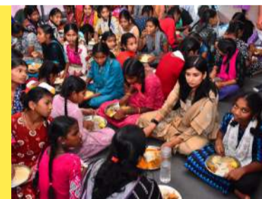
వార్షిక పరీక్షలకు ఎలా సిద్ధం అవుతున్నారని ప్రశ్నించారు? ఏమైనా ఇబ్బందులు ఉన్నాయో అని ఆరా తీశారు. అనంతరం విద్యాలయం పై అంతస్తులో నిర్మిస్తున్న గదులు,

ఇతర ఆహార పదార్థాలను పరిశీలించారు. మధ్యాహ్న భోజన సమయం కావడంతో మెనూ పరిశీలించి.. కలెక్టర్ ప్లేట్ తీసుకొని భోజనం తీసుకుని విద్యార్థులతో కలిసి కింద కూర్చొని తిన్నారు. ఈ సందర్భంగా విద్యార్థులతో మాట్లాడారు. మెనూ ప్రకారం భోజనం పెడుతున్నారా? అని ఆరా తీశారు. ఈ రోజు తింటున్న ఆహారంలో విటమిన్లు, ప్రోటీన్లు, కార్బోహైడ్రేట్స్ ఏమి ఉన్నాయో ప్రశ్నించారు? రోజూ ఎంత పరిమాణంలో తీసుకోవాలి.. విద్యార్థులు