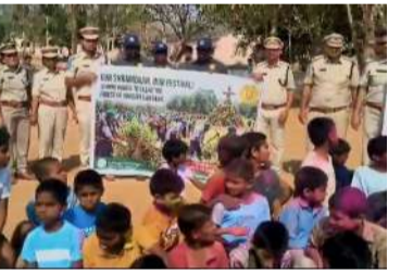
ఉద్యమకారులం హైకోర్టు లో ఫిలైవరి 09 న పిటిషన్ దఖలు చేయడం జరిగింది. ఫిలైవరి 23న కోర్ట్ నెంబర్