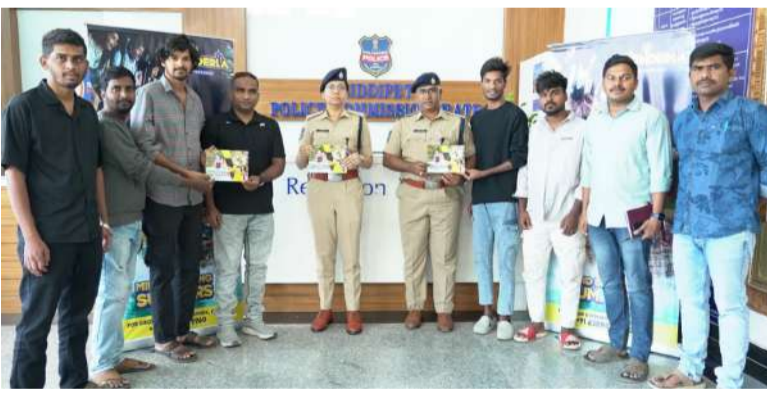
ఉచిత ప్రవేశ కూపన్లను స్వాగ్గర్ చేసింది. సీపీ సమక్షంలో ఈ కూపన్లను విజేతలకు పంపిణీ చేయడం జరిగింది. షార్ట్ వీడియో కాంటెస్ట్ 2.0 ను ప్రారంభించడం విజేతలకు పంపిణీ చేయడం జరిగింది. షార్ట్ వీడియో కాంటెస్ట్ 2.0 ప్రారంభం మొదటి విడతకు వచ్చిన అనూహ్య స్పందనతో, ఇప్పుడు సిద్దిపేట పోలీస్ కమిషనరేట్ షార్ట్ వీడియో కాంటెస్ట్ 2.0 ను ప్రారంభించడం విజేతలకు పంపిణీ చేయడం జరిగింది. సమాజంలో చైతన్యం నింపేందుకు యువత, కంటెంట్ క్రియేటర్లు మరియు ఇన్ఫ్లయెన్సర్లు ఈ పోటీలో పాల్గొనాలని సీపీ