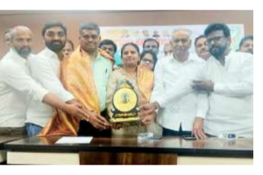
ఉద్యమకారులం హైకోర్టు లో ఫిలైవరి 09 న పిటిషన్ దఖలు చేయడం జరిగింది. ఫిలైవరి 23న కోర్ట్ నెంబర్