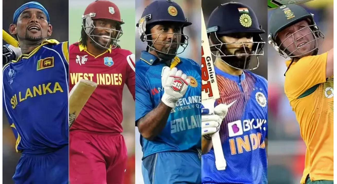
ఆటగాళ్లు ఉండటం దేశ అభిమానులకు గర్వకారణంగా మారింది. రాబోయే ప్రపంచకప్ లో ఈ రికార్డులు మరింత మారుతాయా అనే ఆసక్తి అందరిలోనూ నెలకొంది.

అతడు టీ20 ప్రపంచకప్ లో 1016 పరుగులు సాధించాడు. క్లాసిక్ బ్యాటింగ్ తో టీ20లో కూడా విజయం సాధించవచ్చని నిరూపించిన ఆటగాడు జయవర్ధనే. నాలుగో స్థానాన్ని ఇంగ్లాండ్ స్టార్ బ్యాటర్ జోస్ బట్లర్ దక్కించుకున్నాడు. 1013 పరుగులతో టాప్ 5లో నిలిచిన అతడు, ఈ జాబితాలో ఉన్న యాక్టివ్ ఆటగాడిగా కొనసాగుతున్నాడు. దూకుడైన ఆటతో ప్రత్యర్థులకు ఎప్పుడూ ముప్పుగా మారే ఆటగాడు బట్లర్. ఐదో స్థానంలో ఆస్ట్రేలియా విద్యుంసకర ఓపెనర్ డేవిడ్ వార్నర్ ఉన్నాడు. అతడు 984 పరుగులు చేశాడు. ఆస్ట్రేలియా తొలి టీ20 ప్రపంచకప్ విజయంలో వార్నర్ కీలక పాత్ర పోషించాడు. మొత్తంగా టీ20 ప్రపంచకప్ చరిత్రలో టాప్ 5 పరుగుల వీరుల జాబితాలో భారత్ కు చెందిన ఇద్దరు