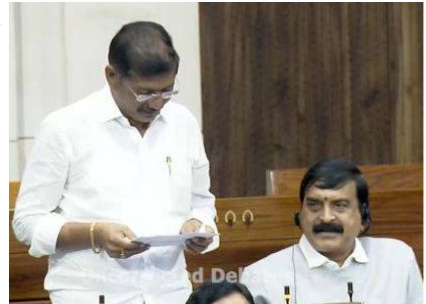
అనేక మంది క్రీడాకారులు జాతీయ అంతర్ జాతీయా క్రీడాకారులు గా కర్నూలు సాయి హాస్టల్ నుండి ప్రాతినిధ్యం వహించారని సాయి హాస్టల్ కు కావలసిన మౌలిక సదుపాయాలు కల్పించాలని వినతి పత్రం అందజేశారు.

మన గళం, కర్నూలు క్రీడలు : క్రీడా రంగంలో నెలకొన్న అనేక సమస్యలను కర్నూలు ఎంపీ బస్తిపాటి నాగరాజు పార్లమెంట్ లో లేవనెత్తారు, పార్లమెంట్ బడ్జెట్ సమావేశాలలో భాగంగా ప్రశ్నోత్తరాల సమయం ( కోస్టిన్ హావర్ ) లో మాట్లాడిన ఆయన సమస్యలపై ప్రశ్నించారు... కర్నూలులోని స్పోర్ట్స్ అథారిటీ ఆఫ్ ఇండియా (సాయి ) కేంద్రంలో ప్రాథమిక మౌలిక సదుపాయాలు ఉన్నప్పటికీ, యువ ప్రతిభను అభివృద్ధి చేయడానికి అవసరమైన సౌకర్యా లు మరియు ఆధునిక శిక్షణ సదుపాయాలు లోపిస్తున్నాయన్నారు.. ఈ నేపథ్యం లో కర్నూలు జిల్లాలోని ఆదోని పట్టణం లో ఆరు లైన్లతో కూడిన 400 మీటర్ల సింథటిక్ అథ్లెటిక్ ట్రాక్ ఏర్పాటు చేయాలనే ప్రతిపాదనను 2021--22 సం వత్సరం లో మంత్రిత్వ శాఖకు ఇప్పటికే సమర్పించారని తెలిపారు, ఈ సందర్భం గా, ప్రస్తుత బడ్జెట్ లో క్రీ డల మం త్రి త్వ శాఖకు కేటాయిం పులు పెరిగిన దృష్ట్యా , కర్నూలులో క్రీ డా పర్యావరణ వ్యవస్థ అభివృద్ధి కోసం ఈ ప్రాజెక్టుకు ఆమోదం ఇవ్వబడుతుందా అని కేంద్ర క్రీడల శాఖ మంత్రి మన్మోహన్ మండ్రియాను ప్రశ్నించగా, దీనికి సమాధానంగా మంత్రి సింథటిక్ అథ్లెటిక్ ట్రాక్ ఏర్పాటును పరిశీలిస్తామని తెలిపారు. ఈ సందర్భంగా యం పి నాగరాజు పార్లమెంట్ భవనం వెలుపట కేంద్ర క్రీడా మంత్రిని కలిసి కర్నూలు సాయి సెంటర్ ను కర్నూల్ నుండి తరలించకూడదమనీ పత్రం అందజేశారు .