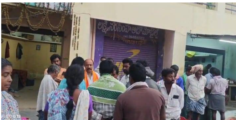
హిందూ సమ్మేళనం బహిరంగ సభకు అందరూ హాజరుకావాలని ఈ సందర్భంగా పిలుపునిచ్చారు అలాగే దేవాలయ కమిటీ మరియు కుల సంఘ పెద్దలందరిని మరియు స్థానిక ప్రభుత్వ అధికారులను అలాగే గ్రామ పంచాయతీ సిబ్బందిని ఈ సందర్భంగా ఆహ్వానించారు హిందూ సమ్మేళన కార్యక్రమానికి భారీ ఎత్తున హిందూ బంధువులందరూ పాల్గొని ఈ కార్యక్రమాన్ని విజయవంతం చేయవలసిందిగా వారు కోరుకున్నారు ఈ కార్యక్రమంలో హిందూ సమ్మేళన నిర్వహణ సమితిసభ్యులు మరియు శ్రీ లక్ష్మీ వెంకటేశ్వర స్వామి దేవస్థానం సభ్యులు స్థానికులు తదితరులు పాల్గొన్నారు

మన గళం కోడుమూరు: కర్నూలు జిల్లా కోడుమూరు పట్టణం నందు జరగబోవు మహా పాదయాత్ర మరియు హిందువుల ఆత్మీయ సమ్మేళన సభ ను విజయవంతం చేయటం కొరకు శనివారం ఉదయం ఎద్దుల మహేశ్వరీ రెడ్డి పుర ప్రజలకు కరపత్రాలను అందజేసి హృదయపూర్వక ఆత్మీయ స్వాగతం పలికారు ఈ సందర్భంగా వారు మాట్లాడుతూ ఈరోజు జరిగే హిందూ సమ్మేళన కార్యక్రమం హిందూ సమ్మేళన నిర్వహణ సమితి మరియు హరిహర క్షేత్ర శ్రీ లక్ష్మీ వెంకటేశ్వర స్వామి వారి దేవస్థానం అధ్యక్షులలో జరుగుతుందన్నారు ఈ కార్యక్రమము ఉదయం శ్రీ రాముల వారి దేవాలయం నుండి మహా పాదయాత్ర ప్రారంభమవుతుంది ఈ మహా పాదయాత్రలో పూరప్రజలు విరివిగా పాల్గొని పాదయాత్ర ద్వారా కోడుమూరులో గల హరిహర క్షేత్ర శ్రీ లక్ష్మీ వెంకటేశ్వర స్వామి దేవస్థానంలో జరిగే