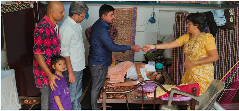
ఉంటారని ఈ సందర్భంగా తెలిపారు.