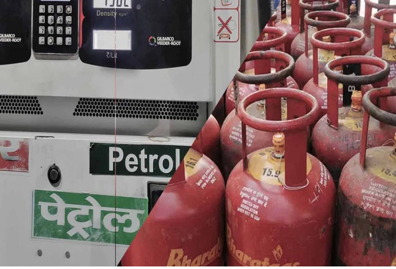
భారత్కు హామీ ఇచ్చినట్లు సమాచారం. దేశంలో ప్రస్తుతం తగినంత ఎల్ఎన్జీ నిల్వలు కూడా ఉన్నాయని అధికారులు తెలిపారు. ఇదిలా ఉండగా హార్బుజ్ జలసంధి ద్వారా ఓడల రాకపోకలు మళ్లీ ప్రారంభమయ్యాయి. ఇరాన్ అధ్యక్షుడు మహమూద్ పెజిష్కీయన్ పొరుగు దేశాలపై దాడులు చేయబోమని ప్రకటించిన తర్వాత పరిస్థితులు కొంత స్థిరపడినట్లు తెలుస్తోంది. దీంతో ఇంధన సరఫరా వ్యవస్థ సాధారణ స్థితికి చేరుకునే అవకాశం ఉందని అధికారులు పేర్కొన్నారు.

న్యూఢిల్లీ, మార్చి 7, మనగళం : మధ్యప్రాచ్యంలో నెలకొన్న ఉద్రిక్త పరిస్థితుల నేపథ్యంలో దేశంలో పెట్రోల్, డీజిల్ ధరలు పెరుగుతాయా అనే సందేహం ప్రజల్లో నెలకొంది. అయితే ప్రస్తుత పరిస్థితుల్లో ఇంధన ధరలను పెంచే ఆలోచన లేదని కేంద్ర ప్రభుత్వ వర్గాలు స్పష్టం చేశాయి. దేశంలో చమురు నిల్వలు సరిపడా ఉన్నాయని, సరఫరాలో ఎలాంటి అంతరాయం కలగకుండా చర్యలు తీసుకుంటున్నామని తెలిపాయి. ఇజ్రాయేల్, అమెరికా దాడుల నేపథ్యంలో ప్రపంచ చమురు రవాణాకు కీలకమైన హార్బుజ్ జలసంధి వద్ద ఉద్రిక్త వాతావరణం ఏర్పడింది. భారత్ తన ముడి చమురు దిగుమతుల్లో పెద్ద భాగాన్ని ఈ మార్గం ద్వారానే తెచ్చుకుంటుంది. దీంతో అక్కడ పరిస్థితులు విషమిస్తే ఇంధన ధరలు పెరిగే అవకాశం ఉందని ఆందోళనలు వ్యక్తమయ్యాయి. అయితే ఈ పరిస్థితిని ముందుగానే గుర్తించిన కేంద్ర ప్రభుత్వం ప్రత్యామ్నాయ దేశాల నుంచి చమురు దిగుమతులను పెంచినట్లు తెలిపింది. గతంలో హార్బుజ్ జలసంధి మార్గంపై ఎక్కువగా ఆధారపడిన భారత్ ఇప్పుడు ఇతర సురక్షిత మార్గాల నుంచి కూడా చమురు దిగుమతులను పెంచుతోంది. ఈ వ్యూహాత్మక నిర్ణయం వల్ల దేశంలో ముడి చమురు, శుద్ధి చేసిన పెట్రోలియం ఉత్పత్తుల సరిపడా నిల్వలు ఉన్నాయని అధికార వర్గాలు పేర్కొన్నాయి. దీంతో ప్రస్తుత పరిస్థితుల్లో పెట్రోల్, డీజిల్ ధరల పెంపు అవసరం ఉండదని స్పష్టం చేశారు. ఇక వంటగ్యాస్ మరియు ఎల్ఎన్జీ సరఫరాపై కూడా ప్రభుత్వం నిఘా పెట్టింది. ఖతార్లోని రాస్ లఫాన్ ఉత్పత్తి కేంద్రం తాత్కాలికంగా మూసివేయబడినప్పటికీ సరఫరా మార్గాలు తిరిగి ప్రారంభమైన వెంటనే గ్యాస్ పంపిణీ కొనసాగుతుందని ఖతార్