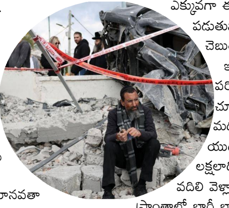
తెలిపింది. యుద్ధాలు మొదలైన వెంటనే ప్రజలు భయంతో తమ గ్రామాలు, పట్టణాలను వదిలి శరణార్థి శిబిరాలకు తరలిపోతున్నారు. యుద్ధాల ఆరోగ్యం, ఆర్థిక వ్యవస్థ, విద్య వంటి రంగాలపై కూడా తీవ్ర ప్రభావం చూపుతున్నాయి. యుద్ధ ప్రాంతాల్లో ఆసుపత్రులు ధ్వంసం కావడం వల్ల వైద్య సేవలు అందుబాటులో ఉండవు. పిల్లల విద్య మధ్యలోనే ఆగిపోతుంది. ఉద్యోగాలు లేక ప్రజలు పేదరికంలోకి జారిపోతారు. యుద్ధాలు సమాజ ఆర్థిక నిర్మాణాన్ని పూర్తిగా దెబ్బతీస్తాయని పరిశోధనలు సూచిస్తున్నాయి. ప్రపంచవ్యాప్తంగా జరుగుతున్న ఈ పరిస్థితులను దృష్టిలో ఉంచుకుని శాంతి చర్యలు, రాజనీతిక ప్రయత్నాలు మరింత అవసరమని నిపుణులు సూచిస్తున్నారు. దేశాల మధ్య వివాదాలను యుద్ధాల ద్వారా కాకుండా చర్యల ద్వారా పరిష్కరించడం అవసరం. ఎందుకంటే యుద్ధాల అసలు బాధితులు సాధారణ ప్రజలేనని, వారి జీవనాలు శాశ్వతంగా మారిపోతాయని అంతర్జాతీయ సంస్థలు హెచ్చరిస్తున్నాయి.