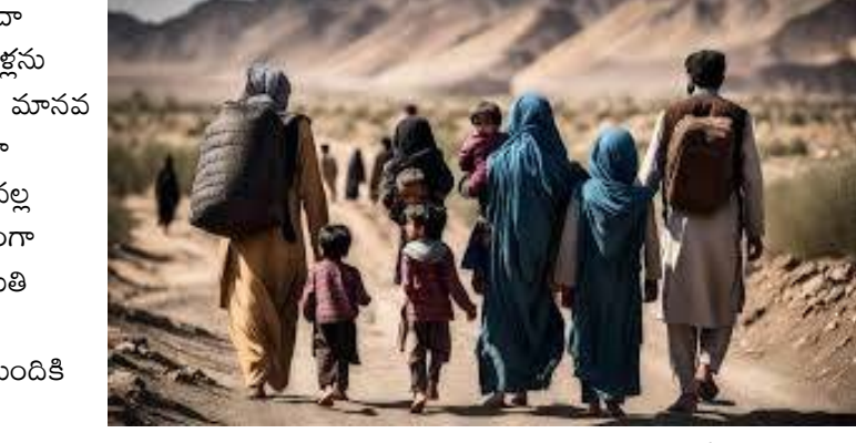
మంది యుద్ధాలు, హింస లేదా ఘర్షణల కారణంగా తమ ఇళ్లను వదిలి వెళ్లాలి వచ్చింది. ఇది మానవ చరిత్రలోనే అత్యధిక సంఖ్యగా పేర్కొంటున్నారు. యుద్ధాల వల్ల ప్రాణనష్టం కూడా గణనీయంగా పెరుగుతోంది. ఐక్యరాజ్యసమితి వివరాల ప్రకారం 2024లో మాత్రమే కనీసం 48 వేల మందికి పైగా ఘర్షణల్లో ప్రాణాలు కోల్పోయారు. వీరిలో చాలా మంది సాధారణ పౌరులేనని నివేదికలు చెబుతున్నాయి. మహిళలు, పిల్లలు, వృద్ధులు వంటి బలహీన వర్గాలే ఎక్కువగా ఈ యుద్ధాల బారిన పడుతున్నారని నిపుణులు చెబుతున్నారు. ఇటీవలి ఘర్షణలు కూడా ఇదే పరిస్థితిని సృష్టించా చూపిస్తున్నాయి. ఉదాహరణకు మధ్యప్రాచ్యంలో కొనసాగుతున్న యుద్ధ పరిస్థితుల కారణంగా లక్షలాది మంది తమ నివాసాలను వదిలి వెళ్లాలి వస్తోంది. కొన్ని ప్రాంతాల్లో భారీ బాంబు దాడుల వల్ల నగరాలు శిథిలాలుగా మారి ప్రజలు ఆశ్రయం కోసం ఇతర ప్రాంతాలకు వెళ్లాలి వస్తోంది ఇదే సమయంలో ఆసియా, ఆఫ్రికా ప్రాంతాల్లో కూడా యుద్ధాల ప్రజల జీవితాలను దెబ్బతీస్తున్నాయి. ఇటీవల సరిహద్దు ఘర్షణల కారణంగా వేలాది మంది తమ ఇళ్లను వదిలి వెళ్లాలి వచ్చిందని ఐక్యరాజ్యసమితి

మన గళం డెస్క్ : ప్రపంచవ్యాప్తంగా జరుగుతున్న యుద్ధాలు మరియు ఘర్షణలు సామాన్య ప్రజల జీవితాలను తీవ్రంగా ప్రభావితం చేస్తున్నాయి. రాజకీయాల, సరిహద్దు వివాదాలు, శక్తి పోటీలు వంటి కారణాలతో దేశాల మధ్య జరిగే యుద్ధాల ప్రభావం చివరికి సాధారణ ప్రజలపైనే పడుతోంది. ప్రస్తుతం ప్రపంచంలో అనేక ప్రాంతాల్లో యుద్ధాలు కొనసాగుతున్నాయి. అంతర్జాతీయ నివేదికల ప్రకారం 2024లో మాత్రమే ప్రపంచవ్యాప్తంగా జరిగిన ఘర్షణల్లో లక్షలాది మంది ప్రాణాలు కోల్పోయారని తెలుస్తోంది. ప్రపంచంలో శాంతి పరిస్థితి గత దశాబ్దంతో పోలిస్తే క్షీణించిందని అంతర్జాతీయ పరిశోధనలు పేర్కొంటున్నాయి. యుద్ధాల వల్ల మొదటిగా ప్రభావితమయ్యేది సామాన్య ప్రజల జీవన విధానం. యుద్ధాలు ప్రారంభమైన వెంటనే నగరాలు, గ్రామాలు యుద్ధభూములుగా మారిపోతాయి. ఇళ్లు, ఆసుపత్రులు, పాఠశాలలు, నీటి సరఫరా వ్యవస్థలు వంటి మౌలిక సదుపాయాలు ధ్వంసమవుతాయి. దీంతో ప్రజల జీవనాధారం పూర్తిగా కాలిపోతుంది. అంతర్జాతీయ మానవతా సంస్థల నివేదికల ప్రకారం యుద్ధాలు కుటుంబాలను విడదీసి కోట్లాది మందిని నిరాశ్రయులుగా మార్చుతున్నాయి. ప్రస్తుతం ప్రపంచంలో యుద్ధాలు మరియు హింస కారణంగా నిరాశ్రయుల సంఖ్య భారీగా పెరిగింది. ఐక్యరాజ్యసమితి గణాంకాల ప్రకారం 2025 మధ్య నాటికి ప్రపంచవ్యాప్తంగా సుమారు 117 మిలియన్ల