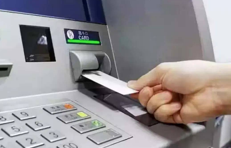
చిరునామాకు పంపిస్తారు. రెండవది కార్డును తిరిగి పొందడం. మీ బ్యాంక్ కు చెందిన ఏటీఎం వద్ద కార్డు ఇరుక్కుపోతే దాన్ని తిరిగి పొందడం కొంచెం సులభంగా ఉంటుంది. అయితే వేరే బ్యాంక్ ఏటీఎం వద్ద కార్డు ఇరుక్కుపోయి ఉంటే కొంత సమయం పట్టవచ్చు. యంత్రాన్ని నిర్వహించే సిబ్బంది కార్డును తీసి సంబంధిత బ్యాంకుకు పంపిస్తారు. అనంతరం బ్యాంక్ నుంచి కస్టమర్ కు సమాచారం అందుతుంది. సాధారణంగా కార్డును తిరిగి పొందేందుకు కస్టమర్ తమ బ్యాంక్ శాఖకు వెళ్లి గుర్తింపు పత్రాన్ని చూపించాల్సి ఉంటుంది.

న్యూఢిల్లీ, మార్చి 7, , మనగళం : డబ్బు తీసుకునేందుకు ఏటీఎం వద్దకు వెళ్లినప్పుడు కొన్నిసార్లు డెబిట్ కార్డు యంత్రంలోనే ఇరుక్కుపోయే పరిస్థితి ఎదురవుతుంది. అటువంటి సమయంలో చాలా మంది భయాందోళనలకు గురవుతారు. అయితే ఇది సాధారణంగా సాంకేతిక సమస్యల వల్ల జరిగే విషయం అని నిపుణులు చెబుతున్నారు. సరైన చర్యలు తీసుకుంటే ఖాతా భద్రతను కాపాడుకోవడంతో పాటు కార్డును తిరిగి పొందడం కూడా సాధ్యమే. ఏటీఎం మెషిన్లో కార్డు ఇరుక్కుపోవడానికి నెట్వర్క్ లోపాలు, విద్యుత్ అంతరాయం, తప్పు పిన్ నం పడేపడే సమయం చేయడం లేదా లావాదేవీ సమయంలో ఎక్కువ సమయం తీసుకోవడం వంటి కారణాలు ఉండవచ్చు. ఇలాంటి పరిస్థితుల్లో భద్రతా చర్యగా ఏటీఎం యంత్రం కార్డును తన వద్దే ఉంచుకుంటుంది. అలాంటి సమయంలో ముందుగా చేయాల్సింది మీ బ్యాంక్ కస్టమర్ కేర్ కు వెంటనే సమాచారం ఇవ్వడం. ఏటీఎం మెషిన్ నంబర్, ఉన్న ప్రదేశం, సంఘటన జరిగిన సమయం వంటి వివరాలను బ్యాంకుకు తెలియజేయాలి. అవసరమైతే మీ కార్డును వెంటనే బ్లాక్ లేదా హాట్లైన్స్ చేయాలని కూడా కోరవచ్చు. ఇలా చేస్తే ఎవరూ ఆ కార్డును ఉపయోగించి లావాదేవీలు చేయలేరు. కస్టమర్ సర్వీస్ ను సంప్రదించిన తర్వాత సాధారణంగా రెండు మార్గాలను సూచిస్తారు. మొదటిది కార్డును పూర్తిగా రద్దు చేసి కొత్త కార్డు కోసం దరఖాస్తు చేయడం. సాధారణంగా కొత్త కార్డు 7 నుంచి 10 రోజులలో మీ