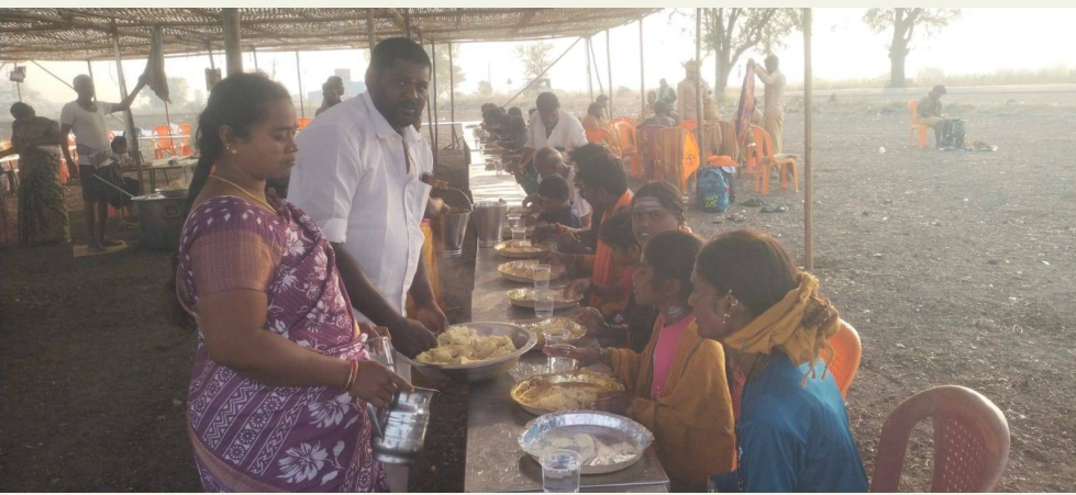
(మన గళం, కర్నూలు రూరల్) : శివస్వాములకు అన్న సంతర్పణ జరిగింది. మరో 6