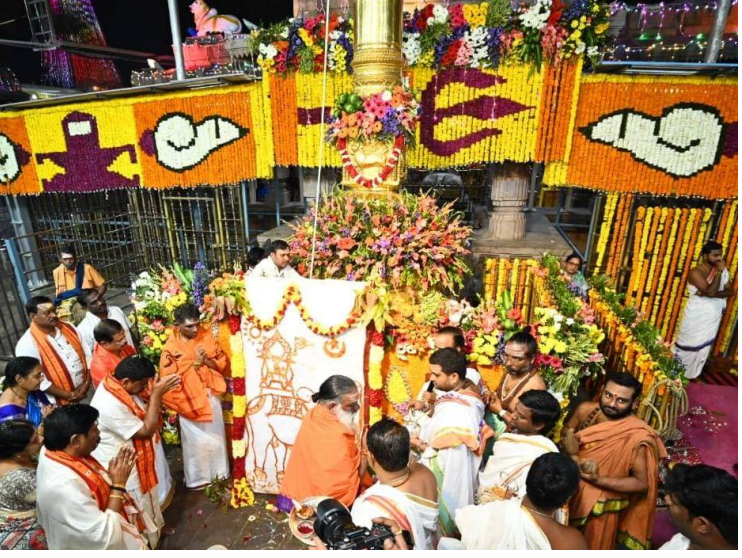
తరువాత కంకణధారణ జరిపించబడింది.

చండీశ్వరపూజ : సంకల్పపఠనం తరువాత చండీశ్వరపూజ జరిపించబడింది. ఈ బ్రహ్మోత్సవాలు సృష్టికర్త అయిన బ్రహ్మదేవుని ఆధ్వర్యంలో, క్షేత్రపాలకుడైన వీరభద్రస్వామి పర్యవేక్షణలో, శివపరివార దేవతలలో ఒకరైన చండీశ్వరుని నాయకత్వంలో నిర్వహించబడుతాయని చెప్పబడుతోంది. అందుకే యాగశాల ప్రవేశం తరువాత చండీశ్వరుని ప్రత్యేకంగా పూజాదికాలు జరిపించడం సంప్రదాయం. కంకణ పూజ, కంకణధారణ చండీశ్వరపూజ తరువాత కంకణాలకు (రక్షాబంధనాలకు) శాస్త్రోక్తంగా పూజాదికాలు జరిపించబడ్డాయి.