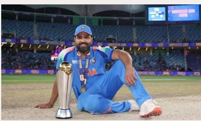
వర్గంలో శుభేంద్ర గిల్, జస్ప్రిత్ బుద్దూ, రవీంద్ర జడేజా చోటు దక్కించుకోగా, విరాట్ కోహ్లి కూడా బి వర్గంలో కొనసాగుతున్నాడు.

ముంబై ఫిబ్రవరి 12 : మన గళం : భారత జట్టు అనుభవజ్ఞుడు రోహిత్ శర్మ టెస్టు, టీ20 రూపాలకు వీడ్కోలు పలికి ప్రస్తుతం ఒకరోజు అంతర్జాతీయ మ్యాచ్ లపైనే దృష్టి సారించిన విషయం తెలిసిందే. 2027లో జరగనున్న ప్రపంచ కప్ ను గెలవాలనే లక్ష్యంతోనే ముందుకు సాగుతున్నారని రోహిత్ శర్మ స్పష్టం చేశాడు. ప్రపంచ కప్ పై తనకు చిన్నప్పటి నుంచే ప్రత్యేకమైన అభిమానం ఉందని రోహిత్ తెలిపారు. “నా దేశం కోసం ప్రపంచ కప్ గెలవాలని కోరుకుంటున్నాను. చిన్నప్పటి నుంచి ప్రపంచ కప్ మ్యాచ్ లు చూస్తూ పెరిగాను. నాలుగేళ్లకు ఒకసారి జరిగే ఈ టోర్నీకి ఎంతో ప్రాధాన్యం ఉంది. ప్రస్తుతం ఆ ట్రోఫీ గెలవడమే నా లక్ష్యం. దాని కోసం పూర్తి స్థాయిలో శ్రమిస్తాను” అని ఒక అంతర్జాతీయ క్రికెట్ మండలి కార్యక్రమంలో పేర్కొన్నారు. ఇదిలా ఉండగా ఇటీవల భారత క్రికెట్ నియంత్రణ మండలి ఆటగాళ్ల వార్షిక ఒప్పందాల జాబితాను ప్రకటించింది. ఇందులో రోహిత్ శర్మ అత్యున్నత వర్గం నుంచి బి వర్గానికి మారాడు. అత్యున్నత వర్గాన్ని తొలగించిన మండలి ప్రస్తుతం ఏ, బి, సి వర్గాలూ మాత్రమే విభజించింది. ఏ