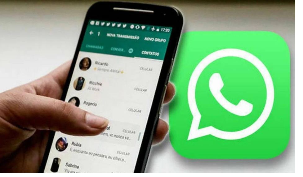
పేర్కొంది. అంతేకాకుండా ఆపిల్ ఫేస్ టైమ్, స్వాప్ చాట్లపై కూడా ఆంక్షలు విధించింది. మెటా సంస్థ రష్యా చట్టాలను పూర్తిగా పాటిస్తే, నిషేధాన్ని పునఃపరిశీలించే అవకాశం ఉందని క్రిష్నిన్ ప్రతినిధులు తెలిపారు. చట్టాలకు అనుగుణంగా వ్యవహరిస్తూ రష్యా అధికారులతో సంభాషణ ప్రారంభిస్తే రాజీ సాధ్యమవుతుందని సూచించారు. అయితే నిబంధనలు పాటించని పక్షంలో వాట్సాప్ పై నిషేధం కొనసాగుతుందని స్పష్టం చేశారు.

మాస్కో ఫిబ్రవరి 12:మనగళం: రష్యా అమెరికా కంపెనీల మధ్య ఉద్రిక్తతలు మరింత ముదురుతున్నాయి. ఈ నేపథ్యంలో ప్రముఖ సందేశ యాప్ వాట్సాప్ పై రష్యా ప్రభుత్వం కఠిన నిర్ణయం తీసుకుంది. ప్రభుత్వ నిబంధనలు పాటించని పక్షంలో పూర్తి స్థాయి నిషేధం విధిస్తామని స్పష్టం చేసింది. ఇప్పటికే కొన్ని సేవలను నిలిపివేసిన రష్యా, తాజాగా వాట్సాప్ సేవలను పూర్తిగా అడ్డుకట్ట వేసినట్లు సమాచారం. రష్యా కమ్యూనికేషన్ నియంత్రణ సంస్థ రోస్నోమ్మాడ్కోర్ ఆన్ లైన్ డైరెక్టరీ నుంచి వాట్సాప్ ను తొలగించినట్లు వార్తలు వచ్చాయి. దేశంలో సుమారు పది లక్షల మందికి పైగా వినియోగదారులు ఈ యాప్ ను ఉపయోగిస్తున్నట్లు అంచనా. కంపెనీ ప్రతినిధులు స్పందిస్తూ, వినియోగదారులను కలుపుకునే సేవలను కొనసాగించేందుకు అన్ని ప్రయత్నాలు చేస్తున్నామని తెలిపారు. ఉక్రెయిన్ తో యుద్ధం ప్రారంభమైన తర్వాత అమెరికా కంపెనీలపై రష్యా వరుస ఆంక్షలు విధిస్తోంది. ప్రభుత్వ ఆధ్వర్యంలో నిర్వహిస్తున్న 'మ్యాక్స్' అనే స్వదేశీ యాప్ ను ప్రజలు ఎక్కువగా వినియోగించాలని రష్యా ప్రోత్సహిస్తోంది. అయితే పౌరులపై నిఘా పెట్టేందుకు ఈ యాప్ ను ఉపయోగిస్తున్నారనే విమర్శలు వినిపిస్తున్నాయి. గత ఏడాది వాట్సాప్, టెలిగ్రామ్ కాలింగ్ సేవలను కూడా రష్యా నిషేధించింది. మోసం, ఉగ్రవాదానికి సంబంధించిన సమాచారాన్ని చట్ట అమలు సంస్థలతో పంచుకోవడం లేదనే కారణంతో ఈ చర్యలు తీసుకున్నట్లు