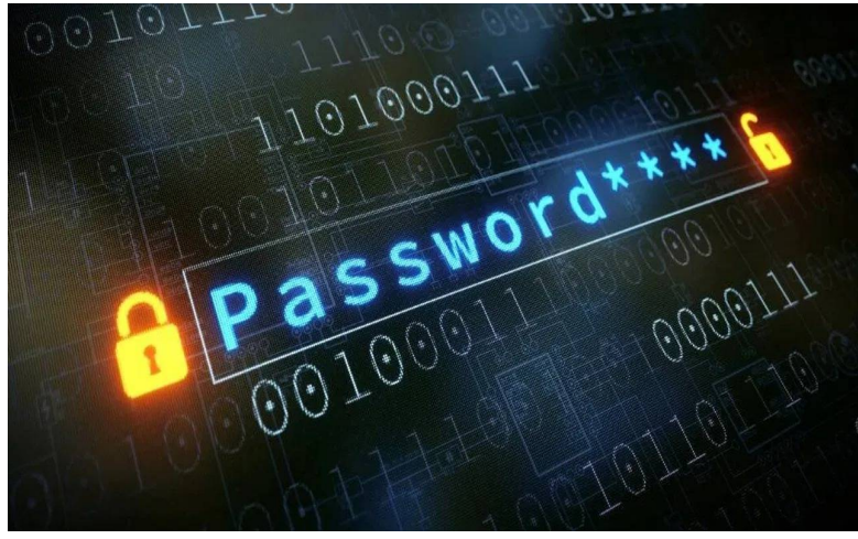
అక్షరాలు, చిన్న అక్షరాలు, సంఖ్యలు, ప్రత్యేక చిహ్నాల మిశ్రమాన్ని ఉపయోగించడం మంచిదని నిపుణులు సూచిస్తున్నారు. సైబర్ భద్రత కోసం ప్రతి ఖాతాకు వేర్వేరు పాస్ వర్డ్ లు ఉపయోగించడం, తరచుగా మార్చడం, అనుమానాస్పద లింకులను తెరవకుండా జాగ్రత్తపడడం అత్యంత అవసరం.

హైదరాబాద్ ఫిబ్రవరి 12 :మనగళం: ఇప్పటి డిజిటల్ యుగంలో సామాజిక మార్గమాలలు, బ్యాంకింగ్, ఈమెయిల్ వంటి అనేక ఖాతాలను వినియోగించడం సాధారణమైంది. అయితే వీటన్నింటికీ ఒకే పాస్ వర్డ్ ను ఉపయోగించడం పెద్ద ప్రమాదానికి దారితీస్తుందని నిపుణులు హెచ్చరిస్తున్నారు. గుర్తుంచుకోవడం సులభంగా ఉండటానికి ఒకే పాస్ వర్డ్ ను ఉపయోగించడం సౌకర్యంగా అనిపించినా, అది సైబర్ నేరాలకు అవకాశం కల్పిస్తుంది. చోం వ్యవహారాల మంత్రిత్వ శాఖ ఆధ్వర్యంలోని సైబర్ దోస్త సంస్థ ఇటీవల చేసిన హెచ్చరికలో, వేర్వేరు ఖాతాలకు ఒకే పాస్ వర్డ్ ఉపయోగిస్తే డేటా ఉల్లంఘన జరిగినప్పుడు అన్ని ఖాతాలు ఒకేసారి ప్రమాదంలో పడే అవకాశముందని పేర్కొంది. ఒక ఖాతా వివరాలు లీక్ అయితే, అదే పాస్ వర్డ్ తో ఉన్న ఇతర ఖాతాలను హ్యాకర్లు సులభంగా లక్ష్యంగా చేసుకునే ప్రమాదం ఉంది. డేటా లీక్ జరిగితే హ్యాకర్లు వ్యక్తిగత వివరాలు, బ్యాంకు సమాచారం వంటి సున్నితమైన సమాచారాన్ని కూడా పొందే అవకాశం ఉంటుంది. దీంతో ఆర్థిక నష్టం, వ్యక్తిగత సమాచారం దుర్వినియోగం వంటి సమస్యలు తలెత్తే అవకాశం ఉంది. మీ వివరాలు డేటా ఉల్లంఘనలో ఉన్నాయా లేదా అనేది ప్రత్యేక వెబ్ సైట్ ల ద్వారా తనిఖీ చేసుకోవచ్చు. ఒకవేళ వివరాలు లీక్ అయినట్లు తెలిసిన వెంటనే అన్ని ఖాతాల పాస్ వర్డ్ లను మార్చడం అవసరం. బలమైన పాస్ వర్డ్ కోసం పెద్ద