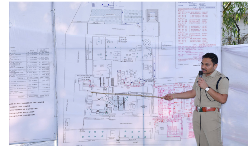
పార్కింగ్ ప్రదేశంలో మాత్రమే నిలుపుకునేలా చర్యలు తీసుకోవాలని జిల్లా ఎస్పీ గారు ఆదేశించడం జరిగింది.