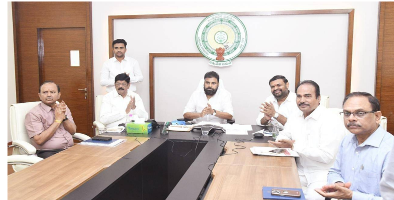
కల్పించేందుకు చర్యలు తీసుకుంటున్నామని, సనాతన ధర్మ పరిరక్షణకు ప్రభుత్వం అంకితభావంతో పనిచేస్తుందని ఆయన స్పష్టం చేశారు.

తదితరులు కార్యక్రమంలో పాల్గొన్నారు. ఈ సందర్భంగా పవన్ కల్యాణ్ మాట్లాడుతూ ఆలయాలు మన నాగరికత, సంస్కృతి, వారసత్వానికి చిహ్నాలని పేర్కొన్నారు. అరుణాచలం తరహాలో శ్రీకాళహస్తిలోనూ గిరిప్రదక్షిణ చేయాలన్న కోరిక తనకుందని, త్వరలో క్షేత్రాన్ని సందర్శించి స్వామి, అమ్మవార్లను దర్శించుకుంటానని తెలిపారు. శివరాత్రి బ్రహ్మాత్మవాల అనంతరం గిరిప్రదక్షిణ మార్గంలో మొక్కులు నాటే కార్యక్రమాన్ని చేపడతామని వెల్లడించారు. ప్రతి పౌర్ణమికి కైలాసగిరి ప్రదక్షిణ నిర్వహించాలని నూతన బ్రహ్మ బోర్డుకు సూచించారు. ప్రధానమంత్రి నరేంద్ర మోదీ మార్గనిర్దేశకత్వంలో, ముఖ్యమంత్రి నారా చంద్రబాబు నాయుడు నాయకత్వంలో ఆలయాల అభివృద్ధికి కూటమి ప్రభుత్వం కట్టుబడి ఉందన్నారు. దేవదారు శాఖ సహకారంతో రూ. 40 కోట్లకు పైగా నిధులతో సుమారు 22 ప్రధాన దేవాలయాలకు రహదారి వసతులు కల్పిస్తున్నామని తెలిపారు. కోటప్పకొండ, వాడపల్లి, ఏలూరు జిల్లా ఐ.ఎస్. జగన్మోహన్ రెడ్డి క్షేత్రాల్లో రోడ్ల నిర్మాణం చేపట్టమని వివరించారు. చిన్న ఆలయాలకు కూడా రహణా సౌకర్యం