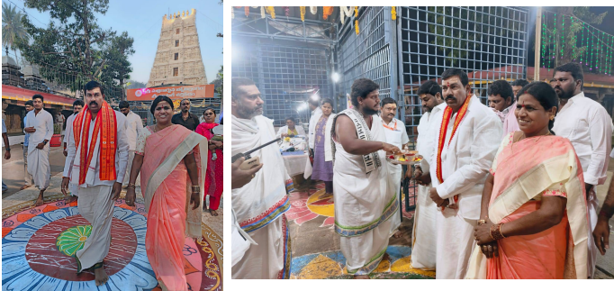
నాయకులు, కార్యకర్తలు, బీవీఠ్ అభిమానులు పాల్గొన్నారు.