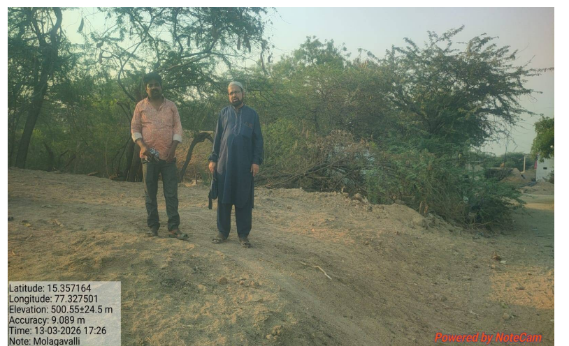
Latitude: 15.357164 Longitude: 77.327501 Elevation: 500.55x24.5 m Accuracy: 9.089 m Time: 15/03/2026 17:26 Note: Molagavalli Powered by MoleCam