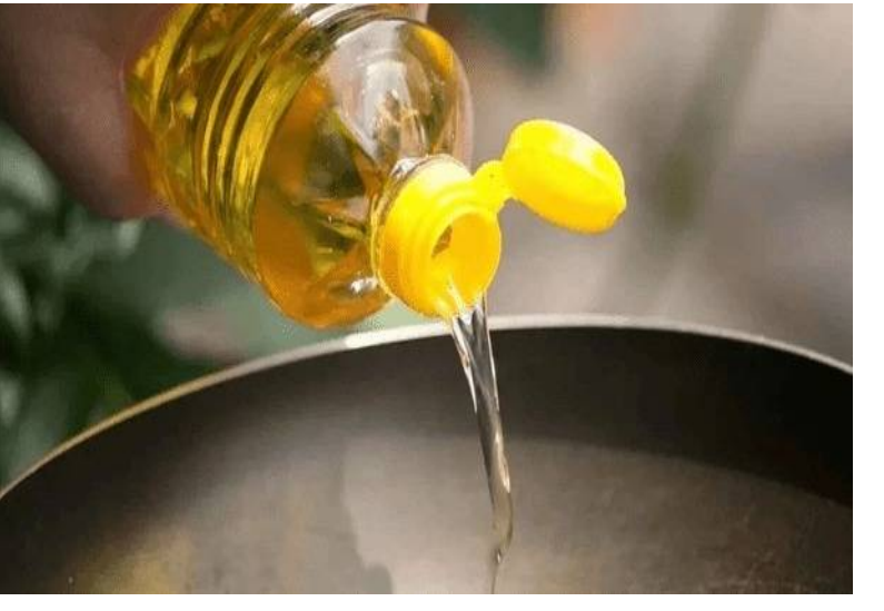
ఇలాగే కొనసాగితే రాబోయే రోజుల్లో వంట నూనెల ధరలు మరింత పెరిగే అవకాశముందని మార్కెట్ వర్గాలు అంచనా వేస్తున్నాయి.

న్యూఢిల్లీ, మార్చి 13, మన గళం, పశ్చిమాసియా ప్రాంతంలో కొనసాగుతున్న యుద్ధ పరిస్థితుల ప్రభావం భారతదేశంలోని వంటింటిపై పడుతోంది. సరఫరా వ్యవస్థపై ప్రభావం పడటంతో దేశంలో వంట గ్యాస్ తో పాటు వంట నూనెల ధరలు కూడా పెరుగుతున్నాయి. అంతర్జాతీయ మార్కెట్ లో ఏర్పడిన అనిశ్చితి కారణంగా నూనెల ధరలు ఇటీవల రోజులుగా క్రమంగా పెరుగుతున్నాయని మార్కెట్ వర్గాలు చెబుతున్నాయి. గత వారంతో పోలిస్తే ప్రస్తుతం మార్కెట్ లో అన్ని రకాల వంట నూనెల ధరలు పెరిగాయి. ముఖ్యంగా సన్ ఫ్లవర్ నూనె లీటరుకు సుమారు నాలుగు రూపాయల వరకు పెరిగింది. అలాగే పామాయిల్, వేరుశనగ నూనెల ధరలు కూడా లీటరుకు ఒక రూపాయి నుంచి రెండు రూపాయల యాభై పైసల వరకు పెరిగినట్లు వ్యాపారులు తెలిపారు. భారతదేశం తన వంట నూనెల అవసరాల్లో దాదాపు తొంభై శాతం వరకు విదేశీ దిగుమతులపై ఆధారపడుతోంది. పశ్చిమాసియా ప్రాంతంలో యుద్ధ ఉద్రిక్తతలు పెరగడం, అంతర్జాతీయ మార్కెట్ లో ముడి చమురు ధరలు పెరగడం, రవాణా వ్యయాలు అధికమవడం వంటి కారణాలు ఈ ధరల పెరుగుదలకు ప్రధాన కారణాలుగా నిపుణులు పేర్కొంటున్నారు. పరిస్థితులు