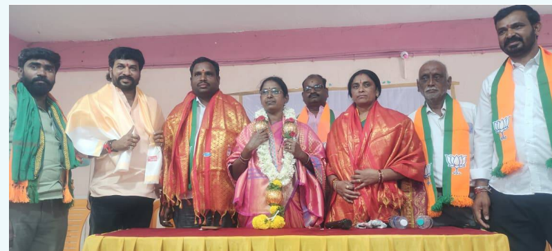
బిజెపి నాయకులు, కార్యకర్తలు పాల్గొన్నారు.