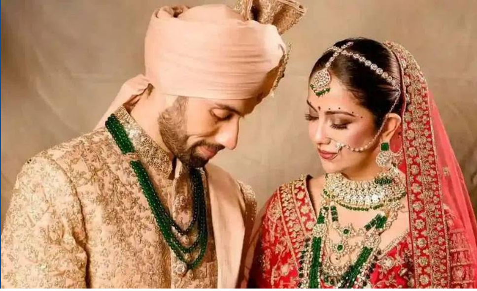
తమ బంధాన్ని మరింత బలపరచిందని ఈ జంట తెలిపింది. చిన్నారి పెళ్లి కూతురు ధారావాహికతో దేశవ్యాప్తంగా గుర్తింపు తెచ్చుకున్న అవికా గోర్, ఆ తరువాత సినిమాలు, కార్యక్రమాల ద్వారా ప్రేక్షకులను అలరిస్తూ వస్తోంది. సామాజిక మాధ్యమాల్లో కూడా ఆమెకు మంచి ఆదరణ ఉంది.

ముంబై ఫిబ్రవరి 14, మన గళం : పెళ్లి తర్వాత తమ తొలి ప్రేమికుల దినోత్సవాన్ని నటి అవికా గోర్, ఆమె భర్త మిలింద్ చంద్వానా ఎంతో సాధారణంగా, అర్థవంతంగా జరుపుకున్నారు. గత సంవత్సరం సెప్టెంబర్ లో వివాహ బంధంతో ఒక్కటైన ఈ జంటకు ఇది తొలి ప్రేమికుల దినోత్సవం కావడంతో అభిమానుల్లో ఆసక్తి నెలకొంది. భారీ వేడుకలు, ఖరీదైన బహుమతుల కంటే కలిసి గడిపే సమయానికే ప్రాధాన్యం ఇస్తామని అవికా వెల్లడించింది. ఇది కేవలం ఒక రోజు కాదని, కలిసి నిర్మించుకుంటున్న తమ చిన్న ప్రపంచాన్ని గౌరవించుకునే సందర్భమని ఆమె భావోద్వేగంగా పేర్కొంది. ప్రేమ అంటే బహుమతులు కాదని, ఒక ప్రాణాన్ని కాపాడటమే నిజమైన ఆనందమని ఈ జంట తెలిపింది. ఇటీవల చిత్రీకరణ సమయంలో వీధి కుక్కల బారి నుంచి ఒక చిన్న పిల్లని రక్షించి 'షిరీ' అని పేరు పెట్టుకుని ఇంట్లోకి తీసుకువచ్చారు. సంప్రదాయ బహుమతులకంటే ఈ నిర్ణయం తమ ఆలోచనలు, విలువలు ఒకటేనని చెప్పే నిదర్శనమని అవికా చెప్పింది. రోమాన్స్ అంటే ఆర్కాటం కాదని, కష్టకాలాల్లో ఒకరికొకరు అండగా నిలబడటం, కలిసి నవ్వుకోవడం, చేతులు పట్టుకుని నడవాలని అనిపించడమే అసలైన ప్రేమ అని ఆమె అభిప్రాయపడింది. పెళ్లి తర్వాత వచ్చిన ప్రశాంతత