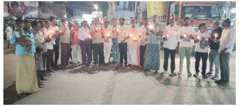
- అంబేద్కర్ సర్కిల్లో మాజీ సైనికులు, రాజకీయ నాయకుల మౌన ప్రదర్శన.