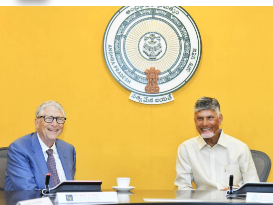
చంద్రబాబు పేర్కొన్నారు. సాంకేతిక ఆధారిత అభివృద్ధి, సామాజిక సంక్షేమ రంగాల్లో భాగస్వామ్యాన్ని మరింత బలోపేతం చేయాలని ఇరువురు అంగీకరించినట్లు సమాచారం.

దురదృష్టవశాత్తూ గేట్స్ తో పంచుకున్నానని తెలిపారు. ఆ రోజు ప్రారంభమైన సాంకేతిక పర్యావరణ వ్యవస్థ నిర్మాణంపై సంభాషణ ఇప్పుడు విస్తృత లక్ష్యంగా రూపాంతరం చెందింది పేర్కొన్నారు. వినూత్న ఆవిష్కరణలను వినియోగించి పాలనలో మార్పులు తీసుకురావడం, ప్రజల జీవితాలను మెరుగుపరచడం తమ లక్ష్యమని ముఖ్యమంత్రి తెలిపారు. అమరావతి సచివాలయంలో జరిగిన తాజా సమావేశంలో 'స్వర్ణాంధ్ర 2047' విజన్ ను గేట్స్ ముందుంచినట్లు చెప్పారు. రాష్ట్ర ప్రజలకు సాధికారత కల్పించి జీవన ప్రమాణాలను పెంచేందుకు గేట్స్ ఫౌండేషన్ తో కలిసి పనిచేసే మార్గాలపై చర్చించినట్లు వెల్లడించారు. ఆనాటి సంభాషణ నేటి విస్తృత లక్ష్యాలకు పునాది వేసిందని