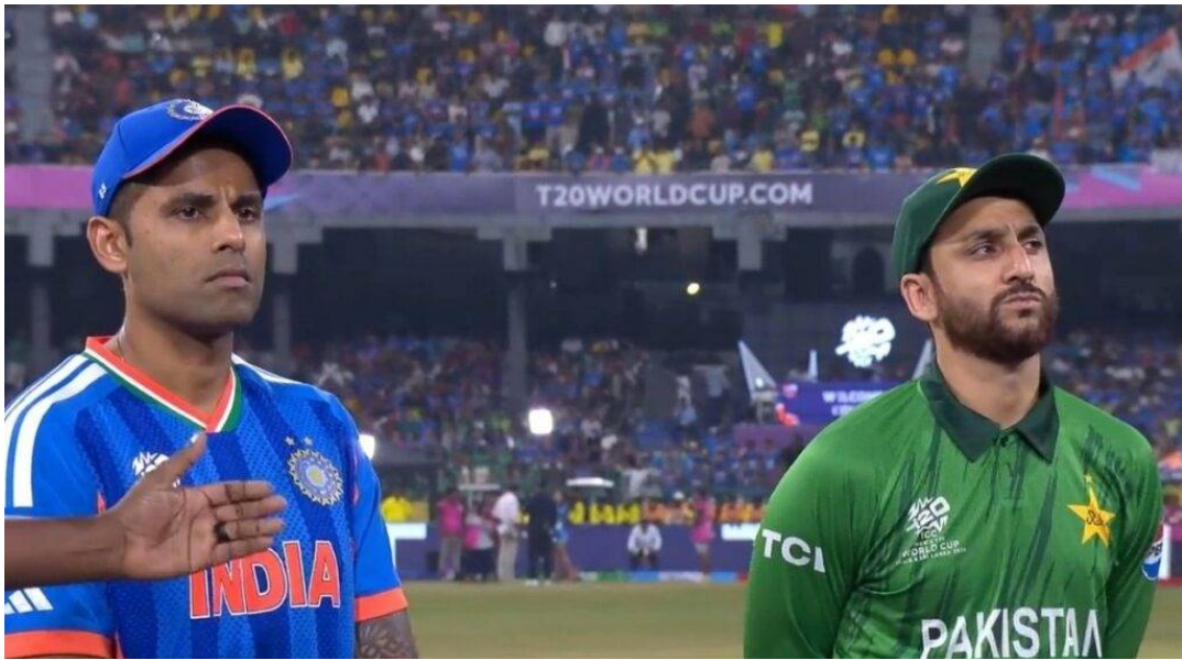
పాకిస్తాన్ పట్టు సాధించలేకపోయిందని, ఆ సమయంలో భారత బ్యాటర్లు వేగంగా పరుగులు సాధించడంతో మ్యాచ్ పూర్తిగా భారత్ వైపు మళ్లిందని అశ్విన్ విశ్లేషించారు. ఈ విషయంతో భారత్ లీగ్ దశలో ఆధిపత్యం కొనసాగిస్తూ తదుపరి దశకు సన్నద్ధమవుతోంది.

కొలంబో ఫిబ్రవరి 16 ,మన గళం : టీ20 ప్రపంచకప్ లో భారత్ పై పాకిస్తాన్ ఓటమిపై భారత మాజీ స్పిన్ ఆల్ రౌండర్ రవిచంద్రన్ అశ్విన్ ఆసక్తికర విశ్లేషణ చేశారు. టాస్ గెలిచిన పాకిస్తాన్ బౌలింగ్ ఎంచుకోవడమే ఓటమికి ప్రధాన కారణమని ఆయన అభిప్రాయపడ్డారు. ఛేజింగ్ కు అనుకూలం కాని మైదానంలో ఫీల్డింగ్ ఎంచుకోవడం వ్యూహాత్మక తప్పిదమని పేర్కొన్నారు. ప్రేమదాన మైదానంలో చివరి ఓవర్లలో పరుగులు చేయడం కష్టమని, ఒత్తిడిని ఎదుర్కోవడంలో భారత్ పాకిస్తాన్ కంటే ఎంతో మెరుగ్గా ఉందని అశ్విన్ తెలిపారు. కీలక సమయంలో భారత బ్యాటర్లు దూకుడుగా ఆడగా, పాకిస్తాన్ బౌలర్లు ఒత్తిడిని తట్టుకోలేకపోయారని అన్నారు. పాకిస్తాన్ కెప్టెన్ సల్యాన్ అలీ ఆఘా బౌలర్ వినియోగంపై కూడా అశ్విన్ ప్రశ్నించారు. ముఖ్యంగా ఇషాన్ కిషన్ ఎదుట షహీన్ అఫ్రిదిను కొనసాగించడం సరైన నిర్ణయం కాదని వ్యాఖ్యానించారు. పరిస్థితులకు అనుగుణంగా బౌలింగ్ మార్పులు చేయకపోవడం మ్యాచ్ పై ప్రభావం చూపిందని తెలిపారు. డెత్ ఓవర్లలో కూడా