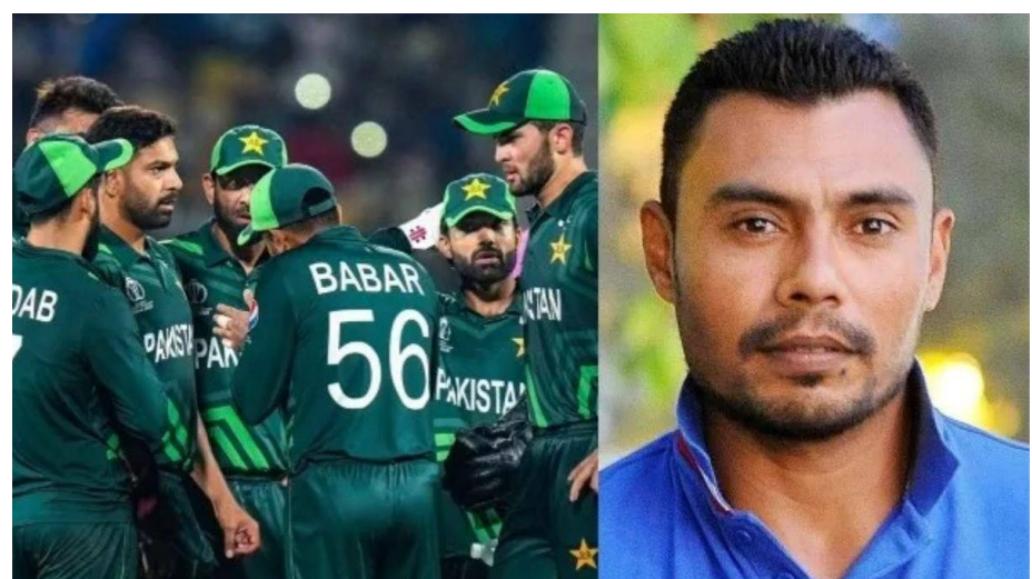
తెలిపారు. అలాగే అక్షర్ పటేల్ బౌలింగ్ లో స్టంపోట్ కావడం మ్యాచ్ మలుపు తిప్పిందని చెప్పారు. ఇటీవలి కాలంలో షహీన్ అఫ్రిది ఆశించిన స్థాయిలో రాజీంద్రం లేదని కనేరియా అభిప్రాయపడ్డారు. భారత్ బలమైన బ్యాటింగ్ క్రమాన్ని కలిగి ఉందని, పాకిస్తాన్ ఆ స్థాయి స్థిరత్వాన్ని చూపలేకపోతుందని వ్యాఖ్యానించారు. అనవసర ప్రకటనలు చేసి తరువాత ఓడిపోతే అభిమానుల్లో మరింత నిరాశ పెరుగుతుందని హెచ్చరించారు.

లాహోర్ ఫిబ్రవరి 16 ,మన గళం : టీ20 ప్రపంచకప్ లో భారత్ చేతిలో పాకిస్తాన్ ఓడిపోవడంపై ఆ దేశ మాజీ స్పిన్ నర్ డానిష్ కనేరియా తీవ్ర విమర్శలు చేశారు. లక్ష్యాలును చేదించడంలో పాక్ జట్టు ఎదుర్కొంటున్న ఇబ్బందులు ఈ మ్యాచ్ తో మరోసారి బయటపడ్డాయని వ్యాఖ్యానించారు. మైదానం వెలుపల ప్రకటనలు చేయడం కంటే ఆటగాళ్లు మైదానంలో ప్రదర్శనపై దృష్టి సారించాలని హితవు పలికారు. పాకిస్తాన్ ఆడిన తీరు తీవ్ర నిరాశ కలిగించిందని కనేరియా అన్నారు. ఉస్మాన్ తారిఖ్ భారత్ ను ఒంటిచేత్తో ఓడిస్తానన్నట్లుగా చేసిన వ్యాఖ్యలను గుర్తుచేస్తూ, ఇలాంటి ప్రకటనలు జట్టుకు మేలు చేయవని సూచించారు. భారత ఆటగాళ్లు మాటలు కంటే ప్రదర్శనతో సమాధానం ఇస్తారని ప్రశంసించారు. భారత్ నిర్దేశించిన లక్ష్యాన్ని చేదించడం సులభం కాదని పాకిస్తాన్ కు ముందే తెలుసుండాల్సిందని ఆయన పేర్కొన్నారు. వ్యూహారచనలో లోపాలు స్పష్టంగా కనిపించాయని, కోచింగ్ బృందం సరైన ప్రణాళికలు సిద్ధం చేయలేదని విమర్శించారు. ఇది పూర్తిగా గేమ్ ప్లాన్ లోపం వల్ల వచ్చిన ఓటమి అని అభిప్రాయపడ్డారు. క్లిష్ట సమయంలో జట్టును నడిపించే బాధ్యత సీనియర్ ఆటగాడు బాబర్ ఆజమి ఉంటుందని అన్నారు. ఉస్మాన్ ఖాన్ 34 బంతుల్లో 44 పరుగులు చేసి పోరాడినప్పటికీ, మిగతా బ్యాటర్లు విఫలమయ్యారని