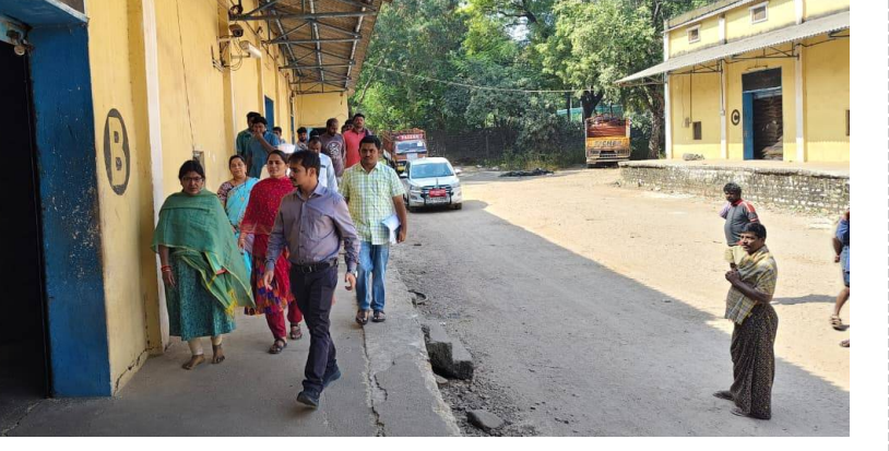
- గోదామును తనిఖీ చేసిన జేసీ