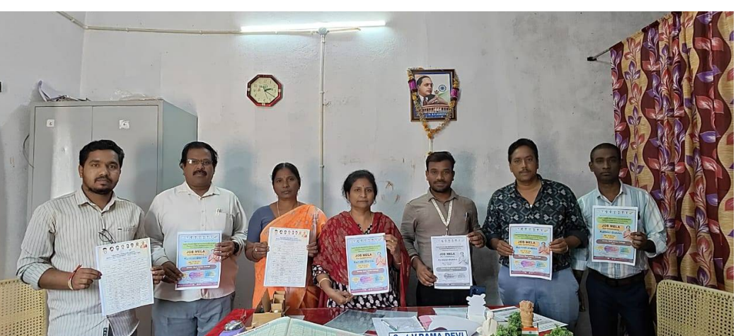
అభ్యర్థులు ఖచ్చితంగా విద్యార్థత పత్రాలు జిరాక్స్, ఆధార్ కార్డ్, రెండు ఫోటోలతో అర్హత కలిగిన నిరుద్యోగి యువతీ, యువకులు సద్వినియోగం చేసుకోవాలని కోరారు.మరిన్ని వివరాల కోసం 9010003132 నంబర్ ను సంప్రదించగలరన్నారు.