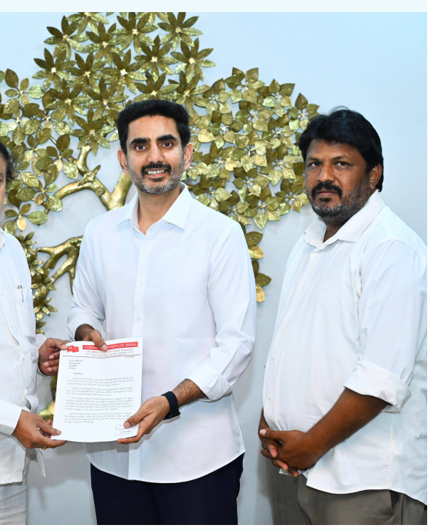
పరిష్కరించాలని మంత్రి గారిని విజ్ఞప్తి చేశారు. విద్యార్థుల భవిష్యత్తును దృష్టిలో ఉంచుకుని ప్రభుత్వం సానుకూల నిర్ణయం తీసుకుని తక్షణ చర్యలు చేపడుతుందని ఆశిస్తున్నట్లు సిపిఐ నాయకులు తెలిపారు.

పనులను పూర్తి చేయాలని కోరారు. ప్రస్తుతం పాఠశాలలో చదువుతున్న విద్యార్థులు అనేక ఇబ్బందులు ఎదుర్కొంటున్నారని, ముఖ్యంగా బాలికలకు సరైన పారిశుధ్య సదుపాయాలు లేకపోవడం వల్ల వారు ఆస్కార్యానికి గురవుతున్నారని నేతలు వివరించారు. అదనపు తరగతి గదుల నిర్మాణం పూర్తి కాకపోవడంతో తరగతులు నిర్వహణలో కూడా ఇబ్బందులు ఎదురవుతున్నాయని తెలిపారు. పాఠశాలను విద్యార్థులకు అనుకూలమైన వాతావరణంతో అభివృద్ధి చేయడం ప్రభుత్వ బాధ్యత అని సిపిఐ నాయకులు స్పష్టం చేశారు. గ్రామీణ ప్రాంతాల పాఠశాలల అభివృద్ధికి ప్రత్యేక దృష్టి సారించాలని, మొలగపల్లి జెడ్ పీ హైస్కూల్ సమస్యలను అత్యవసరంగా