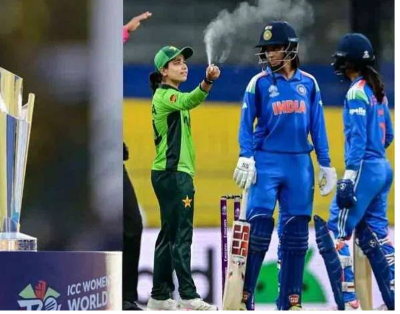
ముఖ్యంగా జూన్ 14న జరిగే భారత్ పాకిస్తాన్ పోరు టోర్నీకి కీలక మలుపు కావచ్చని భావిస్తున్నారు. మొత్తానికి, జూన్ నుంచి జూలై వరకు సాగనున్న ఈ మహా సమరం ప్రపంచ క్రికెట్ అభిమానులను మంత్ర ముగ్ధులను చేయనుందని అంచనాలు వ్యక్తమవుతున్నాయి. మహిళల క్రికెట్లో కొత్త చరిత్ర సృష్టించే సమయం దగ్గరపడుతోంది.

జరుగుతుంది. ఇక అభిమానులు ఎంతో ఆత్రుతగా ఎదురు చూస్తున్న భారత్ పాకిస్తాన్ మ్యాచ్ జూన్ 14న జరగనుంది. ఈ పోరు ఎప్పటిలాగే ఉత్సాహభరితంగా ఉండనుందని క్రీడా విశ్లేషకులు భావిస్తున్నారు. ఈ రెండు జట్ల మధ్య పోటీకి ప్రపంచవ్యాప్తంగా ప్రత్యేక ఆదరణ ఉంటుంది. టోర్నీలో మొత్తం 33 మ్యాచ్లు నిర్వహించనున్నారు. లీగ్ దశ, సెమీఫైనల్ పోటీలు ఓల్డ్ ట్రాఫోర్మ్, హెడింగ్స్, హ్యంప్షైర్ బోల్, బ్రిస్టల్ కౌంటీ గ్రౌండ్, ది ఓవల్ వంటి ప్రఖ్యాత మైదానాల్లో జరుగుతాయి. ఫైనల్ మ్యాచ్ను ప్రతిష్టా తృకమైన లార్డ్స్ మైదానంలో నిర్వహించనున్నారు. ప్రపంచ కప్ ఫైనల్కు లార్డ్స్ వేదిక కావడం ఈ టోర్నీకి మరింత ప్రతిష్టను తీసుకొచ్చింది. ఈ టోర్నీ మహిళల క్రికెట్కు మరింత ప్రాచుర్యం తీసుకురావడంలో కీలకంగా మారనుంది. గత కొన్నేళ్లుగా మహిళల క్రికెట్కు ప్రపంచ వ్యాప్తంగా ఆదరణ పెరుగుతోంది. భారీ ప్రేక్షకాదరణ, ప్రసార హక్కులు విలువ పెరగడం, ప్రొఫెషనల్ లీగ్ వృద్ధి ఇవి మహిళల క్రికెట్ స్థాయిని మరింత ఎత్తుకు తీసుకెళ్తున్నాయి. భారత్ జట్టు గత టోర్నీల్లో మంచి ప్రదర్శన చేసినప్పటికీ టైటిల్ దక్కించుకోలేకపోయింది. ఈసారి బలమైన జట్టుతో బరిలోకి దిగనున్న భారత్ మహిళలు ట్రోఫీపై కన్నేతాయి.