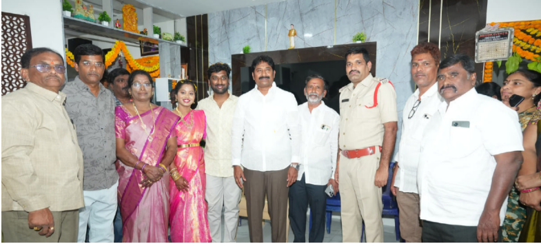
స్వర్ణ ఆంధ్ర స్వచ్ఛ ఆంధ్ర కార్యక్రమంలో పాల్గొన్న శాసనసభ్యులు ముత్తుముల