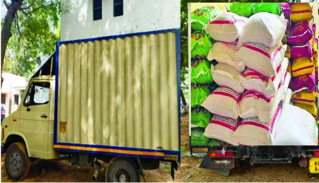
తిరుపతి, పతాకం న్యూస్: రేషన్ బియ్యాన్ని అక్రమంగా తరలిస్తున్న మూడు గుట్టును తిరుపతి

పోలీసులు రట్టు చేశారు. చంద్రగిరి మండలం గాదంకి టోల్ ప్లాజా వద్ద మంగళవారం పోలీసులు చేపట్టిన తనిఖీల్లో.. పాల వ్యాన్లో అక్రమంగా రేషన్ బియ్యం తరలిస్తున్నట్లు గుర్తించారు. ఈ ఘటనకు సంబంధించి వ్యాన్ డ్రైవర్తో పాటు మరో వ్యక్తిని అదుపులోకి తీసుకున్నారు పోలీసులు. తిరుపతి నుంచి కర్ణాటకకు ఈ బియ్యాన్ని తరలిస్తున్నట్లు విచారణలో తేలిందన్నారు. బియ్యంతో సహా వాహనాన్ని స్వాధీనం చేసుకున్నట్లు తెలిపారు. స్వాధీనం చేసుకున్న రేషన్ బియ్యం సుమారు 5 టన్నులు ఉంటుందని పోలీసులు పేర్కొన్నారు. ఈ ఘటనపై కేసు నమోదు చేసి దర్యాప్తు చేపట్టామన్నారు. ఈ వ్యవహారం వెనుక ఉన్నవారిని పట్టుకునేందుకు దర్యాప్తు ముమ్మరం చేశామన్నారు. అయితే.. తిరుపతి పరిసర ప్రాంతాల నుంచి ఎర్రచందనం, కలప తదితర వస్తువులను అక్రమంగా పెట్టెలపై తరలిస్తున్నట్లు ఆరోపణలు వెల్లవెత్తాయి. ఈ నేపథ్యంలో జిల్లాలోని పలు కీలక ప్రాంతాలు సహా రాష్ట్ర సరిహద్దుల్లో పోలీసులు తనిఖీలు చేపట్టారు.