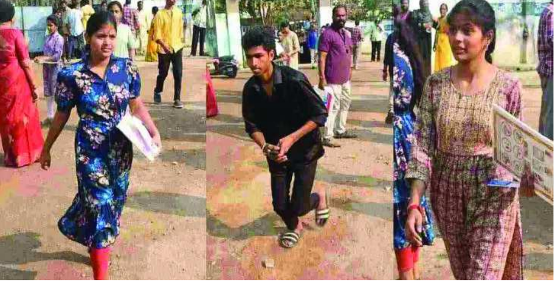
హైదరాబాద్, పతాకం న్యూస్: తెలంగాణ లింగంపల్లి, హైదరాబాద్ లోని పరీక్షా కేంద్రాల వద్ద రాష్ట్రవ్యాప్తంగా నుంచి వదో తరగతి పబ్లిక్ పరీక్షలు సందడి నెలకొంది. లింగంపల్లి, చందానగర్, మియాపూర్ శనివారం ప్రారంభమయ్యాయి. ఈ నేపథ్యంలో పరిసర ప్రాంతాల్లోని ప్రభుత్వ ప్రైవేటు పాఠశాలల్లో

విద్యార్థులు చేసిన పరీక్షా కేంద్రాలు విద్యార్థులతో కిక్కిరిసిపోయాయి. కేంద్రాల వద్ద పోలీసులు 144 సెక్షన్ విధించారు. పరీక్షా సమయంలో ఎలాంటి అవాంఛనీయ సంఘటనలు జరగకుండా, మాస్ కాపీయింగ్‌కు తావు లేకుండా సీని ఇమెరాల నిఘాలో పరీక్షలను నిర్వహిస్తున్నారు. స్థానిక పోలీసులు కేంద్రాల సమీపంలోని జిరాక్స్ సెంటర్లను మూసివేయించారు. పరీక్ష ఉదయం 9:30 గంటలకు ప్రారంభమై మధ్యాహ్నం 12:30 గంటలకు ముగిసింది. అధికారులు నిమిషం నిబంధనను కఠినంగా అమలు చేశారు. ఉదయం 9:35 గంటల తర్వాత వచ్చిన విద్యార్థులను లోపలికి అనుమతించలేదు. పలు కేంద్రాలను విద్యాశాఖ ఉన్నతాధికారులు, ప్లయింగ్ స్టాఫ్ బృందాలు ఆకస్మికంగా తనిఖీ చేశాయి. వచ్చే పరీక్షలకు హాజరయ్యే విద్యార్థులు తమ హాల్ టికెట్లను జాగ్రత్తగా ఉంచుకోవాలని, ఎలక్ట్రానిక్ వాచ్‌లు ఫోన్లు తీసుకురాకూడదని అధికారులు హెచ్చరిస్తున్నారు. తదుపరి పరీక్ష (సెకండ్ లాంఛ్) మార్చి 18న జరగనుంది.