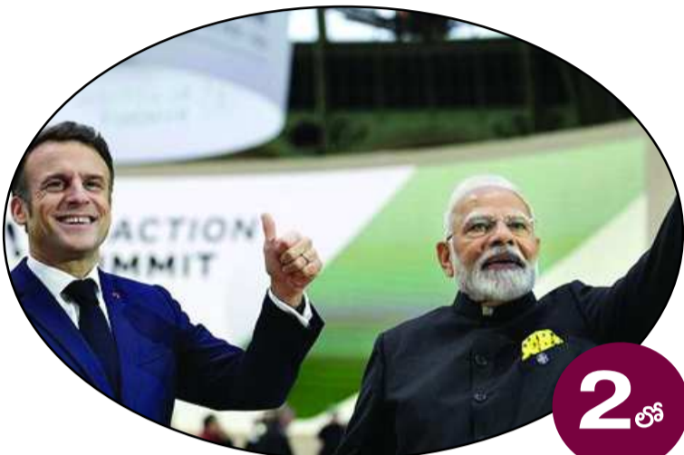
నేడు మోడీతో మాక్రాన్ భేటీ