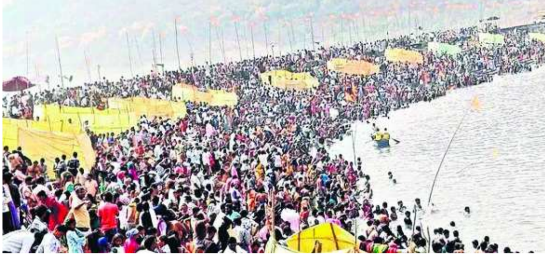
రావికమతం, పతాకం స్వాస్: భక్తజన కోటితో మార్గేగాయి. ఉమ్మడి జలాశయం ఉత్తరాంధ్రలోని పలు ప్రాంతాల నుంచి వేలాదిగా భక్తులు తరలివచ్చారు. స్మరణతో ఆలయ ప్రాంగణం, జలాశయం పరిసరాలు ఆలయంలో శివలింగం రూపంలో వున్న పోతురా