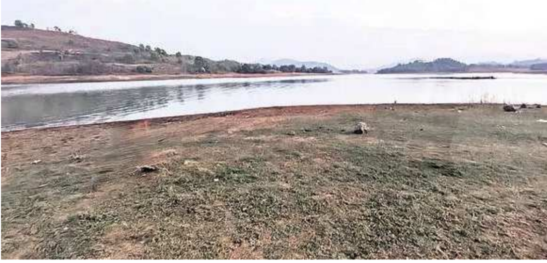
ముంగిపట్టు, పతాకం స్టూప్: మండలంలోని పరిధిలో మత్స్యగెడ్డ వెలవెలబోతున్నది. సుమారు నెలన్నర సుజనకోట, పెదగూడ, పనసపుట్టు, జోలాపుట్టు, లక్ష్మీ క్రితం వరకు మత్స్యగెడ్డ నిండు కుండను తలపించింది. పురం, బుంగాపుట్టు, రంగబయలు తదితర పంచాయతీల అయితే రెండు నెలల నుంచి పరివాహక ప్రాంతాల్లో

వర్షాలు లేకపోవడం, మరోవైపు మాచ్ ఖండ్ జలవిద్యుత్ కేంద్రానికి నిరంతరాయంగా నీటిని సరఫరా చేస్తుండడంతో మత్స్యగెడ్డలో నీటి నిల్వలు వేగంగా తగ్గిపోతున్నాయి. ప్రస్తుతం శీతాకాలం అయినప్పటికీ మధ్యాహ్నంపూట ఎండ తారెత్తిస్తున్నది. దీనివల్ల కొంతమేర నీరు ఆవరణం వస్తుంది. వేసవి ప్రారంభానికి ముందే నీటి నిల్వలు తగ్గతుండడంతో గ్రామాల్లో భూగర్భ జలాలు మరింత దిగజారి, తాగునీటి ఎద్దడి ఏర్పడుతుందని పలు గ్రామాల గిరిజనులు ఆందోళన చెందుతున్నారు. మత్స్యగెడ్డలో నీటి నిల్వలు తగ్గిపోతుండడంతో జోలాపుట్టు జలాశయం స్పిల్ వే గేట్ల ద్వారా దుడుము జలాశయానికి (మాచ్ ఖండ్ పవర్ ప్రాజెక్టు) నీటి విడుదల జరగని పరిస్థితి నెలకొంటున్నది. దీంతో డ్యామ్ రివర్ స్టూప్ ద్వారా నీటిని విడుదల చేయాలిని వస్తుందని అధికారులు చెబుతున్నారు. ఏప్రిల్ నుంచి వేసవి వర్షాలు కురిస్తే మత్స్యగెడ్డలో కొత్త నీరు చేరుతుందని, లేకపోతే భూగర్భజలాలు మరింత దిగజారి, తాగునీటి సమస్య ఏర్పడుతుందని ఆయా గ్రామాల గిరిజనులు అంటున్నారు.