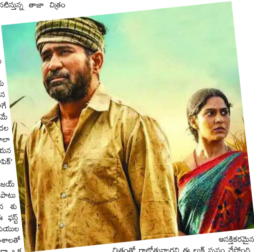
ఆసక్తికరమైన చిత్రంతో రాబోతున్నారని ఈ లుక్ సృష్టం చేస్తోంది.