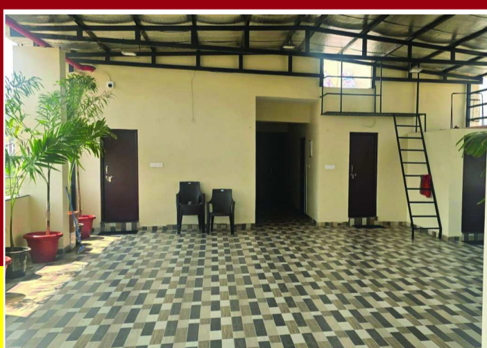
అడ్డగోలుగా అక్రమ నిర్మాణం

రేపటి సంచకలో బస్సువోయే వాస్తవాలతో ప్రత్యేక కథనం మీ పతాకం న్యూస్ లో