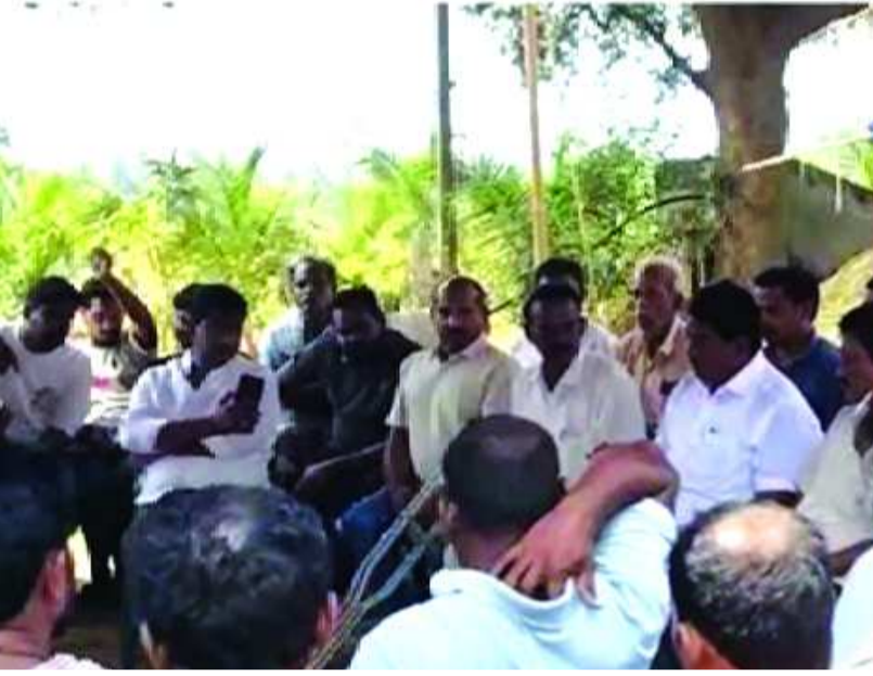
శ్రీకాకుళం, పతాకం స్ట్రాస్: శ్రీకాకుళం జిల్లా రణస్థలం మండలం కొండములగాం