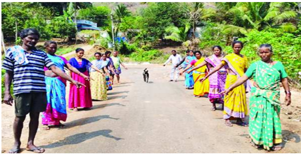
రావికమతం, పతాకం స్థాపన: అనకాపల్లి జిల్లా రావికమతం మండలం, జూ కొట్లాబెల్లి గిరిజనులకు తారు రోడ్డు వచ్చింది. అయితే బస్ సౌకర్యం కల్పించాలని, సెల్ టవర్ ఏర్పాటు చేయాలని 7 గ్రామాల గిరిజనులు కోరారు. బుధవారం వారు