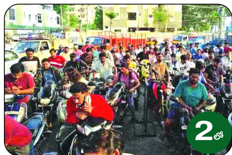
పెట్రోల్ కోసం బంకులకు వాహనదారులు క్యూ