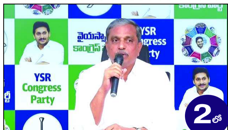
అమరావతిపై అసెంబ్లీలో తీర్మానం అనేది చంద్రబాబు ఆడుతున్న డ్రామా: సజ్జల

Visakhapatnam, Srikakulam, Allurisitarama, Rajamahendravaram, Vijayawada, Tirupati, Anathapuram