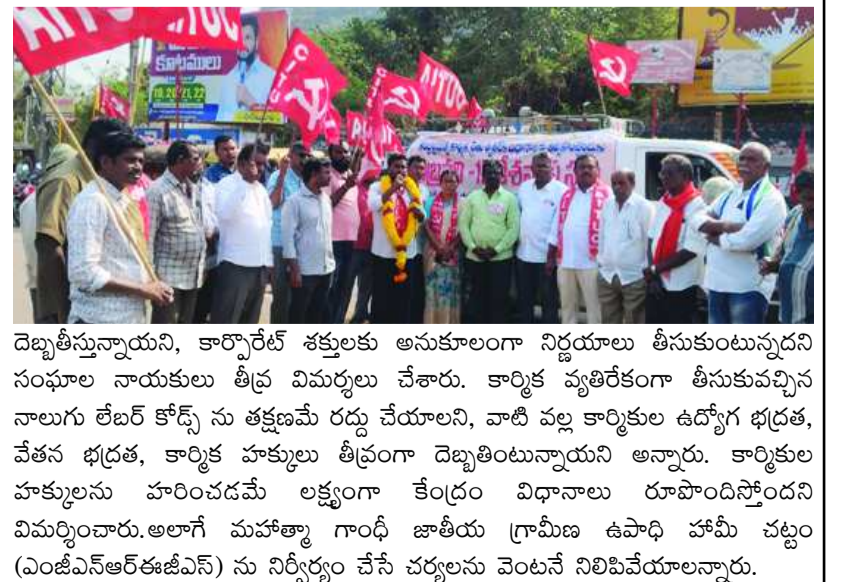
దెబ్బతిస్తున్నాయని, కార్పొరేట్ శక్తులకు అనుకూలంగా నిర్ణయాలు తీసుకుంటున్నదని సంఘాల నాయకులు తీవ్ర విమర్శలు చేశారు. కార్మిక వ్యతిరేకంగా తీసుకువచ్చిన నాలుగు లేబర్ కోడ్స్ ను తక్షణమే రద్దు చేయాలని, వాటి వల్ల కార్మికుల ఉద్యోగ భద్రత, వేతన భద్రత, కార్మిక హక్కులు తీవ్రంగా దెబ్బతింటున్నాయని అన్నారు. కార్మికుల హక్కులను హరించడమే లక్ష్యంగా కేంద్రం విధానాలు రూపొందిస్తోందని విమర్శించారు.అలాగే మహాత్మా గాంధీ జాతీయ గ్రామీణ ఉపాధి హామీ చట్టం (ఎంజీఎన్ఆర్జీజీఎస్) ను నిర్మూలన చేసే చర్యలను వెంటనే నిలిపివేయాలన్నారు.

అమరావతి, పతాకం స్టూస్: దేశంలోని కార్మికులు, రైతులు ఎదుర్కొంటున్న సమస్యలకు కేంద్ర ప్రభుత్వ విధానాలే ప్రధాన కారణమని ఆరోపిస్తూ, కార్మిక--రైతు సంఘాలు ఫిబ్రవరి 12న దేశవ్యాప్త సమ్మెకు పిలుపునిచ్చాయి. ఈ నేపథ్యంలో సిబియో ఏఐటీయూసీ ఇతర కార్మిక సంఘాల జిల్లా జాత శుక్రవారం మంగళగిరి కి చేరుకుంది. ఎయిమ్స్ ప్రధాన ద్వారం వద్ద జాతకు నాయకులు ఘన స్వాగతం పలికారు. అక్కడి నుంచి ర్యాపీగా అంజెద్దర్ సెంటర్ కు చేరుకొని అంజెద్దర్ విగ్రహానికి పూలమాలలు వేసి నివాళులర్పించారు. అనంతరం గాలిగోపురం వద్ద గల భగత్ సింగ్ విగ్రహానికి పూలమాలలు వేసి నివాళులర్పించారు. అక్కడ నుంచి ర్యాపీగా మెయిన్ బజార్ మీదగా పూల మార్కెట్ సెంటర్ కు చేరుకుంది. ఆయా సెంటర్లలో కార్మికులను ఉద్దేశించి ఏఐటీయూసీ, సిబియో నాయకులు ప్రసంగిస్తూ కేంద్ర ప్రభుత్వం అమలు చేస్తున్న కార్మిక, వ్యవసాయ రంగ విధానాలు సామాన్య ప్రజల జీవనాధారాలను