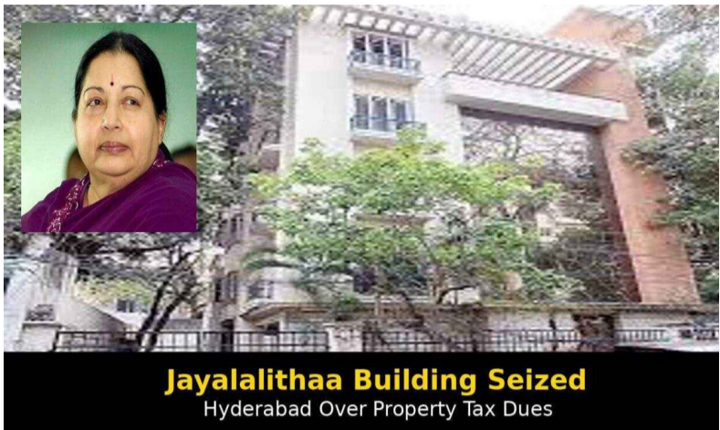
Jayalalitha Building Seized Hyderabad Over Property Tax Dues