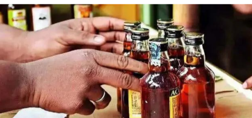
కేసులు మాత్రమే అమ్మకమయ్యాయి. ఈ ఏడాది డిసెంబర్ 31న అమ్మకాలు గత సంవత్సరం కంటే గణనీయంగా పెరిగాయని ఎమ్మెల్యే అధికారులు చెబుతున్నారు. ఈ సంవత్సరం మద్యం వినియోగం పెరుగుదల కారణంగా రాష్ట్ర ప్రభుత్వానికి పన్నుల

అమరావతి, జనవరి 1: న్యూఇయర్ వేడుకల సందర్భంగా మందుబాబులు అరుదైన రికార్డ్ సృష్టించారు. డిసెంబర్ 31వ తేదీన ఆంధ్రప్రదేశ్ రాష్ట్రంలో మద్యం విక్రయాలు గణనీయంగా పెరిగాయి. ఈ మేరకు ఇందుకు సంబంధించిన వివరాలను ఎమ్మెల్యే అధికారులు వెల్లడించారు. నిన్న ఒక్కరోజులో రూ.172 కోట్ల విలువ కలిగిన మద్యం అమ్మకాలు జరిగాయని చెప్పుకొచ్చారు. ఈ విక్రయాల్లో 2,20,719 కేసుల మద్యం, 95,026 కేసుల బీరు విక్రయించినట్లు వివరించారు. గత ఏడాదితో పోలిస్తే రూ.60 కోట్లమేర ఎక్కువగా మద్యం తాగుగు లెక్కపై ఉంది. గత సంవత్సరం డిసెంబర్ 31వ తేదీన రూ.112 కోట్ల విలువ కలిగిన మద్యం మాత్రమే విక్రయించారు. 2024 డిసెంబర్ 31లో 1,26,128 మద్యం కేసులు, 68,754 బీర్