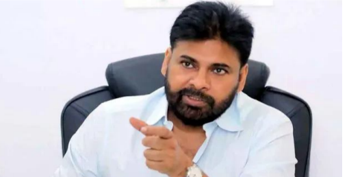
తమ ప్రభుత్వ లక్ష్యమని వ్యాఖ్యానించారు. ఏపీలోని ఐదు జిల్లాల పరిధిలో 'అమరజీవి జలధారలు' కార్యక్రమం ద్వారా నీటి వనరుల సంరక్షణ, భూగర్భ జలాల పెంపు, సాగునీటి లభ్యత మెరుగుపరచేలా చర్యలు తీసుకుంటున్నామని వివరించారు. డీని

అమరావతి, జనవరి 1: గ్రామీణ ఆంధ్రప్రదేశ్ అభివృద్ధిని లక్ష్యంగా పెట్టుకుని కూటమి ప్రభుత్వం ముందుకెళ్తుందని ఏపీ ఉప ముఖ్యమంత్రి పవన్ కల్యాణ్ వ్యాఖ్యానించారు. ప్రజలకు ఆమోదయోగ్యమైన సంస్కరణలను తమ ప్రభుత్వం అమలు చేస్తోందని పేర్కొన్నారు. ఈ మేరకు డిప్యూటీ సీఎం కార్యాలయం ఒక ప్రకటన విడుదల చేసింది. ప్రజల సమస్యలకు పరిష్కారం చూపుతూ, పర్యావరణ పరిరక్షణకు ప్రాధాన్యత ఇస్తూ, ప్రజలకు ఇచ్చిన హామీలను అమలు చేసే దిశగా కూటమి సర్కార్ పరిపాలన కొనసాగుతోందని స్పష్టం చేశారు. పల్లె పండగ 2.0 కార్యక్రమం ద్వారా గ్రామాల్లో రెడ్డింపు అభివృద్ధి లక్ష్యాలను సాధించేందుకు చర్యలు చేపట్టామని వివరించారు. మౌలిక వసతుల అభివృద్ధి, పరిశుభ్రత, వారి కార్యక్రమాలు, తదితర అంశాలతో గ్రామీణ ప్రాంతాల్లో సమగ్ర మార్పు తీసుకురావడమే