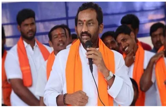
భరోసా కల్పించారు. వ్యక్తిగత రీత్యా కూడా గ్రామపంచాయతీల ఏర్పాటుకు కృషి చేస్తానని మాట్లాడారు. బొప్పాపూర్ గ్రామ