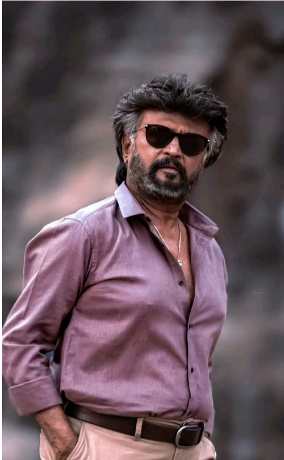
అశ్వతీ మారిముత్తు లేదా రామ్ కుమార్ బాలకృష్ణలో ఎవరు ఈ బాధ్యతను తీసుకుంటారో చూడాలి. అధికారిక ప్రకటన కోసం అభిమానులు ఆసక్తిగా ఎదురుచూస్తున్నారు.