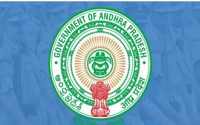
కోసం జిల్లా సైనిక సంక్షేమ అధికారి చేసిన సిఫార్సుల రిజిస్టర్ ఒక్కటే సరిపోతుందని సర్కార్ స్పష్టం చేసింది. అదే విధంగా

అమరావతి, జనవరి 1: రాష్ట్ర ప్రజలకు రెవెన్యూ శాఖ అందించే న్యూ ఇయర్ గిఫ్ట్ ఇచ్చింది. భూయాజమానులకు ఊరటనిచ్చేలా 22వ జాబితా నుంచి కొన్ని రకాల భూములను తొలగిస్తూ రెవెన్యూ శాఖ మంత్రి అనగాని సత్యప్రసాద్ సంతకం చేశారు. ఐదు రకాల భూములను 22వ జాబితా నుంచి తొలగిస్తూ కొత్త సంవత్సరంలో మంత్రి తొలి సంతకం చేశారు. మిగిలిన నాలుగు రకాల భూములపై త్వరలో జీవోఎంలో చర్చించి నిర?యం తీసుకునే అవకాశం ఉంది. ప్రభుత్వ నిర?యం ప్రకారం ప్రైవేట్ భూములను 22వ జాబితా నుంచి పూర్తిగా తొలగించనున్నారు. ప్రైవేటు పట్టణ భూములకు ఎవరు దరఖాస్తు చేసుకున్నా అధికారులు సుమోటోగా తొలగించాల్సి ఉంటుంది. ప్రస్తుత, మాజీ సైనిక ఉద్యోగుల భూములకు సంబంధిత పత్రాలు ఉంటే నిషిద్ధ జాబితా నుంచి తొలగించాలని ప్రభుత్వం ఆదేశించింది. అలాగే స్వాతంత్ర్య సమర యోధుల భూములను, రాజకీయ బాధితులకు కేటాయించిన భూములను కూడా 22వ నుండి తొలగించనున్నారు. భూ కేటాయింపుల