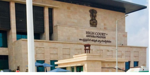
ఎంపిక ప్రక్రియ చట్టరీత్యా చెల్లదని కోర్టు తేల్చి చెప్పింది. రేషన్ డీల్డర్ ఎంపిక ప్రక్రియలో గతంలో హైకోర్టు జారీ చేసిన ఆదేశాలకు అనుగుణంగా.. మార్కులను నిర్ణయించాలని హైకోర్టు ఏపీ ప్రభుత్వానికి ఆదేశాలు జారీ చేసింది. ప్రస్తుత కేసులో పిటిషన్ ను కొట్టివేస్తూ.. ఈ అంశంలో సింగిల్ జడ్జి ఇచ్చిన తీర్పును రద్దు చేస్తున్నట్లు ధర్మాసనం ప్రకటించింది. కొత్త ఎంపిక ప్రక్రియ ప్రారంభించాలంటూ ప్రభుత్వానికి కోర్టు ఆదేశాలు జారీ చేసింది. ఈ మేరకు ప్రధాన న్యాయమూర్తి జస్టిస్ ధీరజేసింగ్ తాకూర్, న్యాయమూర్తి జస్టిస్ చీమలపాటి రవీంద్ర్ కూడిన

అమరావతి: ఆంధ్రప్రదేశ్ హైకోర్టు కీలక తీర్పు వెల్లడించింది. రేషన్ డీల్డర్ ఎంపిక ప్రక్రియను నిలిపివేయాలని ఆదేశించింది. రేషన్ డీల్డర్ ఎంపిక కోసం రాత పరీక్షతో సమానంగా ఇంటర్వ్యూకు 50 మార్కులు కేటాయించడాన్ని తప్పు పట్టిన హైకోర్టు.. కొత్త మార్గదర్శకాలు జారీ చేసినంతవరకు డీల్డర్ ఎంపిక ప్రక్రియను నిలిపివేయాలంటూ ఆదేశాలు జారీ చేసింది. అయితే ఇదే అంశంపై ఆంధ్రప్రదేశ్ హైకోర్టు గతంలోనే ఆదేశాలిచ్చి.. ప్రభుత్వం దాన్ని అమలు చేయకపోవడం పట్ల హైకోర్టు తీవ్రంగా స్పందించింది. కోర్టు ఆదేశాలకు విరుద్ధంగా జరిగిన డీల్డర్ ఎంపిక ప్రక్రియ చట్టరీత్యా చెల్లదని కోర్టు స్పష్టం చేసింది. ఏపీలో రేషన్ డీల్డర్ నియామకం కోసం ప్రభుత్వం నోటిఫికేషన్ జారీ చేసింది. అయితే రాత పరీక్షతో సమానంగా ఇంటర్వ్యూకు కూడా 50 మార్కులు కేటాయించారు. 2011లో జీవో-4ను జారీ చేసింది. అయితే హైకోర్టు అప్పుడే దీన్ని కొట్టివేసింది. అనూనా సరే ప్రభుత్వం.. 50 మార్కులతోనే ఎంపిక ప్రక్రియ చేపట్టింది. దీన్ని తీవ్రంగా తప్పుపట్టిన కోర్టు.. ఇది న్యాయస్థానం ఆదేశాలను ధిక్కరించడమే అవుతుందని స్పష్టం చేసింది. కోర్టు ఆదేశాలకు విరుద్ధంగా చేపట్టిన డీల్డర్