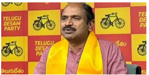
చేసే విధంగా శనివారం (జనవరి 31) వైసీపీ నేతలు వ్యవహరించారని విమర్శించారు. వ్యవస్థలను ఇబ్బందులకు గురి

న్యూఢిల్లీ, ఫిబ్రవరి 1: ముఖ్యమంత్రి చంద్రబాబు నాయుడిపై వైసీపీ నేత అంబటి రాంబాబు చేసిన వ్యాఖ్యలపై టీడీపీ నేతలు తీవ్ర స్థాయిలో ఆగ్రహం వ్యక్తం చేస్తున్నారు. సీఎంపై అంబటి చేసిన వ్యాఖ్యలను టీడీపీ ఎంపీ కలిశెట్టి అప్పలనాయుడు ఖండించారు. అలాంటి కామెంట్స్ దురదృష్టకరమన్నారు. అంబటి వ్యాఖ్యలు సరికావని.. ఆయన బహిరంగ క్షమాపణలు చెప్పాలని డిమాండ్ చేశారు. గతంలో కూడా మాజీ సీఎం జగన్మోహన్ రెడ్డి.. చంద్రబాబు నాయుడును కాల్చి చంపాలని కామెంట్ చేశారని గుర్తుచేశారు. అంతేకాకుండా, సీఎం కుటుంబ సభ్యులను కూడా దూషించారని పైర్ అయ్యారు. వైసీపీ నేతల వ్యాఖ్యలు చూస్తే బాధేస్తోందన్నారు ఎంపీ. తిరుమల లద్దా అంశాన్ని డైరెక్ట్