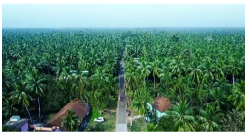
కొబ్బరి పంటకు కనీస మద్దతు ధర పెంపును క్యాబినెట్ ఆమోదించింది. మిల్లింగ్ కొబ్బరి క్వింటాలుకు రూ. 12,027గా, బాల్ కొబ్బరి క్వింటాలుకు 12,500గా నిర్ణయించారు. కాగా, కేంద్రం ప్రకటించిన కొత్త పథకం ద్వారా కొబ్బరి అధికంగా సాగు చేసే ఆంధ్రప్రదేశ్, కేరళ, తమిళనాడు రాష్ట్రాల్లో రైతులకు ప్రయోజనం కలగనుంది. ఏపీలోని కోనసీమ, శ్రీకాకుళంలోని ఉద్ధానంలో కొబ్బరి అధికంగా సాగు చేస్తున్నారు. కోనసీమలో

న్యూఢిల్లీ, ఫిబ్రవరి 1: కేంద్ర బడ్జెట్ 2026-27లో కొబ్బరి సాగును ప్రోత్సహించే అనేక కార్యక్రమాలను ప్రవేశపెట్టారు. ప్రధానంగా తీరప్రాంతాల్లో ప్రత్యేక కార్యక్రమాల ద్వారా కొబ్బరి ఉత్పత్తి పెంపు, అధిక విలువ జోడింపు, రైతుల ఆదాయాన్ని పెంచడమే లక్ష్యంగా కేంద్రం కొత్త పథకం తీసుకొచ్చింది. కొబ్బరి ఉత్పత్తి, ప్రాసెసింగ్ కోసం ప్రత్యేక కార్యక్రమం ప్రారంభించనున్నట్లు కేంద్ర ఆర్థిక మంత్రి నిర్మలా సీతారామన్ వెల్లడించారు. దీని ద్వారా కొబ్బరి ఎగుమతులు, ఉత్పాదకతను పెంచడమే లక్ష్యంగా పెట్టుకున్నట్లు తెలిపారు. కోకో, జీడిపప్పుతో పాటు కొబ్బరి సాగును ప్రోత్సహించాలి అమె చెప్పారు. ఈ పథకం ద్వారా కొబ్బరి ఉత్పత్తి చేసే రాష్ట్రాల్లో రైతుల ఆదాయాన్ని రెట్టింపు చేయడమే లక్ష్యంగా పెట్టుకున్నట్లు పేర్కొన్నారు. తీర ప్రాంతాల్లో కొబ్బరి, గండ్ల చెట్ల ఏర్పాటుకు ప్రోత్సాహం, కాపురేని చెట్ల స్థానంలో కొత్తవి ఏర్పాటు, జీడిపప్పు, కోకో ఉత్పత్తి, గండ్ల చెట్ల వనాలు, బాదం, పైన్ నట్స్ కోసం ప్రత్యేక పథకం ప్రవేశపెట్టారు. కాగా, ఇప్పటికే బడ్జెట్కు ముందు