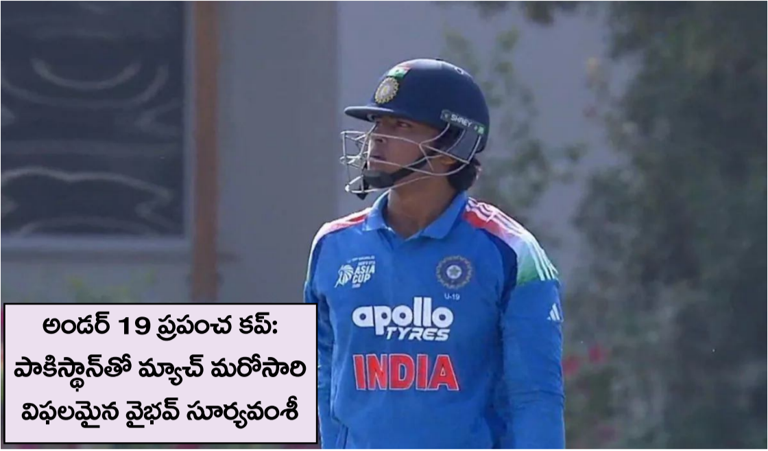
అందర్ 19 ప్రపంచ కప్: పాకిస్తాన్తో మ్యాచ్ మరోసారి విఫలమైన వైభవ్ సూర్యవంశీ