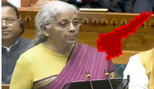
బర్లీ వాటింగ్ రూట్స్ ఏర్పాటు చేయనున్నట్లు వెల్లడించారు. మరోవైపు అరకు వ్యాధిలో మౌంటెన్ ట్రైన్లు ప్రకటించిన నేపథ్యంలో.. ఆ ప్రాంతం పర్యాటకంగా మరింత అభివృద్ధి చెందుతుందని నిపుణులు అభిప్రాయపడుతున్నారు. పర్యాటక రంగం అభివృద్ధి కోసం కేంద్ర ప్రభుత్వం దేశవ్యాప్తంగా 20 కీలకమైన ప్రాంతాలను గుర్తించింది.. వీటిని డెవలప్ మెంట్ హాట్ స్పాట్స్ తీర్చిదిద్దడానికే నిర్మలా సీతారామన్ తెలిపారు. ఈ క్రమంలోనే అరకు వ్యాధిని ట్రెకింగ్, ఎకే టూరిజం, స్కీల్

న్యూఢిల్లీ, ఫిబ్రవరి 1: కేంద్ర ఆర్థిక మంత్రి నిర్మలా సీతారామన్ ప్రవేశపెట్టిన 2026-27 బడ్జెట్లో ఏపీకి శుభవార్తలు అందాయి. అరకు వ్యాధిలో మౌంటెన్ ట్రైన్లు, పులికాల్ సరస్సు వద్ద బర్లీ వాటింగ్ రూట్స్ ఏర్పాటు వంటి నిర్ణయాలను ఆర్థిక మంత్రి ప్రకటించారు. ఈ నిర్ణయాల అమలుతో ఆయా ప్రాంతాలు పర్యాటకంగా మరింత అభివృద్ధి చెందుతాయని అధికారులు చెప్పారు. వీటిలో పాటూగా ఏపీలో రేర్ ఎర్త్ కారిడార్ ఏర్పాటును సైతం ఆర్థికమంత్రి ప్రకటించిన సంగతి తెలిసిందే. కేంద్ర ఆర్థిక మంత్రి నిర్మలా సీతారామన్ బడ్జెట్ ప్రసంగం 2026 కేంద్ర బడ్జెట్లో ఏపీకి కేంద్ర ప్రభుత్వం శుభవార్త వినిపించింది. 2026 బడ్జెట్ ప్రసంగం సందర్భంగా కేంద్ర ఆర్థిక మంత్రి నిర్మలా సీతారామన్.. ఏపీకి గుడ్ న్యూస్ చెప్పారు. హిమాలయ ప్రదేశ్, ఉత్తరాఖండ్, జమ్మూకశ్మీర్, తూర్పు కనుమలలోని అరకు వ్యాధి, పశ్చిమ కనుమలలోని పొదిగినపల్లె ప్రాంతాలలో మౌంటెన్ ట్రైన్లు ప్రవేశపెట్టనున్నట్లు ప్రకటించారు. ఈ మేరకు కేంద్ర ప్రభుత్వం ప్రణాళికలు రచిస్తోందని వెల్లడించారు. అలాగే ఏపీ, తమిళనాడు, కేరళ, ఒడిశాలో రేర్ ఎర్త్ కారిడార్లను సైతం ఏర్పాటు చేయనున్నట్లు ప్రకటించారు. అలాగే పులికాల్ సరస్సు చుట్టూ వక్రలను ఏర్పాటుచేలా