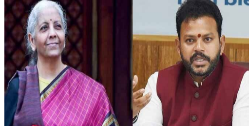
తెలిపారు. నిర్మలా సీతారామన్ ప్రవేశపెట్టిన కేంద్ర బడ్జెట్ స్థిరమైన ఆర్థిక విధానంతో పాటూ పెట్టుబడులు సంస్కరణలపై ప్రత్యేక దృష్టి పెట్టడం ద్వారా.. దేశానికి మరింత ప్రగతిని, సుస్థిర అభివృద్ధిని తీసుకురాగలిగిందని ఆయన అన్నారు. కొత్త ఆదాయపు పన్ను చట్టం సామాన్యులను మరింత ఆకర్షిస్తోందని

ధిల్లీ, ఫిబ్రవరి 1: కేంద్ర ఆర్థిక మంత్రి నిర్మలా సీతారామన్ ఆదివారం (ఫిబ్రవరి 1న) ఆర్థిక బడ్జెట్ 2026-27ను పార్లమెంట్ లో ప్రవేశ పెట్టారు. ఈ బడ్జెట్పై అనేక మంది ప్రశంసలు రాశు మంత్రి కింజరాపు రామ్మోహన్ నాయుడుకూడా నిర్మలమ్మ బడ్జెట్ను ప్రశంసించారు. మరనగా తొమ్మిదోసారి కేంద్ర బడ్జెట్ను ప్రవేశపెట్టిన నిర్మలా సీతారామన్ దేశాభివృద్ధి, ఆర్థిక క్రమశిక్షణ, మౌలిక సదుపాయాలు, విద్య, ఆరోగ్యం, రైతులు, యువత మీద ప్రత్యేక దృష్టి పెట్టారని అన్నారు. బడ్జెట్పై ఆయన ప్రకటన విడుదల చేశారు. విదేశీ టూర్లపై పన్ను తగ్గించే సౌకర్యం పౌర విమానయాన రంగానికి మరింత ఊతమిస్తుందని తెలిపారు. 'ప్రధాన మంత్రి వికసిత భారత్ లక్ష్యాలను మరింత వేగంగా చేరుకునేందుకు సాయపడుతుందని అన్నారు. అదేవిధంగా పౌర విమానాల విడిభాగాలపై ట్యాక్స్ తగ్గించడం శుభపరిణామమని