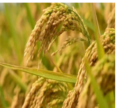
సుమారు రూ. 9,000 కోట్లను రైతుల ఖాతాల్లో జమ చేయాలని ప్రభుత్వం లక్ష్యంగా పెట్టుకుంది. గత వానాకాలం సీజన్లో లబ్ధి పొందిన ప్రతి రైతుకు, ఈ యాసంగిలో కూడా అటువంటి కేతలు లేకుండా పూర్తిస్థాయి పెట్టుబడి సాయం అందనుంది. 2025-26 ఖరీఫ్ సీజన్లో సుమారు 69.39 లక్షల మంది రైతులకు ఎకరానికి రూ. 6,000 చొప్పున మొత్తం రూ. 8,744.13 కోట్లను కేవలం తోమ్మిడి రోజుల వ్యవధిలోనే పంపిణీ చేసి ప్రభుత్వం రికార్డు సృష్టించింది.

హైదరాబాద్: ఏప్రిల్ 1: తెలంగాణ రాష్ట్రంలోని కొత్త పట్టణాల్లో పాస్ పుస్తకాలు పొందిన రైతులకు రేపంత్ సర్కార్ భారీ ఉరబనిచ్చింది. ఇప్పటివరకు పాత లబ్ధిదారులకే పరిమితమైన రైతు భరోసా పథకాన్ని, కొత్తగా భూములు కొనుగోలు చేసే పట్టణ పొందిన రైతులకు కూడా పర్సనల్ డేటాబేస్ ప్రభుత్వం నిర్ణయించింది 62 వేల మంది కొత్త రైతులకు లబ్ధి: రాష్ట్రవ్యాప్తంగా కొత్తగా పట్టణ పొందిన సుమారు 85 వేల మంది రైతులు ఉన్నారని అంచనా వేయగా, వారిలో ఇప్పటికే 62 వేల మంది దరఖాస్తు చేసుకున్నారు. ఈ దరఖాస్తులను వ్యవసాయ శాఖ ప్రస్తుతం క్షుణ్ణంగా పరిశీలిస్తోంది. రైతుల అర్హత, భూమి వివరాలు, పట్టణాధార నిజానిజాలను నిర్ధారించిన తర్వాత వారం, పది రోజుల్లో తుది జాబితాను సిద్ధం చేయనున్నారు. నిధుల జమ ఎప్పుడంటే...? అయితే తెలియకాక రైతులకు ఏప్రిల్ 15 నుంచి 20వ తేదీల మధ్య యాసంగి (రబీ) రెండో విడత రైతు భరోసా నిధులను వేరుగా వారి బ్యాంకు ఖాతాల్లో జమ చేయనున్నారు. ఈ సీజన్లో