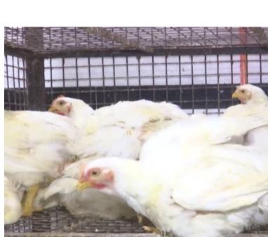
సమస్య పరిష్కారం అయ్యే వరకు బీఆర్ఎస్ పూర్తి అందగా ఉంటుందని భరోసా ఇచ్చారు. మార్కెట్ పెంచకుండా పాల్గొనే కంపెనీలు తాత్కాలికం చేస్తున్న దృష్ట్యా అవసరమైతే చికెన్ అమ్మకం దారుల ప్రత్యేక కార్యచరణకు బీఆర్ఎస్ కార్యనిర్వాహక అధ్యక్షుడు కేటీఆర్ హాజరవుతారని ఎమ్మెల్యే హామీ ఇచ్చారు. పాల్గొనే కంపెనీలు స్పందించాలి : పాల్గొనే కంపెనీలు సానుకూలంగా స్పందించాలని చికెన్ వ్యాపారులు కోరారు. కిలో చికెన్పై రూ.40 మార్కెట్ ఇవాల్సాన్ని. పాల్గొనే కంపెనీలు కావాలి. తక్షణమే తమ ప్రతినిధి బృందాన్ని చర్చలకు పిలిచి శాంతియుతంగా డిమాండ్లు అంగీకరించాలని కోరారు. "1.8 శాతం ఇచ్చే మార్కెట్? ను తగ్గించటం వల్ల మాకు గిట్టుబాటు కావాలి లేదు. కోళ్లను తేవటానికి ట్రావెలింగ్ ఖర్చు, షాపు రెంట్లు, వర్కర్ల జీతాలు పోనీ కనీస లాభం కూడా మిగలటం లేదు. పాల్గొనే కంపెనీలు సానుకూలంగా స్పందించాలి. కిలో చికెన్పై రూ.40 మార్కెట్ ఇవాల్సాన్ని. పాల్గొనే