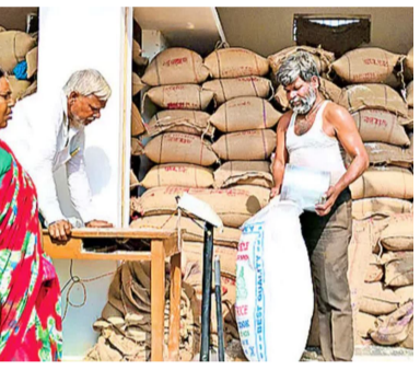
ఆ లెక్కన నలుగురు సభ్యులు ఉన్న కుటుంబానికి ఒకేసారి 72కిలోల బియ్యం పంపిణీ చేయనున్నారు. ఒక్కొక్కరి వేలిముద్ర మూడు సార్లు.. ఒకేసారి మూడు నెలల బియ్యం ఇవ్వనున్న నేపథ్యంలో లబ్ధిదారులు ఈ షోప్ మెషిన్లో మూడు సార్లు వేలిముద్ర వేయాల్సి ఉంటుంది. దాంతో ఒక్కో వినియోగదారుడికి బియ్యం ఇవ్వడానికి సమయం కాస్త ఎక్కువ పడుతుంది. దీనిని దృష్టిలో పెట్టుకుని లబ్ధిదారులు తమకు సహకరించాలని రేషన్ డీలర్లు కోరుతున్నారు. బాలాపూర్ మండలంలో 2,324 మెట్రిక్ టన్నుల బాలాపూర్ మండలంలో మొత్తం 35,487 మంది సన్నబియ్యం లబ్ధిదారులు ఉన్నారు. సదరు కార్యదారులకు మూడు నెలలకు కలిపి మొత్తం 3,324.226 మెట్రిక్ టన్నుల బియ్యం అవసరం. ఏప్రిల్ నెలాఖరుదాకా బియ్యం పంపిణీ చేస్తాం.

హైదరాబాద్: వేసవి దృష్ట్యా ఒకేసారి మూడు నెలల రేషన్ బియ్యాన్ని లబ్ధిదారులకు పంపిణీ చేయాలని ప్రభుత్వం నిర్ణయించింది. ఈ నేపథ్యంలో మహాత్మ్యం నియోజకవర్గంలోని బాలాపూర్ మండల పరిధిలో గల అల్పాస్థిగూడ, గుండగూడ, నాదర్ గల్, బదం గోపేట్, జలేపల్లి, మోమిడిపల్లి, బాలా పూర్, కుర్నల్ గూడ, వెంకటాపూర్ తదితర గ్రామాల్లోని రేషన్ షాపుల ద్వారా సన్నబియ్యం పంపిణీకి అధికారులు, డీలర్లు సన్నద్ధం చేయనున్నారు. అవసరమైన బియ్యం నిల్వలు ఉన్నందున డీలర్లు తమ షాపులకు తీసుకెళ్లాలని ఇప్పటికే జిల్లా స్థాయి సివిల్ సప్లయ్ అధికారులు ఆదేశించారు. ఈ మేరకు డీలర్లు తమ షాపుల పరిమాణాన్ని బట్టి బియ్యం రైట్ పెట్టుకున్నారు. ఏప్రిల్ 1వ తేదీ నుంచి నెలాఖరుదాకా ఈ పంపిణీ కార్యక్రమం కొనసాగనున్నది. ప్రభుత్వం డీలర్లకు దశల వారీగా బియ్యం సరఫరా చేయనున్నది. ఒక్కొక్కరికి 18కిలోలను స్తుతం చేసేవారులు ఉన్న లబ్ధిదారుల్లో ఒక్కొక్కరికీనెలకు 6కిలోల కొద్దిన బియ్యం పంపిణీ చేస్తున్నారు. నలుగురు సభ్యులు ఉన్న కుటుంబానికి నెలకు 24కిలోలు ఇప్పిస్తారు. కాగా ఏప్రిల్లో మూడు నెలల బియ్యం ఒకేసారి పంపిణీ చేయనున్న నేపథ్యంలో ఒక్కో వినియోగదారుడికి 18కిలోలు ఇప్పిస్తున్నారు.