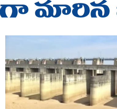
ఏడాది మరమ్మతులు ప్రారంభించే పరిస్థితి పునరుద్ధరణ అనేది ప్రశ్నార్థకంగా మారింది. గత సంవత్సరం ఏప్రిల్లో ఎన్టీఎస్ఐ మేడిగడ్డ, అన్నారం, సుందర్ల బ్యారేజీల పునరుద్ధరణ, మరమ్మతులపై ఓ నిర్ణయానికి వచ్చేందుకు అవసరమైనట్టువంటి పలు పరీక్షలను చేయించాలని సంబంధిత అధికారులకు సూచించింది. మేడిగడ్డ బ్యారేజీ ఏడో బ్లాక్ను

కాశీశ్వరం : తెలంగాణలో రాష్ట్రంలో కీలకంగా మారిన కాశీశ్వరం ప్రాజెక్టు మరమ్మతు పనులు ముగింపు జాప్యం కానున్నాయి. ఇప్పటికే ప్రాజెక్టుకు సంబంధించిన పరీక్షలు పూర్తి కాలేదు. ముఖ్యమైన పరీక్షలను ఈ ఏడాది పర్యాకాలం సీజన్లోగా చేయాలని ఎన్టీఎస్ఐ (నేషనల్ డ్యూటీ ఫౌండేషన్) సూచించినప్పటికీ ఎలాంటి పురోగతి లేకుండా పోయింది. మేడగడ్డ బ్యారేజీ 7 బ్లాక్లను సైబిలైజ్డ్ పై ఎలాంటి అడుగు ముందుకు పడలేదు. ఇక బ్యారేజీల పునరుద్ధరణ పనులు ప్రశ్నార్థకంగా మారిన న్నాయి. కాశీశ్వరం మరమ్మతు పనుల్లో జాప్యం : కాశీశ్వరం బ్యారేజీల మరమ్మతులకు సంబంధించిన పరీక్షలు ముగింపు అలసత్వమయ్యే స్థాయి వరకు కలిపిస్తున్నాయి. ముఖ్యమైన పరీక్షలను ఈ ఏడాది వానాకాలంలో పూర్తి చేయాలని ఎన్టీఎస్ఐ సూచించింది. పూర్తయిన పరీక్షలు, ఇంకా పెండింగ్లో ఉన్నవి తదితర విషయాలు పరిగణనలోకి తీసుకోంటే ఈ ప్రభుత్వం రికార్డు సృష్టించింది.