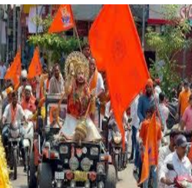
మట్టింపులు చేపట్టాలని అధికారులను ఆదేశించారు. సోషల్ మీడియాలో రెచ్చగొట్టే షోషలిస్టు పెడితే కఠిన చర్యలు తీసుకుంటామని హెచ్చరించారు. సమావేశం అనంతరం గౌరీగూడ రామమం దిన్నా దర్శించుకున్న సీటీ సజ్జనార్ అక్కడి నుంచి తాడిబండ్ హనుమాన్ దేవాలయం వరకు ఉన్న 12 తగిన జాగ్రత్తలు పాటించాలని, ట్రాఫిక్ ఇబ్బందులు కలగకుండా ముందున్న

హైదరాబాద్ సీటీ: నగరంలో ఏప్రిల్ 2న హనుమాన్ శోభాయాత్ర ప్రశాంతంగా జరిగేందుకు అన్ని ఏర్పాట్లు చేసినట్లు సీటీ పోలీస్ కమిషనర్ వీసీ సజ్జనార్ తెలిపారు. కోరిలోని ఉస్మానియా మెడికల్ కాలేజీ ఆడిటోరియంలో మంగళవారం వివిధ ప్రభుత్వ శాఖల అధికారులు, ఉత్తమ నిర్వాహకులతో సమన్వయ సమావేశం నిర్వహించారు. ఈ సందర్భంగా సీటీ మాట్లాడుతూ ప్రధాన యాత్రలో సుమారు 168 శోభాయాత్రలు కలవనున్న నేపథ్యంలో అవాంఛనీయ ఘటనలు చోటుచేసుకోకుండా సుమారు 3,000 మంది పోలీసు సిబ్బందితో పటిష్ట బందోబస్తు నిర్వహిస్తున్నామన్నారు. యాత్ర నిర్వహణలో పలంబీర్లకు తగిన శిక్షణ ఇచ్చి, రోప్ పాల్సీ సభ్యులను అధిక సంఖ్యలో ఏర్పాటు చేసుకోవా లని నిర్వాహకులకు సీటీ సూచించారు. పై ఓవర్లు, రైల్వే బ్రిడ్జిల వద్ద తగిన జాగ్రత్తలు పాటించాలని, ట్రాఫిక్ ఇబ్బందులు కలగకుండా ముందున్న