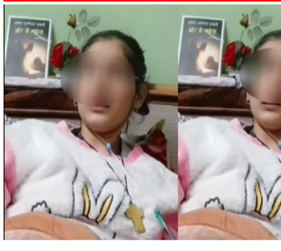
హిమాచల్ ప్రదేశ్: హిమాచల్ ప్రదేశ్ లోని ధర్మశాలలో ఓ విషాదకర ఘటన చోటుచేసుకుంది. ప్రభుత్వ డిగ్రీ కళాశాలలో