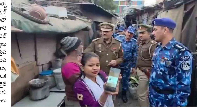
పోస్ట్ స్కాన్ చేశారు. అతడి వీపు వెనుక మొబైల్ ఫోన్ మరకొందరు డిమాండ్ చేశారు. ఆ వ్యక్తి బంగ్లాదేశీయుడో కాదో అన్నది మొబైల్

లక్నో: పోలీసులు ఒక ప్రాంతానికి వెళ్లారు. పౌరసత్వ ధృవీకరణ డ్రైవ్ సందర్భంగా ఒక వ్యక్తిని మొబైల్ ఫోన్ తో స్కాన్ చేశారు. అతడు బంగ్లాదేశీయుడో కాదో అన్నది ఆ పరికరం గుర్తిస్తుందని పోలీస్ అధికారి అన్నారు. ఈ వీడియో క్లిప్ సోషల్ మీడియాలో వైరల్ అయ్యింది. ఈ నేపథ్యంలో పోలీసుల తీరుపై విమర్శలు వెల్లువెత్తాయి. దేశ రాజధాని ఢిల్లీ శివారు ప్రాంతమైన ఉత్తరప్రదేశ్ లోని ఘజియాబాద్ లో ఈ సంఘటన జరిగింది. డిసెంబర్ 23న కొందరు పోలీసులు, భద్రతా సిబ్బంది కలిసి నిర్బంధ వాహనంలో ఒక ప్రాంతానికి వెళ్లారు. అక్కడ పౌరసత్వ ధృవీకరణ డ్రైవ్ చేపట్టారు. ఆ ప్రాంతంలో నివసిస్తున్న కుటుంబాలకు చెందిన వ్యక్తుల ఆధార వివరాలు, ఇతర ప్రశ్నలు పరిశీలించారు.