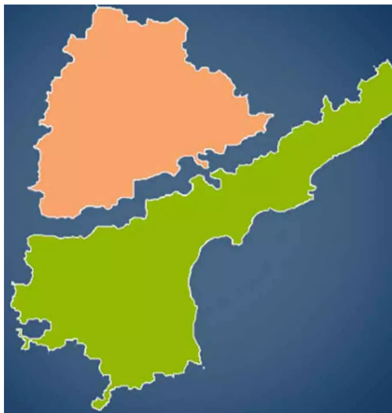
తీస్తున్నారు. వెనుకబడిన ప్రాంతాలకు నిధులు, పోలవరం ప్రాజెక్టు నిర్మాణం పునరావాసం వంటివి జవాబులేని ప్రశ్నలుగానే మిగిలాయి. ఈ వైఫల్యాలను ప్రశ్నించి, ప్రజలకు న్యాయం కోసం

నూతన సంవత్సరానికి స్పష్టమైన హెచ్చరికగా నిలుస్తున్నాయి. అసమానతలు ప్రమాదకర స్థాయికి చేరడం, నిరుద్యోగం తీవ్రమవ్వడం, కార్పొరేట్ దురాశలతో ప్రజల జీవనాధారాలు కుదేలవడం, పాలకుల రాజకీయాలు కార్పొరేట్ల లాభాల ఆశలతో జత కలవడం ఇవన్నీ గత ఏడాది సాధారణ ప్రజల జీవితాన్ని నేరుగా ప్రభావితం చేసిన అంశాలు. దేశ సంపదలో నలభై శాతం కేవలం ఒక్క శాతం మంది వద్ద కేంద్రీకృత మవ్వడం, మరోవైపు కోట్లాది మంది కూడు, గూడు, గుడ్డ, విద్య-వైద్యం వంటి మౌలిక అవసరాలు కూడా తీరని దుస్థితి నెలకొంది. ఈ సమస్యలను పరిష్కరించాలి పాలకులు దానికి భిన్నంగా తమ పాలన సాగిస్తున్నారు. విద్య, ఉపాధి రంగాలు అత్యంత దయనీయ స్థితికి చేరాయి. ఇప్పటివరకు అంతో, ఇంతో విశ్వాసం పొందిన న్యాయ వ్యవస్థ గత కాలపు ఖ్యాతి మనకబారతుండటం అందోళనకర పరిణామం. నూతన విద్యావిధానం పేరుతో మూతబడిన బడులు మళ్లీ తెరుచుకోవాలని, చరిత్ర, విజ్ఞానశాస్త్రాలను పెంపొందించాలని, విద్యారంగం శాస్త్రీయ భావనలతో కొత్త పుంతలు తొక్కాలని, వేయి ఆలోచనలు వికసించి భావి తరాల ప్రగతికి బాటలు వేయాలని ప్రజలు కోరుకుంటున్నారు. ప్రజల జీవనోపాధికి గ్యారంటీ ఇచ్చే ఉద్యోగ, ఉపాధి రంగాలు కొత్త సంవత్సరంలోనైనా పూర్తిస్థాయిలో విరాజిల్లాలన్నది ప్రజల ఆకాంక్ష! గణాంకాల మాయాజాలం కాకుండా, తమ గౌరవాన్ని కాపాడే నిజమైన అభివృద్ధి జరగాలని ప్రజలు కోరుకుంటున్నారు. ఆర్థిక సంస్కరణలతో ఇప్పటికే అరకొరగా మారిన కార్మిక హక్కులను లేబర్ కోర్ట్లతో పూర్తిగా దిగమింగడానికి ప్రభుత్వం సిద్ధమైంది. ఎపి రాజధాని అమరావతి నగర నిర్మాణం ఇంకా భూమి చుట్టే తిరుగోతంది. రెండేళ్లు కావస్తున్నా ఉన్న భూమి తో సరిపెట్టుకోకుండా రియల్ ఎస్టేట్ వైపు చంద్రబాబు పరుగులు