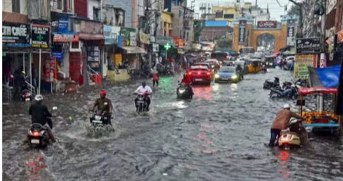
హైదరాబాద్, ఫిబ్రవరి 3: టైఫాయిడ్ మరణాల్లో దేశంలోనే తెలంగాణ రెండో స్థానంలో ఉండటం ఇప్పుడు పెను సంచలనంగా మారింది. దేశంలో టైఫాయిడ్తో ప్రాణాలు విడిచే ప్రతి ఐదుగురిలో ఒకరు తెలంగాణకు చెందిన వారు అని ఆ నివేదిక వెల్లడించింది. 2023లో దేశంలో మొత్తం 1,075 మంది టైఫాయిడ్ కారణంగా చనిపోగా.. అందులో 202 మరణాలు ఒక్క తెలంగాణలోనే

● 202 మరణాలతో తెలంగాణ రెండో స్థానం ● దేశ వ్యాప్తంగా మొత్తం 1,075 మంది మృతి