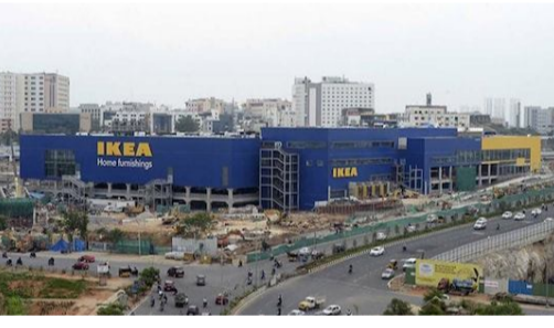
చిన్ మున్సిపల్ అడ్మినిస్ట్రేషన్, అర్బన్ డెవలప్ మెంట్ శాఖ కీలక నిర్ణయం తీసుకుంది. హైదరాబాద్ లోని రాయదుర్గ్-టీ హాల్ వద్ద కొత్త స్పెషియల్ నిర్మించేందుకు ప్రతిపాదనలు సిద్ధం చేసింది. స్పెషియల్ రైడ్.. ఆ రూట్ లో ట్రాఫిక్ సమస్యలకు చెక్.. దూసుకెళ్లిపోవచ్చు హైదరాబాద్ లోని రద్దీగా ఉండే ఐటీ కారిడార్ లో ట్రాఫిక్ సమస్యలు, పాదచారుల భద్రత, మరలత సౌకర్యంగా నడిచి వెళ్లడం కోసం ఈ స్పెషియల్ నిర్మించనున్నట్లు

హైదరాబాద్: ఐటీ హబ్ గా దూసుకెళ్తున్న హైదరాబాద్ లో రోజు రోజుకూ జనాభా భారీగా పెరిగిపోతోంది. ఐటీ కారిడార్ లో నిత్యం లక్షల మంది టెక్నికల్ రాకపోకలు సాగిస్తున్నారు. దీంతో ఉదయం, సాయంత్రం ఆ మార్గాల్లో ట్రాఫిక్ జామ్లు ఏర్పడు తున్నాయి. ఈ ట్రాఫిక్ ను తగ్గించేందుకు ప్రభుత్వం.. షేడర్లు, అందర్లపానిలు, రోడ్డు విస్తరణ పనులను ఎప్పటికప్పుడు చేపడు తూనే ఉంది. అయినప్పటికీ జనం, వాహనాల రద్దీ.. సగరం లో జనం ట్రాఫిక్ ఇబ్బందులు పడుతూనే ఉన్నారు. అదే సమయం లో ట్రాఫిక్ సమయంలో పాదచారులు నడిచేందుకు, రోడ్డు దాటేందుకు కూడా చాలా కష్టంగా మారతోంది. ఈ నేపథ్యం లోనే ప్రభుత్వం రద్దీగా ఉండే కీలక ప్రాంతాల్లో స్పెషియల్ సులూషన్ ఏర్పాటు చేస్తోంది. విశాఖపై రోడ్డు దాటలేక ఇబ్బంది పడేవారికి.. ట్రాఫిక్ ఉన్న సమయంలో.. పాదచారులు ఈ స్పెషియల్ సులూషన్ ఉపయోగించి.. సులువుగా గమ్యాన్ని చేరుకోవచ్చు. ఇప్పటికే సగరంలోని ప్రధాన కూడళ్లు, కీలక ప్రాంతాల్లో ఏర్పాటు చేసిన స్పెషియల్ సులూషన్ పార్కులను పార్కుల వ్యక్తం చేస్తున్నారు. ఈ నేపథ్యంలోనే తెలంగాణ ముఖ్యమంత్రి రేవంత్ రెడ్డికి సంబంధి