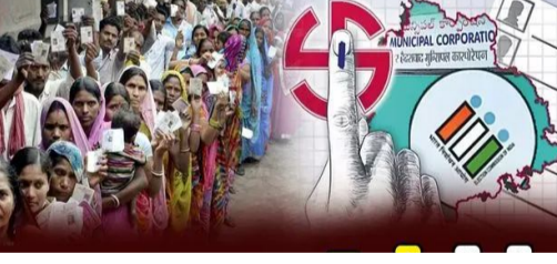
రూ. 4లక్షల వరకు, గ్రేడ్ 1 మున్సిపాలిటీలకు రూ. 5లక్షల వరకు అభ్యర్థులు ఖర్చు చేయవచ్చు. వీటిని ఖర్చు కింద లెక్కిస్తారు. షేక్సీలు, బ్యానర్లు, వాహనాల అద్దె, మైక్ లేదా డిజీ, సభలు, సమావేశాల నిర్వహణ, సో షల్ మీడియా ప్రచారం, కార్యకర్తలకు భోజనాలు, తాగునీరుపై పెట్టిన వ్యయాలన్నిటినీ

హనుమంతం, ఫిబ్రవరి 2 : మున్సిపల్ ఎన్నికల్లో పోటీకి అభ్యర్థులు దాఖలు చేసిన నామినేషన్లపై అభ్యంతరాల పరిశీలన, పరిష్కారం సోమవారం జరిగింది. మంగళవారం ఉపసంహరణలకు వివరి తేదీ. నేడు మధ్యాహ్నం 3 గంటల తర్వాత పోలీస్ ఉన్న అభ్యర్థుల తుది జాబితాను ప్రకటిస్తారు. పోలింగ్ తేదీ ఈనెల 11న (మంగళవారం) నుంచి ఎన్నికల ప్రచారంపై అభ్యర్థులు చేసే ఖర్చు లెక్కింపు అధికారికంగా అమలులోకి వస్తుంది. ఎన్నికల ప్రచారానికి గడువు వారం రోజులే. అభ్యర్థుల ఎన్నికల ప్రచారం ఖర్చు పరిమితి, ఎన్నికల అధికారుల లెక్కింపు ఎలా ఉంటుందో చూద్దాం. ఖర్చు పరిమితిపాటి అభ్యర్థి అయినా, స్వతంత్ర అభ్యర్థి అయినా ఇద్దరికీ ఖర్చు పరిమితి ఒకేలా ఉంటుంది. సగర పంచాయతీలకు రూ. 2లక్షలు, గ్రేడ్ 3 మున్సిపాలిటీలకు రూ. 3లక్షల వరకు, గ్రేడ్ 2 మున్సిపాలిటీలకు