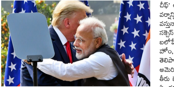
అమెరికాకు అత్యంత ఆదరణం భారత్. దానితో వాణిజ్య అవరోధాలు తొలగినందుకు సంతోషంగా ఉంది. ఇండో-పసిఫిక్ ప్రాంతంలో చైనాను ఎదుర్కోవడానికి అమెరికాకు భారత్ సహాయం అవసరం. కొత్త డీల్ తో భాగంగా అమెరికా చమురును భారత్ కొంటుంది. రష్యాతో చమురు అనుబంధాన్ని తగ్గిస్తుంది. దీనివల్ల ఉక్రెయిన్ తో రష్యా యుద్ధాన్ని ఆపొచ్చు' అని పేర్కొంటూ అమెరికా సెనెట్ విదేశీ వ్యవహారాల కమిటీ చైర్మన్ జిమ్ రిస్స్ ట్వీట్ చేశారు. ఈ డీల్ అమెరికా రైతులకు కలిసొస్తుంది! 'ఇకపై భారత్ కు మరొక వ్యవసాయ ఉత్పత్తులను అమెరికా రైతులు ఎగుమతి చేయొచ్చు. అతిపెద్ద భారత మార్కెట్ వల్ల గ్రాహిణ అమెరికాకు ఆర్థిక ప్రయోజనం చేకూరుతుంది. జనాభా పెరుగుతుండటం అనే అంశం భారత మార్కెట్ ను మరింత ఆకర్షణీయంగా మారుస్తోంది. కొత్తగా కుదిరిన ట్రేడ్ డీల్ అమెరికాకు ప్రయోజనకరం. ప్రత్యేకించి మా వ్యవసాయ రంగానికి కలిసిస్తుంది. 2024 ఆర్థిక సంవత్సరంలో భారత్ తో ట్రేడ్ చేసి 1.3 బిలియన్ డాలర్ల వాణిజ్య లోటును అమెరికా ఎదుర్కొంది. ఇకపై ఈ లోటు తగ్గుతుంది' అని అమెరికా వ్యవసాయ శాఖ మంత్రి బ్రూక్ రోలిన్స్ పేర్కొన్నారు. ట్రంప్ 'డీల్ మేకర్ ఇన్ చీఫ్' భారత్ తో అమెరికా ట్రేడ్ డీల్ కుదురడం సంతోషకరం. ఇందుకోసం ప్రెసిడెంట్ ట్రంప్ ను 'డీల్ మేకర్ ఇన్