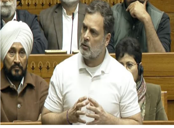
మారలేదని, నిన్న సాయంత్రం ఒప్పందం కుదుర్చుకున్నారని గాంధీ అన్నారు. నరేంద్ర మోదీపై తీవ్రమైన వత్తిడి ఉన్నట్లు రాహుల్ తెలిపారు. మోదీ ఇమేజ్ కు చెందిన బెలామీ వేల కోట్లతో తయారైందని, అది ఏ క్షణమైనా పేలుతుందని ప్రతిపక్ష నేత అన్నారు. మన ప్రధాని అమెరికా వత్తిడికి తలొగ్గిన, భారత దేశ ప్రజలు దీని గురించి ఆలోచించాలని, భారతీయ రైతులు ఆ డీల్ గురించి ఆలోచించాలని, మీ శ్రమ, రక్తం, చమురును మోడి అమ్ముతున్నారని ఆరోపించారు. కేవలం రైతులే కాదు, యావత్ దేశాన్ని అమ్మేశారని, అందుకే తనను సభలో మాట్లాడనివ్వడం లేదని రాహుల్ అన్నారు. అలాంటి సందర్భంలో జరిగిన ఘటనలపై మాట్లాడకుండా నన్నెందుకు అవుతున్నారు?' అని రాహుల్ ప్రశ్నించారు. లద్దాఖోట్ జరిగిన ఘర్షణలో మన సైనికులు ప్రాణాలు కోల్పోయారు, ఆ విషయంలో ప్రభుత్వం

న్యూఢిల్లీ: భారత్-చైనా సరిహద్దు ఉద్రిక్తతల అంశం మరోసారి లోక్ సభలో చర్చనీయాంశంగా మారింది. 2020లో లద్దాఖోట్ జరిగిన ఘర్షణలు, ఆర్మీ మాజీ చీఫ్ జనరల్ ఎంఎం నరవణి రాసిన ఆత్మకథలోని విషయాలపై విపక్ష నేత రాహుల్ గాంధీ ప్రస్తావన చేయడంతో సభలో తీవ్ర గందరగోళం నెలకొంది. అధికార, ప్రతిపక్ష సభ్యుల మధ్య వాగ్వాదం వెలరేగడంతో సభను కాన్సేప్ట్ వాయిదా వేయాలి వచ్చింది. ఆ తర్వాత బుధవారానికి లోక్ సభ వాయిదా పడింది. దేశ భద్రతకు అత్యంత కీలకం: రాహుల్ బడ్జెట్ సమావేశాల సందర్భంగా మంగళవారం మాట్లాడిన రాహుల్ గాంధీ, దేశ భద్రత అంశం తన చర్చకు కారణమని స్పష్టం చేశారు. నరవణి రాసిన ఆత్మకథకు సంబంధించిన ఒక మ్యూగజైన్ కథనాన్ని తాను ప్రచురించానని, అందులో ఉన్న విషయాలు దేశ భద్రతకు అత్యంత కీలకమని పేర్కొన్నారు. చైనా-భారత్ సరిహద్దు పరిస్థితులు, ప్రధానమంత్రి స్పందన వంటి అంశాలపై నిజాలు బయటకు రావాల్సిన అవసరం ఉందని అన్నారు. నన్నెందుకు అవుతున్నారు? రాహుల్ రాష్ట్రపతి ప్రసంగం లో జాతీయ భద్రత ప్రధానం అంశం. చైనా, పాకిస్తాన్ లతో మన సంబంధాలు దేశ భవిష్యత్తుకు కీలకం. అమెరికా, భారత్ మధ్య కుదిరిన వాణిజ్య ఒప్పందంపై ప్రతిపక్ష నేత రాహుల్ గాంధీ స్పందించారు. ప్రధాని మోదీ అమ్ముడుపోయినట్లు పేర్కొన్నారు. బ్రాంట్ వత్తిడికి మోదీ తలొగ్గినట్లు ఆరోపించారు. పార్లమెంట్ ఆవరణలో రిపోర్టర్లతో రాహుల్ మాట్లాడారు. ఎన్ డిటీ షేర్ కేసు వల్ల ప్రధాని మోదీ తీవ్ర వత్తిడిలో ఉన్నట్లు ఆరోపించారు. అదానిపై అమెరికాలో కేసు కొనసాగుతున్న నేపథ్యంలో కూడా మోదీ ఆందోళనలో ఉన్నట్లు రాహుల్ పేర్కొన్నారు. మోదీకి భయపడుతున్నారని, నాలుగు నెలలగా వాణిజ్య ఒప్పందం స్తంభించిందని, కొన్ని కారణాల తప్ప ఏమీ