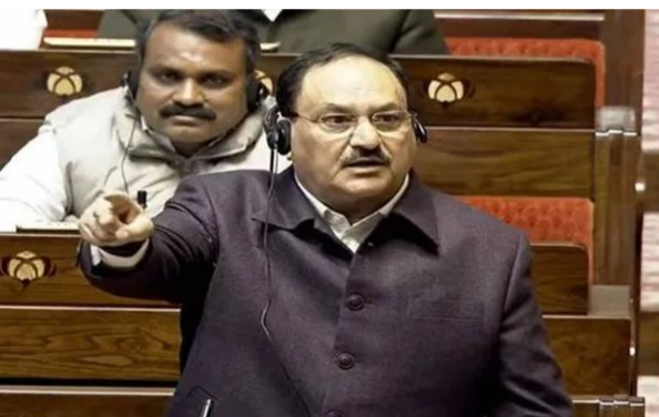
చేసేందుకు ప్రభుత్వం సిద్ధంగా ఉన్నప్పుడు కాంగ్రెస్, ఇండియా కూటమి వైఖరి బాగాలేదని తప్పుపట్టారు. ప్రజాస్వామ్యాన్ని

న్యూఢిల్లీ: భారత్-అమెరికా మధ్య ట్రేడ్ డీల్ పై కేంద్రం సుమోటో ప్రకటన చేస్తుందని కేంద్ర మంత్రి జేపీ నడ్డా (ట్రా షిప్) హామీ ఇచ్చారు. దీనిపై సభలో చర్చకు తాము సిద్ధమేనని తెలిపారు. వ్యవసాయ రంగం గురించి, రష్యా నుంచి చమురు కొనుగోలును నిలిపివేసి అంశాలపై ప్రతిపక్ష ఎంపీలు రాజ్యసభలో మంగళవారం నాడు ఆందోళన వ్యక్తం చేశారు. ట్రేడ్ డీల్ వివరాలు వెల్లడించాలని నివాదాలు చేశారు. దీంతో సుమోటో ప్రకటనకు ప్రభుత్వం సిద్ధమేనని నడ్డా సమాధానం ఇచ్చారు. సుంకాలపై అమెరికా అధ్యక్షుడు సోమవారం రాత్రి ట్వీట్ చేశారు. ప్రధానమంత్రి మోదీని తన నిజమైన మిత్రుడిగా పేర్కొన్నారు. ఆ తర్వాత ట్రేడ్ డీల్ పై అమెరికా అధ్యక్షుడికి కృతజ్ఞతలు చెబుతూ మోదీ ట్వీట్ చేశారు. ఈ ట్రేడ్ డీల్ పై ప్రభుత్వం సుమోటో ప్రకటన చేస్తుంది. దానిపై చర్చ కూడా జరుపుతుంది' అని నడ్డా తెలిపారు. సమగ్రమైన ప్రకటన