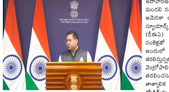
కారకాన్లోని భారత రాయబార కార్యాలయంతో నిరంతరం సంప్రదింపులే ఉండాలి తెలిపింది. మదురోను వెంటనే విడుదల చేయాలి : వెనెజువెలా అధ్యక్షుడు నికొలస్ మదురో, ఆయన భార్య సిలియా ఫోర్నెసు వెంటనే విడుదల చేయాలని అమెరికాను చైనా కోరింది. వెనెజువెలా ప్రభుత్వాన్ని కూల్చివేసే ప్రక్రియను ఆపాలని, చర్యల ద్వారా సమస్యలను పరిష్కరించాలని అమెరికాకు బీజేపీ సూచించింది. అమెరికా చర్య అంతర్జాతీయ చట్టాలు, ప్రాథమిక నిబంధనలను, బరాన్ చార్టర్ సూత్రాల్ని స్పష్టంగా ఉల్లంఘించడమేనని చైనా విదేశాంగ శాఖ తెలిపింది. లాటిన్ అమెరికా, కరీబియన్ లలో శాంతి, భద్రతలకు ముప్పు కలిగించే అమెరికా ఆధిపత్య ప్రవర్తనను చైనా గట్టిగా వ్యతిరేకిస్తుందని పేర్కొంది. అమెరికా నిర్ణయాన్ని ప్రమాదకర

రాజస్థాన్: వెనెజువెలాలో జరుగుతున్న పరిణామాలు తీవ్ర ఆందోళన కలిగిస్తున్నాయని భారత తెలిపింది. అమెరికా దాడులు, తదితర పరిణామాలను నితీతంగా పరిశీలిస్తున్నామని పేర్కొంది. వెనెజువెలా ప్రజల శ్రేయస్సు, భద్రతకు భారత్ తన మద్దతు కొనసాగిస్తుందని తాజాగా విడుదల చేసిన ప్రకటనలో వివరించింది. వెనెజువెలాలో ఇటీవల జరిగిన పరిణామాలు తీవ్రమైన ఆందోళనకు కారణమవుతున్నాయి. పరిస్థితి ఎలా మారుతుందో మేం దగ్గరగా గమనిస్తున్నాం. వెనెజువెలా సంక్షోభంలో భాగమైన అన్ని పక్షాల చర్యలు, దౌత్య మార్గాలను ఆశ్రయించాలి. వెనెజువెలా ప్రజల భద్రత, సంక్షమానికి భారత్ మద్దతు ఇస్తోంది. ప్రాంతంలో శాంతి, స్థిరత్వం నెలకొనేలా సమస్యలను సంభాషణల ద్వారా, శాంతియుతంగా పరిష్కరించుకోవాలని అన్ని పక్షాలను కోరుతున్నాం: అని విదేశాంగ శాఖ ప్రకటనలో పేర్కొంది. కారకాన్?లోని భారత రాయబార కార్యాలయం ప్రవాస భారతీయులతో సంప్రదింపులు జరుపుతోందని విదేశాంగ శాఖ పేర్కొంది. సాధ్యమైన సహాయాన్ని అందించేందుకు రాయబార కార్యాలయం సిద్ధంగా ఉందని తెలిపింది. అసవనర ప్రయాణాలు వద్దుభారతీయులకు విదేశాంగ శాఖ హెచ్చరిక జారీ చేసింది. వెనెజువెలాలో నెలకొన్న పరిస్థితుల నేపథ్యంలో, శనివారం కీలక సూచనలు జారీ చేసింది. వెనెజువెలాకు అసవనర ప్రయాణాలు పూర్తిగా నిషేధించాలని భారతీయుల పౌరులను కోరింది. అలాగే ఇప్పటికే అక్కడ ఉన్న భారతీయులు అత్యంత జాగ్రత్తగా ఉండాలని, అసవనర లేని ప్రయాణాలను తగ్గించాలని సూచించింది.