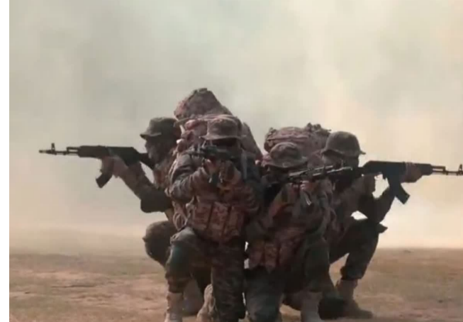
బెటాలియన్లను భారత సైన్యం నిర్ణయం చేసింది. వీటిని రెండు సరిహద్దుల్లోని (పాక్, చైనా) వివిధ కీలక ప్రాంతాల్లో మోహరించారు. భవిష్యత్తులో వీటి సంఖ్యను 25కు పెంచాలని సైన్యం లక్ష్యంగా పెట్టుకుంది. ప్రపంచవ్యాప్తంగా జరుగుతున్న యుద్ధాలను, హైటెక్ వార్ ఫేర్ల నవాక్షను దృష్టిలో ఉంచుకుని ఈ నిర్ణయం తీసుకున్నారు. సన్న ఆఫ్ ది సాయిల్, ఎడారి వీరులు ప్రస్తుతం రాజస్థాన్ ఎడారి ప్రాంతంలో ఈ దళం కఠోర శిక్షణ

రాజస్థాన్: భారత సైన్యం తన రూపురేఖలను పూర్తిగా మార్చుకుంటోంది. భవిష్యత్తులో జరిగే ఎలాంటి పరిణామాలవైనా ఎదుర్కొనేందుకు సరికొత్త అప్రకాశితో నిర్ణయమైంది. ఇందులో భాగంగా సైన్యం చరిత్రలోనే ఎప్పుడూ లేని విధంగా అతిపెద్ద మార్పును శ్రీకారం చుట్టింది. ఆధునిక యుద్ధ తంత్రంలో భాగంగా ఏకంగా లక్ష మందికి పైగా డ్రోన్ ఆపరేటర్లతో ఒక భారీ మానవ సైన్యాన్ని తయారు చేసింది. అంతేకాదు, శత్రువుల స్థావరాలను ధ్వంసం చేసేందుకు డ్రోన్లతో ఒక కొత్త స్పెషల్ ఫోర్స్ ను రంగంలోకి దింపింది. ఈ కొత్త దళం ఆధునిక సాంకేతికతతో శత్రువులను హడలెత్తించడానికి నిర్ణయం ఉంది. డ్రోన్, ఇది సామాన్య దళం కాదు ఈ కొత్త డ్రోన్లతో దళం ఏర్పాటు చేసుకో భారీ వ్యూహం ఉంది. ఇది సాధారణ దళానికి, పాపా స్పెషల్ ఫోర్స్ కు మధ్య వారధిలా పనిచేస్తుంది. ఆధునిక యుద్ధాల్లో డ్రోన్ల వినియోగం కీలకంగా మారింది. అందుకే ఈ దళంలోని ప్రతి సైనికుడికి డ్రోన్లను ఆపరేట్ చేయడంలో, వాటిని యుద్ధంలో వాడటంలో ప్రత్యేక శిక్షణ ఇచ్చారు. వీరు శత్రువుల భూభాగంలోకి చొరబడి, వారి స్థావరాలను డ్రోన్ల సాయంతో కచ్చితత్వంతో డెస్ట్రాయింగారు. అత్యంత వేగంగా, దూకుడుగా దాడులు చేయడం వీరి ప్రత్యేకత. వ్యూహాత్మక లోతుల వరకు వెళ్లి ఆపరేషన్ల చేయగల సత్తా వీరికి ఉంది. ఇప్పటికే 15 బెటాలియన్లు రెడీ ఆర్మ్ హెడ్ క్వార్టర్స్ అదేశాల మేరకు ఈ దళాల ఏర్పాటు వేగంగా జరుగుతోంది. ఇప్పటికే సుమారు 15 డ్రోన్