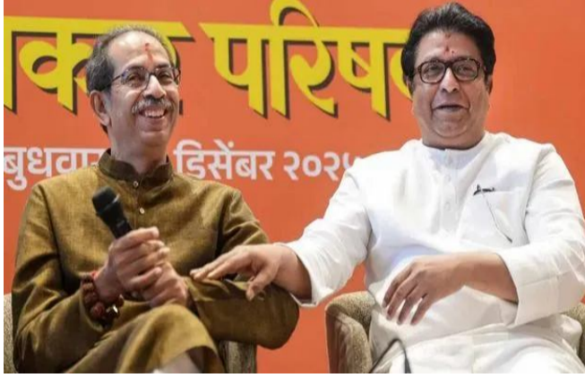
వెంటనే చర్యలు తీసుకోవాలని, ఆయనను సస్పెండ్ చేయాలని డిమాండ్ చేశారు. నేతల సెక్యూరిటీ తీసేయాలని అధికారులకు చూపించాలని అని రాజ్ అన్నారు.