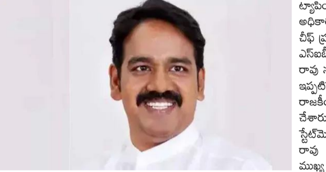
బృందం ప్రశ్నిస్తోంది. ఎక్కడెక్కడ పరికరాలు ఏర్పాటు చేసి.. ఫోన్

హైదరాబాద్, జనవరి 04: ఫోన్ ట్యాపింగ్ వ్యవహారంలో దర్యాప్తు మేగాన్ని సిట్ అధికారులు పెంచారు. ఈ కేసులో ఎమ్మెల్యే నవీన్ రావును ఆదివారం సిట్ అధికారులు విచారిస్తున్నారు. దాదాపు నాలుగు గంటలూ ఆయన విచారణ కొనసాగుతోంది. ఈ ఫోన్ ట్యాపింగ్ కేసులో ప్రత్యేక పరికరాలు (డివైజ్ లు)లు ఉపయోగించి.. అప్పటి ప్రతిపక్షనేతలు, వారి కుటుంబ సభ్యుల ఫోన్ ట్యాపింగ్ చేయించారంటూ నవీన్ రావు పై ఆరోపణలు వెల్లవెత్తాయి. అంతేకాకుండా బీఆర్ఎస్ పార్టీలో పలువురి అగ్రనేతలతో నవీన్ రావుకు దగ్గర సంబంధాలు ఉన్నట్లు సమాచారం. ఈ ట్యాపింగ్ కేసులో గత ప్రభుత్వంలో ఎన్ఐబీ అధికారులను ఈ నవీన్ రావు ఎలా ఉపయోగించుకున్నారనే అంశంపై ఆయనను సిట్ అధికారులు