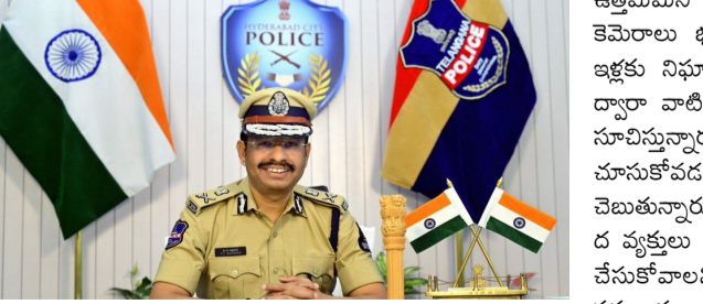
భారీగా నగరంను గానీ, బంగారు ఆభరణాలను గానీ ఉంచవద్దని సీపీ సజ్జనార్ హెచ్చరించారు. ఓ మీ విలువైన వస్తువులను బ్యాంక్ లాకర్ లో లేదా ఇతర సురక్షితమైన ప్రదేశాలలో భద్రపరచుకోండి. చిన్నపాటి ఆజాగ్రత్త దొంగలకు అవకాశంగా మారుతుంది; అని ఆయన సూచించారు. తాళం వేసి ఉన్న ఇళ్లను గుర్తించేందుకు దొంగలు కిటికీలు, గుమ్మాల వద్ద నిఘా పెడతారని అందుకే విలువైన వస్తువులు ఇంట్లో లేకపోవడమే

హైదరాబాద్, జనవరి 04: తెలుగువారి అతిపెద్ద పండుగ సంక్రాంతి వచ్చేసింది. నగరాల్లోని ఉద్యోగులు, విద్యార్థులు, వ్యాపారులు అంతా తమ సొంత ఊరకు వెళ్తుంటున్నారని ప్రయాణమవుతున్నారు. అయితే పండుగ వూరి ఇళ్లకు తాళాలు వేసి వెళ్లే వారిని లక్ష్యంగా చేసుకుని దొంగ గలు పంజా విసిరే వెళ్తున్నారంటే.. ఆ విషయాన్ని మీ పరిధిలోని పోలీస్ స్టేషన్ లో గానీ, బీట్ ఆఫీసర్ గానీ తెలియజేయాలని కమిషనర్ కోరారు. ఇలా చేయడం వల్ల పోలీసులు తమ రెగ్యులర్ పెట్రోలింగ్ లో భాగంగా మీ ఇల్లు ఉన్న వీధిపై ప్రత్యేక నిఘా ఉంచుతారని ఆయన తెలిపారు. ఆధునిక పోలీసింగ్ అంటే కేవలం నేరం జరిగినప్పుడు మాత్రం స్పందించడం మాత్రమే కాదని.. నేరం జరగకుండా ముందే నిరోధించడం కూడా అని ఆయన ఈ సందర్భంగా గుర్తుచేశారు. ప్రయాణంలో ఉన్నప్పుడు ఇంట్లో