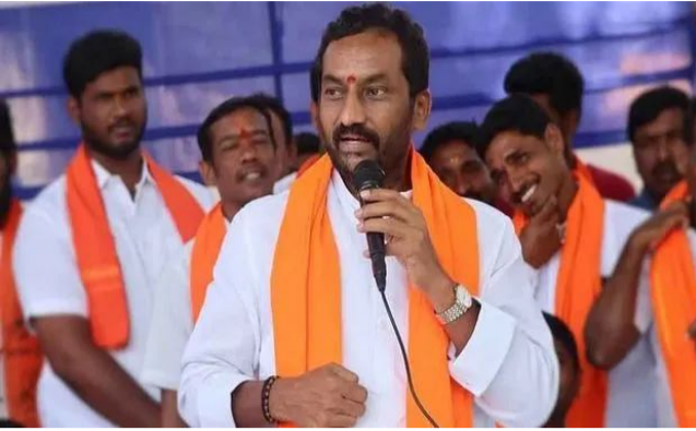
బీఆర్ఎస్, రెండేళ్ల పాలసలో కాంగ్రెస్ చేసినట్లు లేదంటూ ఆగ్రహం వ్యక్తం చేశారు. పాలమూరు బిడ్డా సీఎం రేవంత్ రెడ్డి ఏదో చేస్తాడని సమీప ప్రజలకు నిరాశే మిగిలినది వ్యంగ్యంగా అన్నారు. బీఆర్ఎస్, కాంగ్రెస్ పాలసలో రెండు పార్టీలు.. సజ్జం