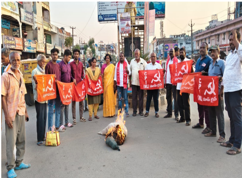
మరిచిన ట్రంపు కనీసం పాఠశాలను కూడా వదిలిపెట్టకుండా ముస్లిమ్ దాడి చేయడం ద్వారా ఒక పాఠశాలలో 185 మంది పిల్లలు అందులో 165 మంది బాలికలు మరణించడం ట్రంపు అరాచకానికి అద్దం పడుతుందని ఆయన అన్నారు. ఇంతటి