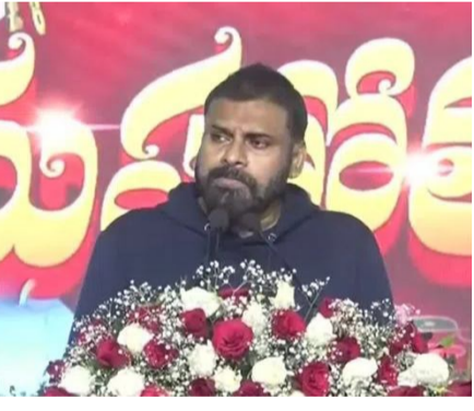
కాకినాడ, జనవరి 9 : ఏపీ డిప్యూటీ సీఎం పవన్ కళ్యాణ్ కాకినాడ జిల్లా పిఠాపురం నియోజకవర్గంలో శుక్రవారం పర్యటించారు. ఈ సందర్భంగా సుమారు రూ.3 వందల కోట్లతో చేపట్టిన వివిధ అభివృద్ధి కార్య క్రమాలకు శంకుస్థాపనలు, ప్రారంభోత్సవాలు చేశారు. ఈ సందర్భంగా పీఠికాపుర సంక్రాంతి మహోత్సవంలో ప్రజలనుద్దేశించి మాట్లాడారు. పిఠాపురం నియోజకవర్గంలో కొందరు గొడవలు సృష్టించేందుకు వస్తే ఇక్కడే తాను తిప్పవేసి ఏరి పారేస్తానని హెచ్చరించారు. మిగతా2లో...

అవాస్తవాలు వైరల్ చేస్తూ చూస్తూ ఊరుకోమని శాంతిభద్రతల విషయంలో పోలీసులు కలిసంగా ఉండాలి పట్టణ పాలిశుద్ధ్యంపై మున్సిపల్ సిబ్బంది త్రడ్డ పెట్టాలి పీఠికాపుర సంక్రాంతి మహోత్సవాలు ప్రారంభించిన పవన్ కళ్యాణ్ సంక్రాంతి అందరి పండగగా జరుపుకోవాలని పిలుపు