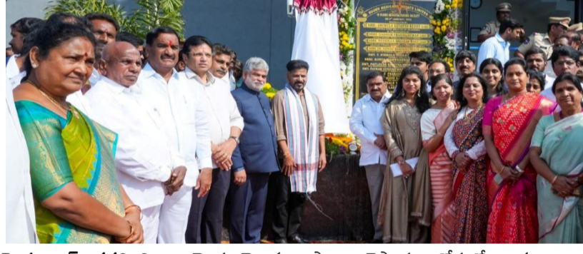
హైదరాబాద్, జనవరి 9 : రెండు తెలుగు రాష్ట్రాల మధ్య వివాదాలు ఉండకూడదనే కాంగ్రెస్ తెలంగాణ ఇచ్చిందని సీఎం రేవంత్ రెడ్డి అన్నారు. రాజకీయాలకు అతీతంగా నీళ్ల సమస్యను పరిష్కరించు కోవాలని