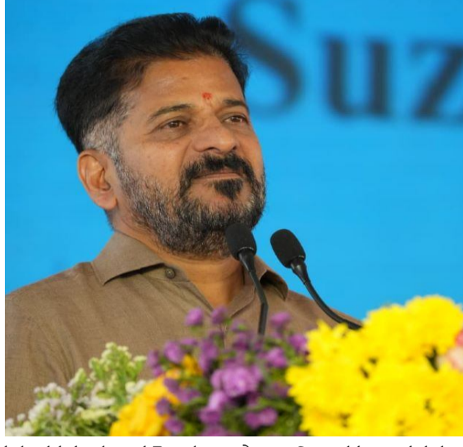
ప్రయోజనం పొందాలని తమ ప్రభుత్వం ప్రయత్నించడం లేదని స్పష్టం చేశారు. పంచాయతీ కావాలా.. నీళ్లు కావాలా.. అని నన్ను అడిగితే తెలంగాణకు నీళ్లే కావాలని