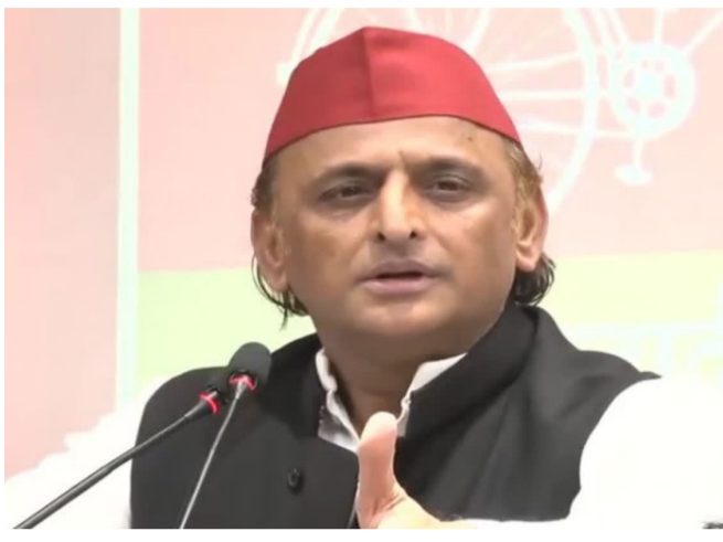
తుల పల్ల స్థానిక పరిశోధనా సంస్థలు, గ్రామీణ జీవనోపాధి ఇప్పుడు అమెరికాకు ఇచ్చారు' అని అఖిలేష్ యాదవ్ అన్నారు.

న్యూఢిల్లీ భారత్- అమెరికా మధ్య కుదిరిన వాణిజ్య ఒప్పందం విషయంలో కేంద్రంపై సమాజ్ వాదీ పార్టీ అధినేత అఖిలేష్ యాదవ్ తీవ్ర విమర్శలు చేశారు. ప్రభుత్వం భారత్ మార్కెట్ను కేంద్రం అమెరికాకు అప్పగించిందని, అలాగే 'మేక్ ఇన్ ఇండియా' స్ఫూర్తిని వదిలేసిందని ఆరోపించారు. ఓ వార్షిక సంవత్సరం మాట్లాడుతూ ఈ మేరకు వ్యాఖ్యలు చేశారు. బీజేపీ ప్రాథమిక ఆర్థిక అంశాలపై చర్చించాలనుకోవడం లేదు. మీరు(బీజేపీ) అమెరికాకు 500 బిలియన్ల డాలర్ల విలువైన భారత్? మార్కెట్ను అప్పగించారు. మీ 'మేక్ ఇన్ ఇండియా' సింహం తుప్పు పట్టిపోయింది. ఇది వీరే సావర్భౌమ్యం చర్చించే సమయం కాదు. అలా చేస్తే చరిత్రలోని అనేక పేజీలు తిరగిపోయాయి. ఇక ఈ బడ్జెట్ అమెరికా కోసం చేసారా? లేదా భారత్ కోసం రూపొందించారా? ప్రతి విమానాశ్రయంలో మీరు చిరుధాన్యాల ప్రకటనలు పెడుతున్నారు. కానీ అది సమయంలో వాటిని విదేశాల నుంచి దిగుమతి చేసుకుంటున్నారు. మనం మన జంతువులకు కూడా తిండి పెట్టలేమా? అని అఖిలేష్ యాదవ్ ప్రశ్నించారు. పశుగ్రామం దిగుమతులపై ఆందోళనపడుతూ దిగుమ