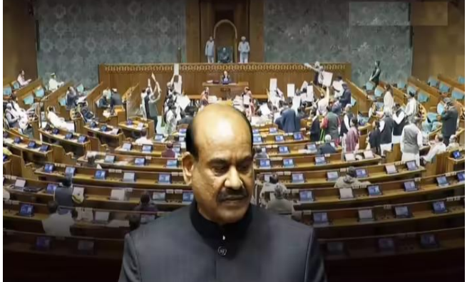
బీజేపీ ఎంపీ నిషికాంత్ దూబేపై స్పీకర్ ఎలాంటి చర్యలు తీసుకోలేదని, ఆయన పట్ల పక్షపాతంగా వ్యవహరిస్తున్నారని చెప్పుకోస్తున్నారు. ప్రతిపక్ష నేత ఖర్గేకు రాజ్యసభలో ప్రసంగించే అవకాశం దక్కకపోవడంతో విపక్షాలు సభ నుంచి వాకౌట్ చేశాయి. అటు లోక్ సభలోనూ విపక్షాల నిరసనలతో సభ

న్యూఢిల్లీ: రాజధానిలో ఐడ్యేట్ సమావేశాల వేదిక రాజకీయ ప్రకాశనలు సృష్టిస్తోంది. లోక్ సభలో తమ గొంతు నాక్కుస్తున్నారని, ప్రతిపక్ష నేతలకు మాట్లాడే అవకాశం ఇవ్వడం లేదని ఆరోపిస్తూ.. స్పీకర్ ఓం బిర్లాపై అవిశ్వాస తీర్మానం ప్రవేశ పెట్టేందుకు విపక్ష 'ఇండియా' కూటమి గట్టిగా యోచిస్తోంది. పార్లమెంటులో చరిత్రలో స్పీకర్ పైనే ఇలాంటి తీర్మానం తీసుకురావాలని చూడటం అత్యంత అరుదైన పరిణామం కాగా.. అంతా ఆసక్తిగా గమనిస్తున్నారు. విపక్షాల ప్రధాన ఆరోపణలు ఇవే.. విశ్వసనీయ వర్గాల సమాచారం ప్రకారం.. సోమవారం ఉదయం కాంగ్రెస్ అధ్యక్షుడు మల్లికార్జున్ ఖర్గే కార్యాలయంలో జరిగిన సమావేశంలో ఈ మేరకు నిర్ణయం తీసుకున్నారు. ఈ ఘోషణ తీవ్రంగా, దీవెనకే, సమాజ్ వాదీ పార్టీ, ఆర్డీ, శివసేన (యూబీడి) వంటి ప్రధాన వ్యక్తులు పాల్గొన్నారు. అయితే విపక్షాలు స్పీకర్ పై మందిపడటానికి ప్రధానంగా మూడు కారణాలు కనిపిస్తున్నాయి. అందులో మొదటిది రాష్ట్రపతి ప్రసంగానికి ధన్యవాదాలు తెలిపే తీర్మానంపై చర్చ సందర్భంగా ప్రతిపక్ష నేత రాహుల్ గాంధీని మాట్లాడనివ్వకుండా స్పీకర్ అడ్డుకున్నారని విపక్షాలు ఆరోపిస్తున్నాయి. అంతేకాకుండా కాంగ్రెస్ ఎంపీలు, మహిళా నేతలను కించపరిచేలా మాట్లాడిన