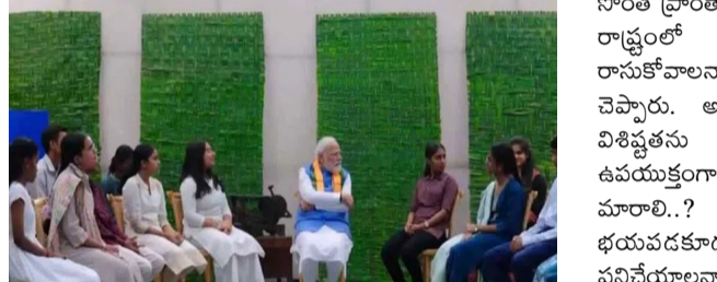
సాంకేతికత మన పనిచేసే విధానాన్ని మారుస్తుందని చెప్పారు. దాన్ని సరిగ్గా వినియోగించుకుంటే ఏజెంట్ విద్యార్థులు భయపడతారు. పనిలేదన్నారు. బెకాబ్రాజీతో ఎలా పనిచేయాలన్నది నేర్చుకోవడం చాలా ముఖ్యమని చెప్పారు. జీవితంలో ఏదీ సులువుగా ఉండదన్నారు. విద్యార్థులకు ఐదు ట్రావెల్ డెస్టినేషన్స్ చెప్పండి..? అని అడుగగా.. ముందు మన

న్యూఢిల్లీ: సాంకేతికత మన పనిచేసే విధానాన్ని మారుస్తుందని, దాన్ని అర్థం చేసుకుని అవసరానికి తగినట్లుగా వినియోగించుకోవాలని ప్రధాని నరేంద్ర మోదీ చెప్పారు. అంతేగానీ సాంకేతికతే మిమ్మల్ని బానిసలుగా మార్చుకునే పరిస్థితికి వెళ్లొద్దని సూచించారు. 'పరీక్షా పే చర్చ' రెండో ఎడిషన్లో భాగంగా పలువురు విద్యార్థులతో ప్రధాని మాట్లాడారు. ఈ సందర్భంగా కెరీర్ పురోగతికి సంబంధించి వారికి విలువైన సూచనలు చేశారు. విద్యార్థులు వెలివిచ్చిన సందేహాలకు సమధానాలు ఇచ్చారు. క్రమశిక్షణ, ప్రేరణ ఈ రెండింటిలో ఏది ముఖ్యం? అన్న ప్రశ్నకు, ఆ రెండింటినీ పోల్చుకొనడం అన్నారు. ఎంత స్వార్థి పొందినా ఆవరణలో క్రమశిక్షణ లేకపోతే సత్ఫలితాలు పొందలేరని అన్నారు. సమయపాలన, స్థిరత్వం, స్వీయ క్రమశిక్షణే మన ప్రేరణను అర్థంపెంచే మార్గం మారుస్తుందని చెప్పారు. ఏజెంట్ ఉద్యోగాలు పోతాయని భయాలు నిజమేనా? అన్న ప్రశ్నకు