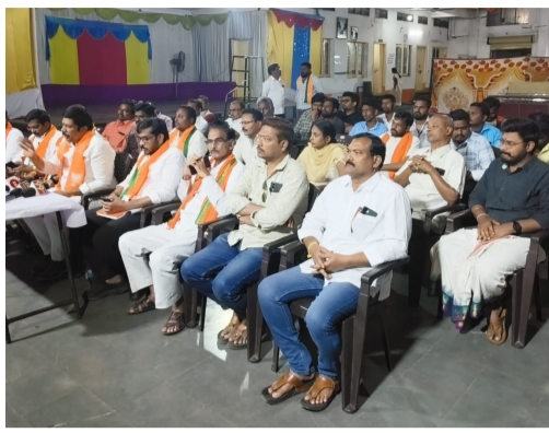
ఉభయతరకంగా ఉంటుంది ఆయన విశ్లేషణ.

సమయంలోగా ఉపాధి కల్పించకపోతే నిరుద్యోగ భత్యం ఇవ్వడమే కాకుండా, ఒకవేళ వేతనాలు చెల్లించడంలో జాప్యం జరిగితే అదనపు పరిహారం కూడా చెల్లించేలా చట్టంలో కఠిన నిబంధనలు పొందుపరచామని ఆయన వెల్లడించారు. పేదవాడి కష్టానికి తగిన ప్రతిఫలం సకాలంలో అందాలన్నదే మోదీ గారి సంకల్పమని ఆయన గుర్తు చేశారు.