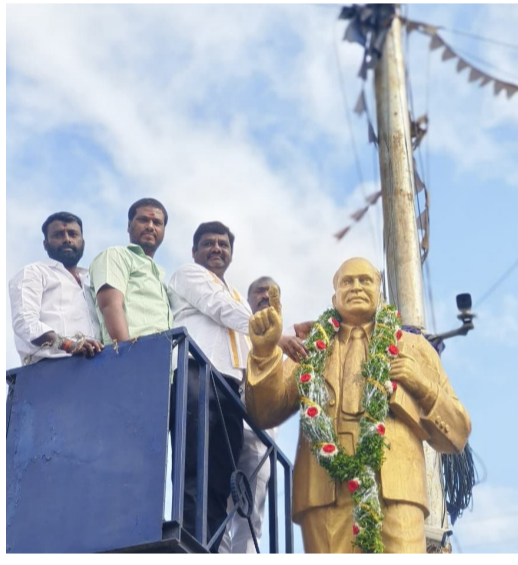
మేడ్చల్ జిల్లా కీసర సర్కార్ జనవరి 11 ప్రతినిధి

- అణగారిన వర్గాలకు సమానత్వం అందించిన మహనీయుడు అంబేద్కర్: శ్రద్ధ, స్మార్తి కళాశాల అండ్ మధ్య