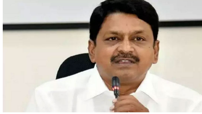
అసెంబ్లీలో సభ్యులు ఎంతోమంది మాట్లాడమనే దానికంటే గురించి ఏం మాట్లాడమనేది ముఖ్యమంత్రి శాసనసభ వ్యవహారాల శాఖ మంత్రి పర్యవేక్షణ కేవలం

అమరావతి, ఫిబ్రవరి 11: వైసీపీ.. హిందూ మతాన్ని రాజకీయంగా వాడుకోవాలని చూస్తోందని ఆంధ్రప్రదేశ్ ఉప ముఖ్యమంత్రి పవన్ కల్యాణ్ ఆరోపించారు. దక్షిణ భారతదేశంలో ప్రతి ఒక్కరూ మతాన్ని గౌరవించాలి తెలిపారు. ముఖ్యమంత్రి చంద్రబాబు నాయుడు అధ్యక్షతన బుధవారం ఎన్డీయే శాసనసభ పక్ష సమావేశం జరిగింది. అసెంబ్లీ కమ్యూనిటీ హోల్ జరిగిన ఈ సమావేశానికి మూడు పార్టీల ఎమ్మెల్యేలు, ఎమ్మెల్యేలు హాజరయ్యారు. ఈ సందర్భంగా పవన్ కల్యాణ్ మాట్లాడారు. వైసీపీ నేతలు చేసే విధ్వంస కుట్రలను సమావేశంలో డిప్యూటీ సీఎం లేవనెత్తారు. మన ప్రభుత్వంపై జగన్ అండ్ కో చేసే కుట్రలపై మూడు పార్టీల సభ్యులు పూర్తి అప్రమత్తంగా ఉండాలని పవన్ దిశానిర్దేశం చేశారు. సభ్యులు కీలక అంశాలు ప్రస్తావించాలి: మంత్రి పర్యవేక్షణ కేవలం