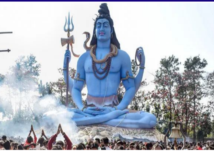
విస్తరిస్తారు. కొత్త వ్యాపారాల ప్రారంభానికి ఇది మంచి తరుణం. రాశివారికి సంపదన విపరీతంగా పెరుగుతుంది. పెద్దల నుంచి అలాగే పురోగతి కూడా ఉంటుంది. వ్యాయ సంబంధిత కేసుల్లో ఆస్తి కలిసివస్తుంది.

మహా శివరాత్రి అంటేనే అద్భుత పర్వదినం. ప్రపంచ మానవాళి, సమస్త జీవకోటికి తల్లిదండ్రులైన పార్వతీ పరమేశ్వరుల కల్యాణం జరుగుతుంది. అర్చనాత్రి సమయంలో లింగోద్భవం ఉంటుంది. అటువంటి పండగ రోజు మూడు ప్రధానమైన గ్రహాలు సంచారం చేస్తున్నాయి. కుజుడు, చంద్రుడు, బుధుడు తమ స్థానాలను మారుస్తాయి. బుధుడు పూర్వాభాద్ర నక్షత్రంలోకి, చంద్రుడు ధనిష్ఠ నక్షత్రంలోకి, కుజుడు కూడా ఇదే నక్షత్రంలోకి సంచారం చేస్తారు. ఈ ప్రభావం వల్ల ఆర్థికంగా కలిసివచ్చే రాశులు వివరాలను తెలుసుకుందాం. ధనస్సు రాశివ్యాపారాలు లాభసాటిగా మారతాయి. అప్పుల బాధ నుంచి బయటపడతారు. ఆరోగ్యం అగుంబుంది. ఉద్యోగులకు పదోవేతలున్నాయి. బంగారంతోపాటు వెండి కూడా కొనుగోలు చేసే అవకాశం ఉంది. ఉద్యోగులకు కొత్త బాధ్యతలు అందుతాయి. మకర రాశి నిలిచిపోయిన పనులన్నీ వేగంగా పూర్తవుతాయి. వ్యాపారాలను