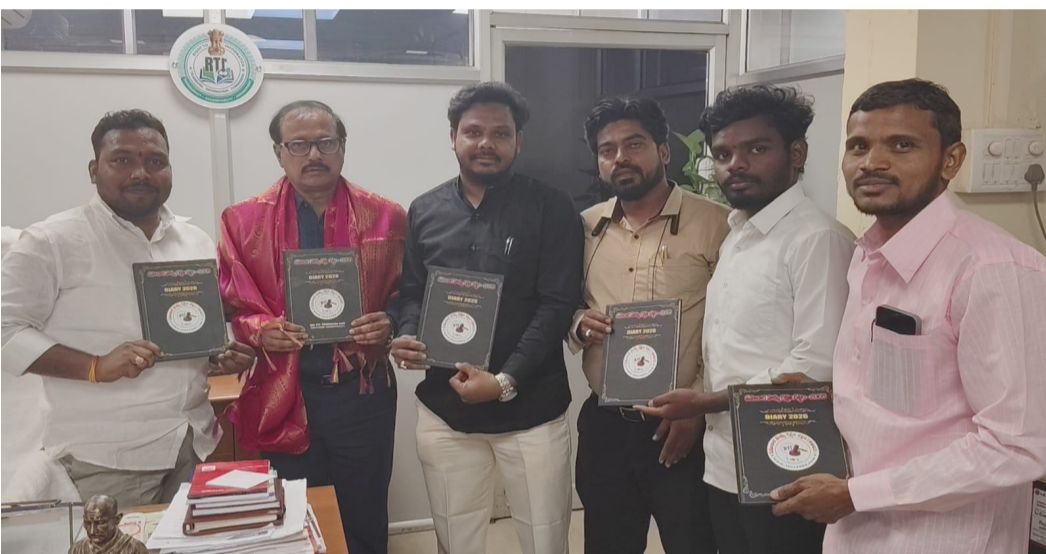
నిర్వహించడంలో కృషి చేయాలని కోరారు. అలాగే సమాచార హక్కు రక్షణ చట్టం 2005 సాస్టెటీ నభ్యులు రాష్ట్రంలో సహా చట్టంపై చేస్తున్న కార్యక్రమాలను అభినందిస్తూ సాస్టెటీ తదితరులు పాల్గొన్నారు.