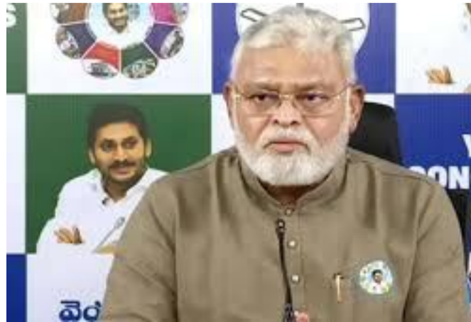
అరెస్ట్ చేసిన పోలీసులు.. ఆయన్ను కోర్టులో హాజరుపరిచి రాజమండ్రి సెంట్రల్ జైలుకు రిమాండ్ పై తరలించారు. ఈ

గుంటూరు, ఫిబ్రవరి 11: రాష్ట్ర మాజీ మంత్రి, వైసీపీ సీనియర్ నేత అంబటి రాంబాబుకు బెయిల్ మంజూరైంది. పోలీసులపై దురుసుగా ప్రవర్తించిన కేసులో గుంటూరు ఎక్సైజ్ కోర్టు.. ఆయనకు షరతులతో కూడిన బెయిల్ ను మంజూరు చేసింది. అలాగే ఆయనపై పోలీసులు వేసిన కస్టడీ పిటిషన్ ను కూడా తిరస్కరించి న్యాయస్థానం. ప్రస్తుతం.. రాజమండ్రి సెంట్రల్ జైలులో ఉన్న అంబటి.. ఈ బెయిల్ తో రేపు(గురువారం) జైలు నుంచి విడుదలయ్యే అవకాశం ఉంది. అంబటికి బెయిల్ రావడంతో గుంటూరులోని ఆయన నివాసం వద్ద వైసీపీ శ్రేణులు, కార్యకర్తలు, మాజీ మంత్రి అభిమానులు.. భాజాసంచా కాలి సందరాలు నిర్వహించారు. ఇటీవల, డి.టి.డి లద్దా వివాదంలో ముఖ్యమంత్రి చంద్రబాబుపై అసభ్యకర వ్యాఖ్యలు చేశారనే ఆరోపణలతో గుంటూరు నల్లపాడు పోలీస్ స్టేషన్ లో అంబటిపై కేసు నమోదు అయ్యింది. ఈ కేసులో అంబటిని